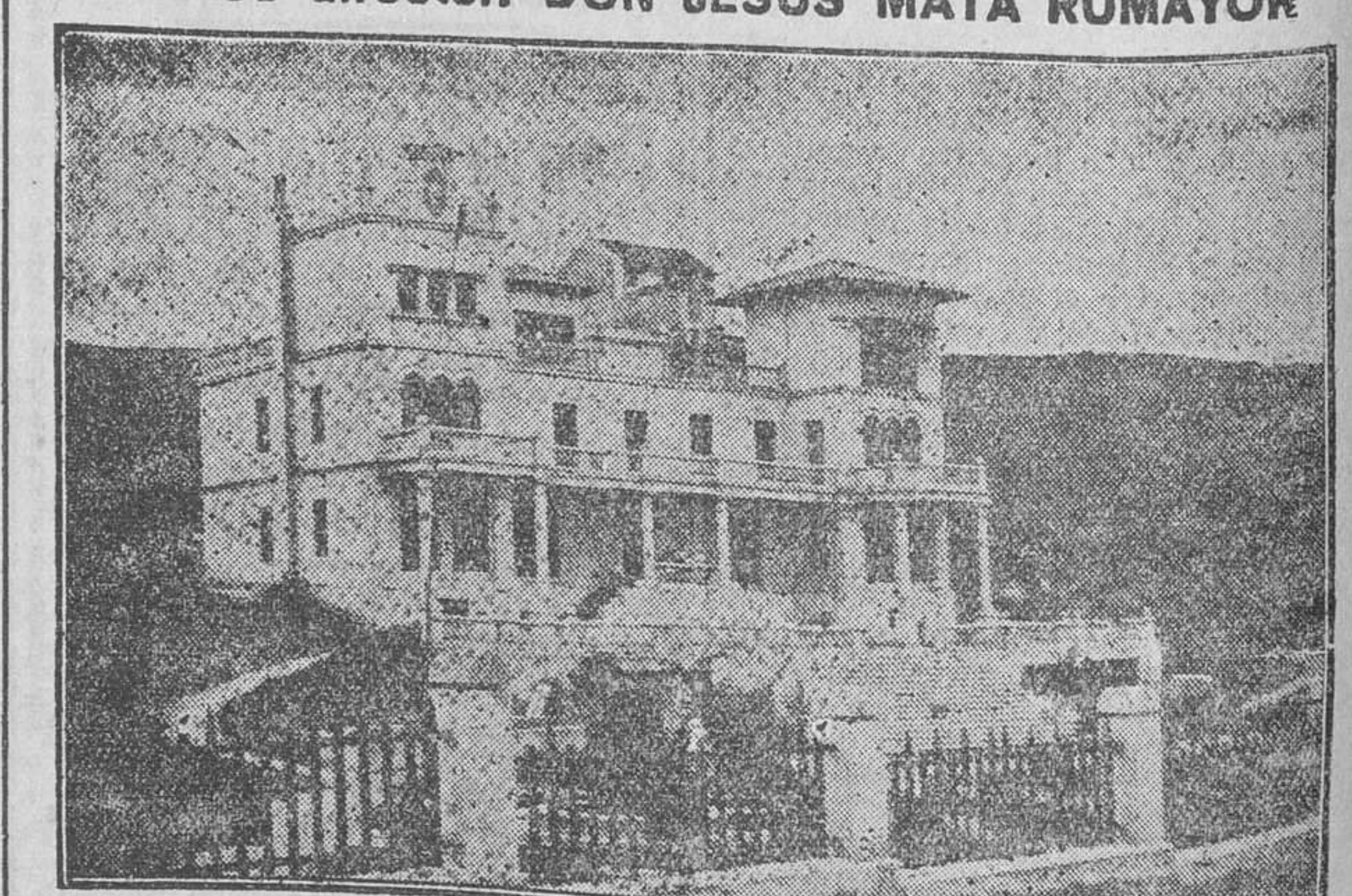
Este Sanatorio está principalmente destinado a las enfermedades de los órganos respiratorios y articulares en sus afecciones tuberculosas, siendo de inmejorable resultado en los estados pre-tuberculosos, enfermedades de la nutrición, raquitismo, etc., etc. Su bella situación, hermosa instalación y confort le hacen ser uno de los mejores de España.