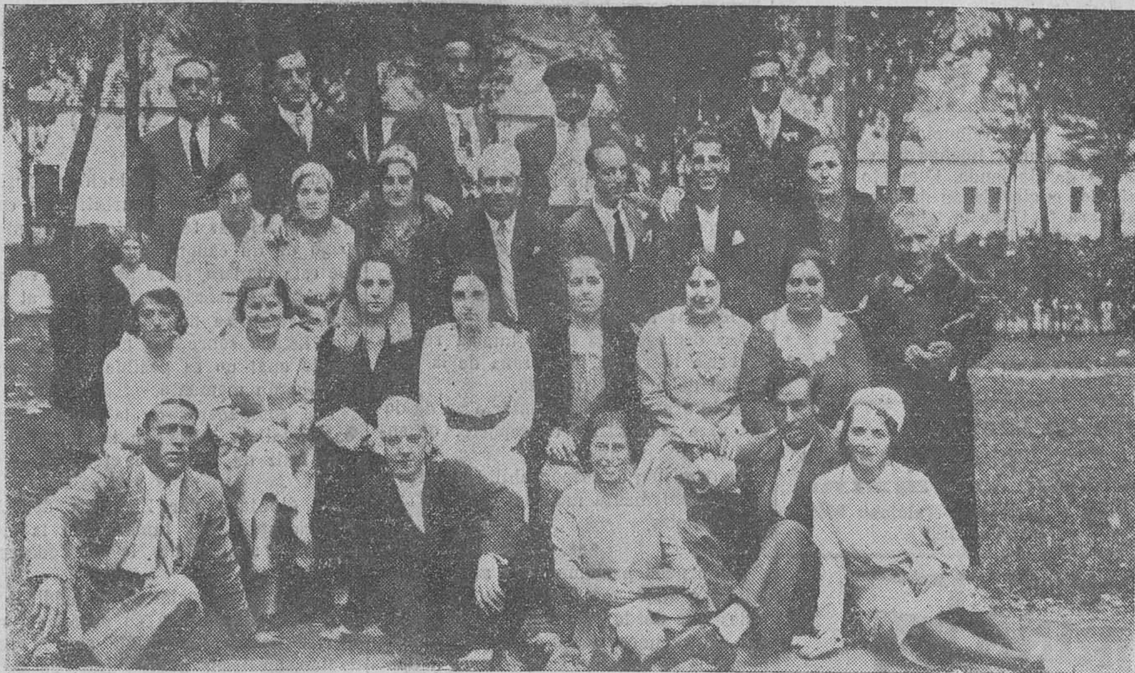
Grupo de la excursión a Laredo organizada por la Sociedad artística y recreativa "La Amistad", de Santander.