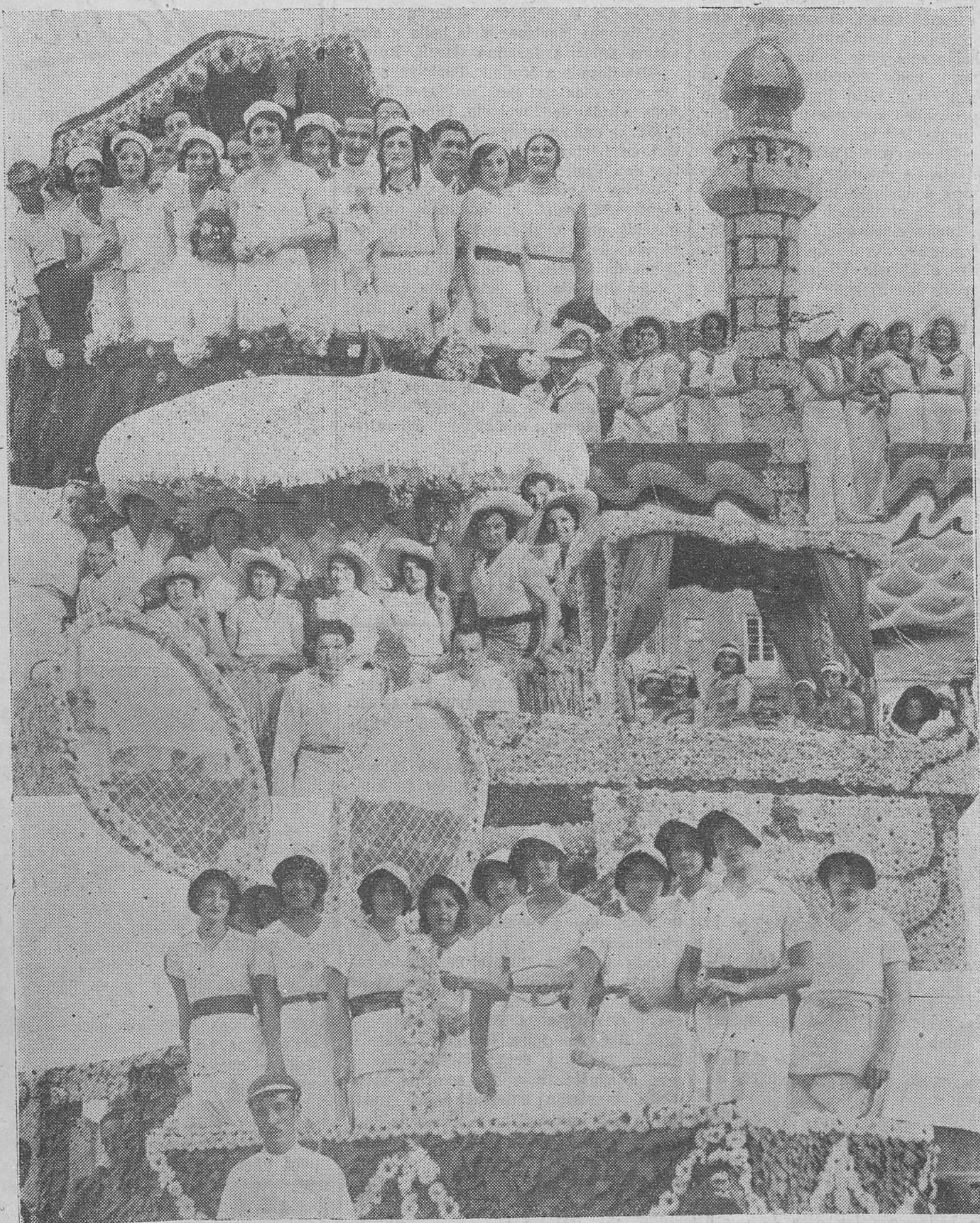
LA BATALLA DE FLORES DE LAREDO.—Número 1, primer premio, "España republicana", de los señores Piedra Hermanos.—Número 2, segundo premio, "Molino de viento", de don Sebastián Ontalvilla.—Número 3, tercer premio, "Nave del siglo XV", de don Benito Peña.—Número 4, cuarto premio, "Jarrón árabe", de doña Luciana Linaje.—Un detalle de la batalla.

Bar LOS CARACOL RESTAURANT ECONOMICO RINCÓN, NUM. 7. — SANTANDER