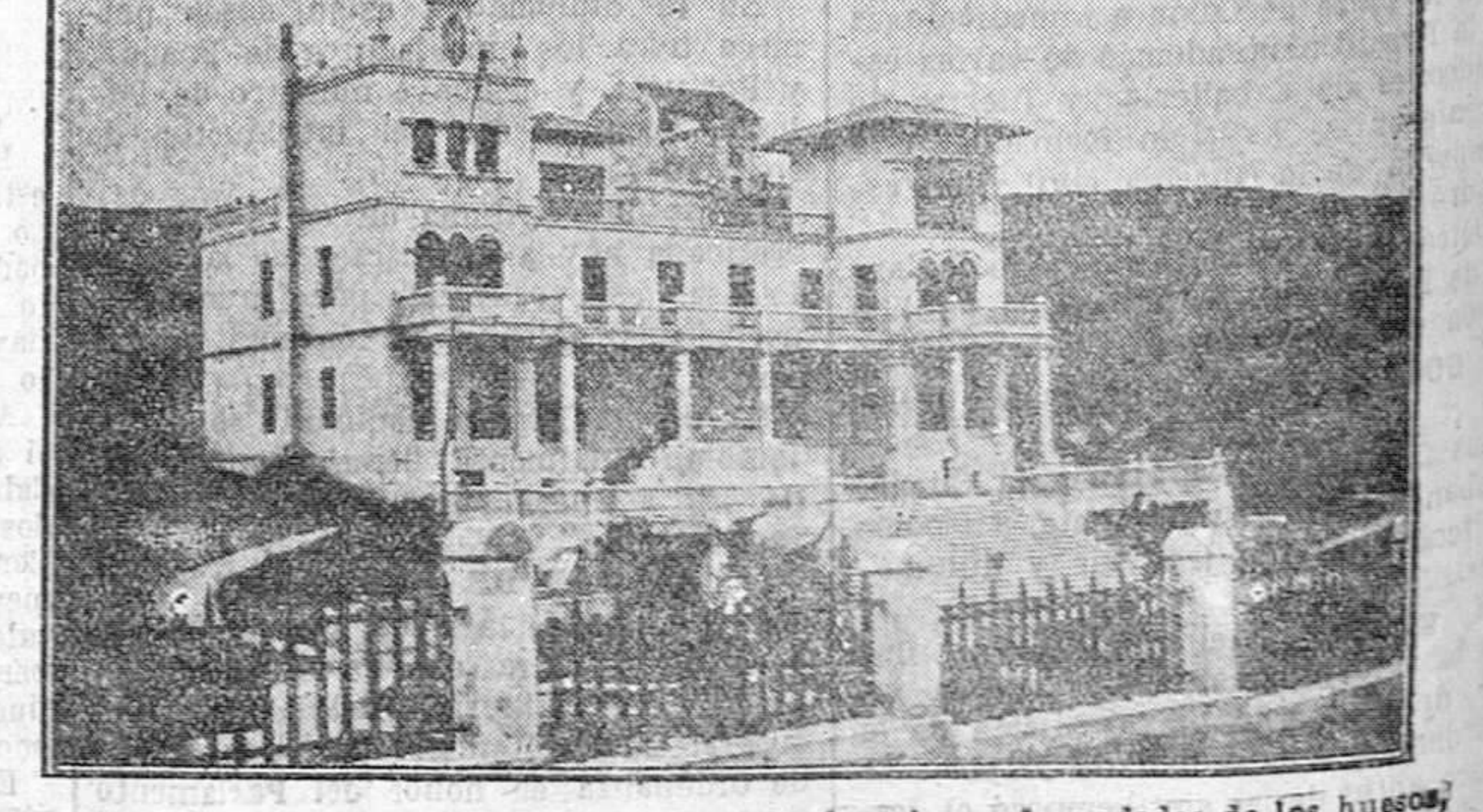
Este Sanatorio está principalmente destinado a las enfermedades de los huesos, músculos y articulaciones en sus afecciones tuberculosas, siendo de inmejorables resultados en los estados pre-tuberculosos, enfermedades de la nutrición, raquitismo, etc., etc. Su bella situación, hermosa instalación y confort le hacen ser uno de los mejores de España.