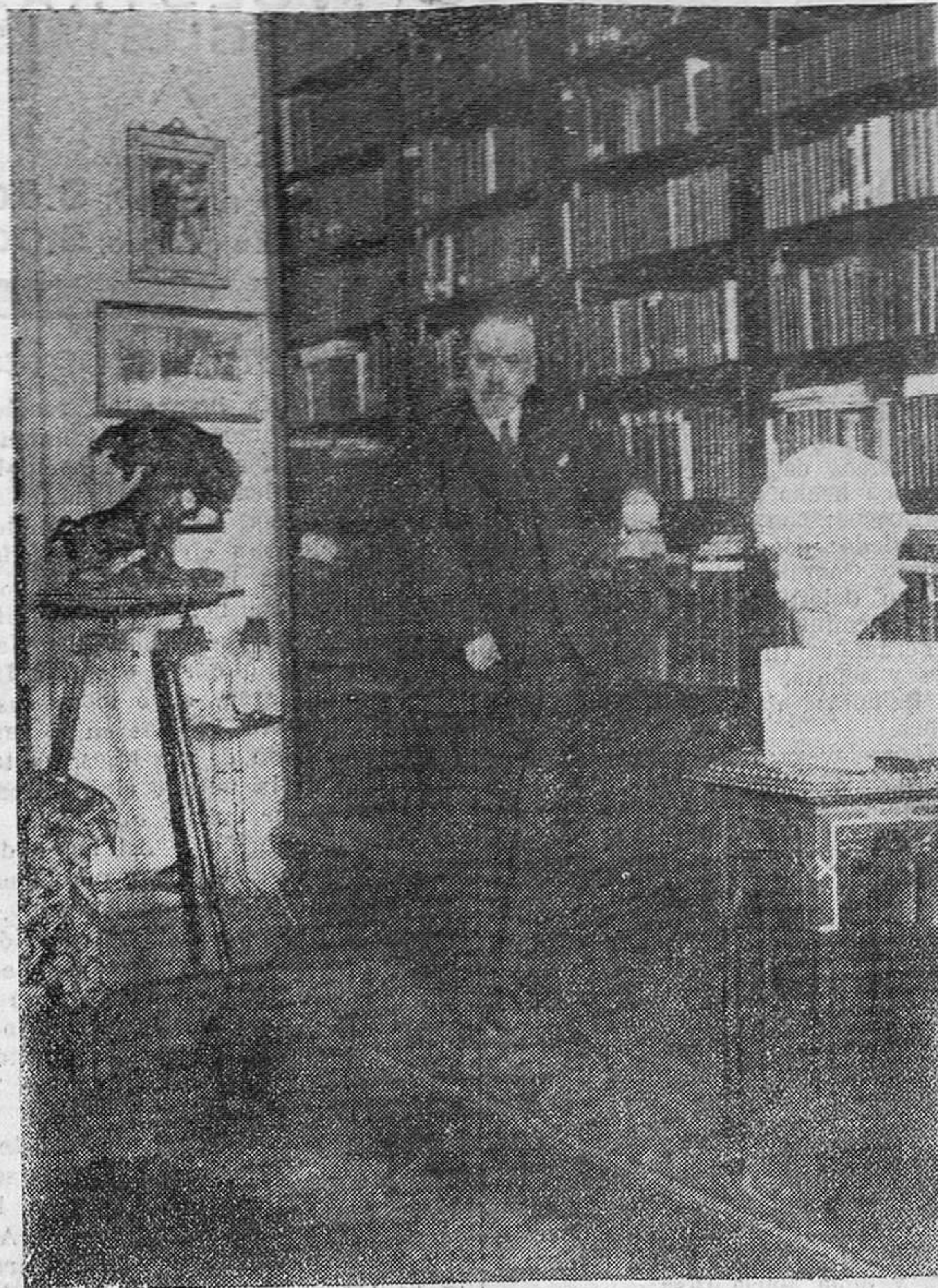
Don José Francos Rodríguez, presidente de la Asociación de la Prensa, fallecido en Madrid en la madrugada de ayer. Retrato recientemente obtenido unos días antes de su muerte.