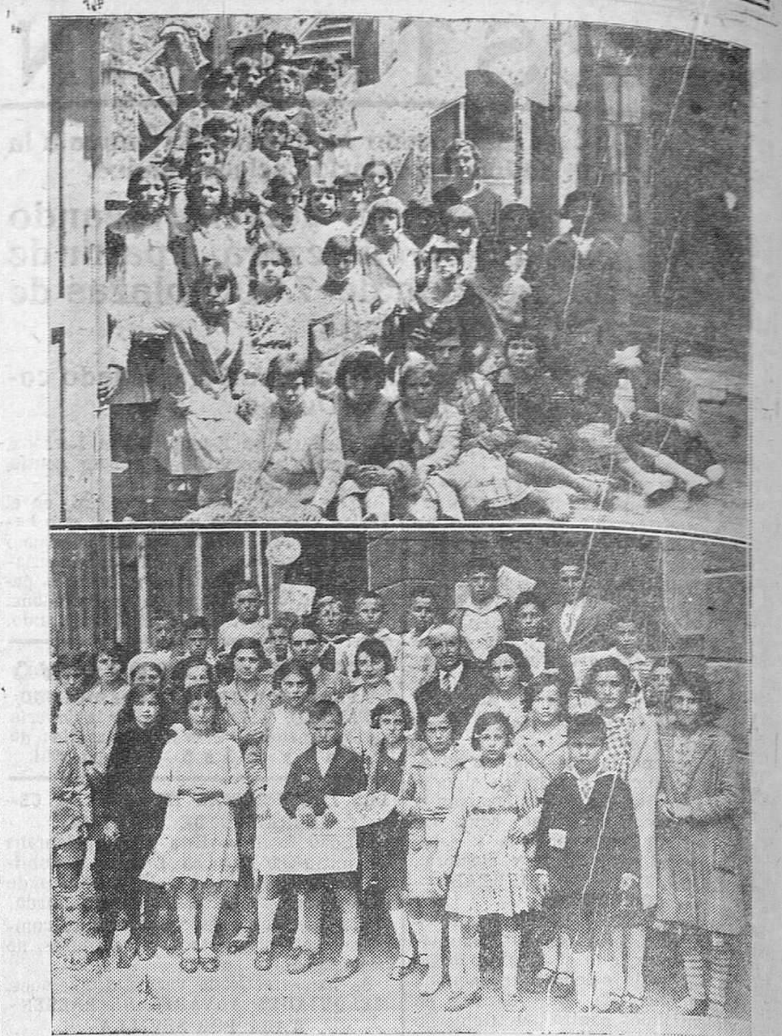
EXCURSION ESCOLAR. Los niños de las escuelas de Vierna, San Mamés de Meruelo, Noja y Cicero, en los talleres de EL CANTABRICO.