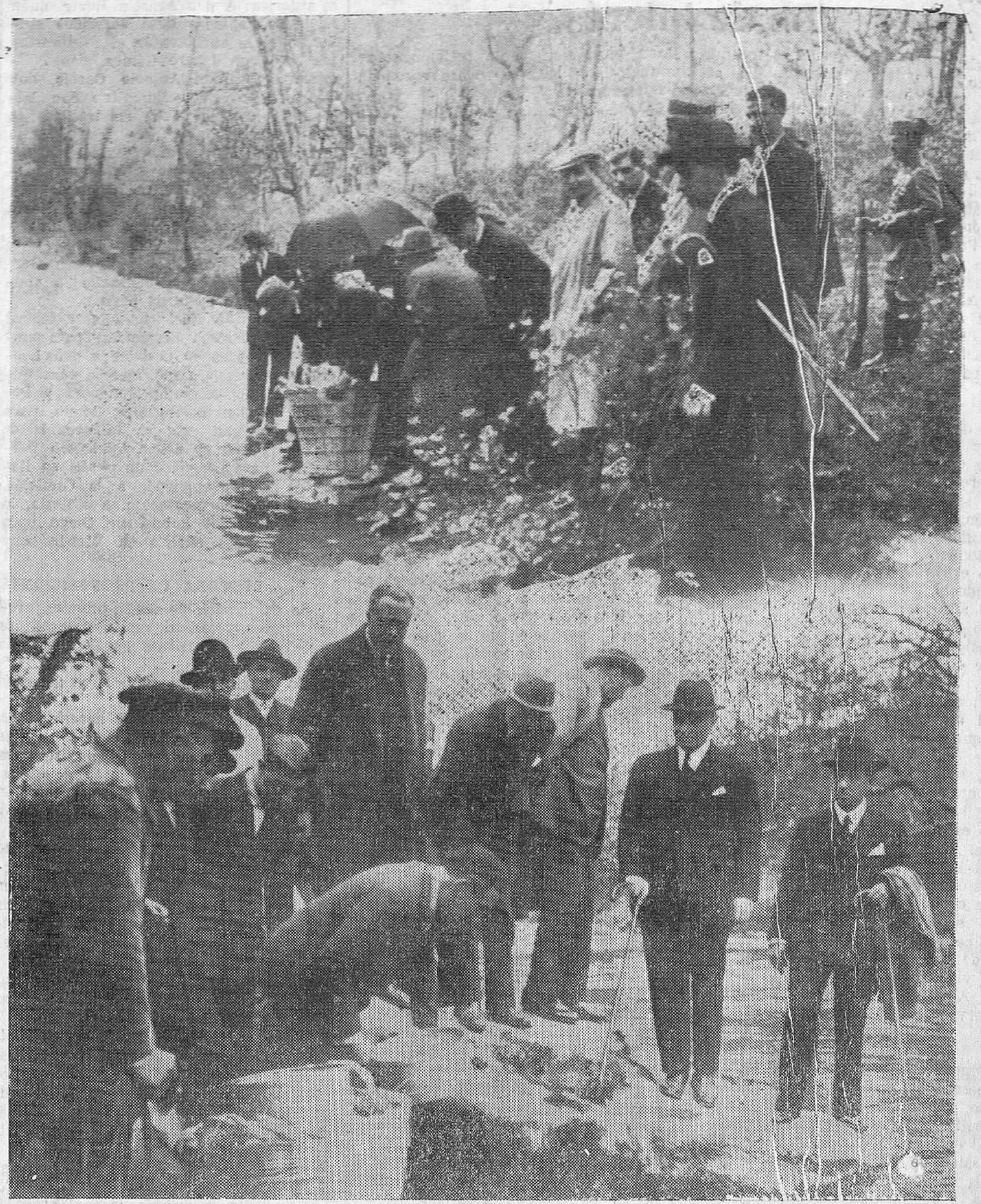
Momento de ser lanzadas al Miera las diez mil crías de salmón para la repoblación de aquel río.

Actos para hoy.—A las siete de la mañana, alegre diana por la Banda municipal; a las ocho, las Directivas de esta Federación depositarán una corona de flores sobre la tumba del compañero muerto durante los sucesos de diciembre; a las nueve, partirá la manifestación del Centro Obrero, acompañada de la Banda de música, con dirección a los campos del Malecón, donde, a las diez, se celebrará un gran mitin,