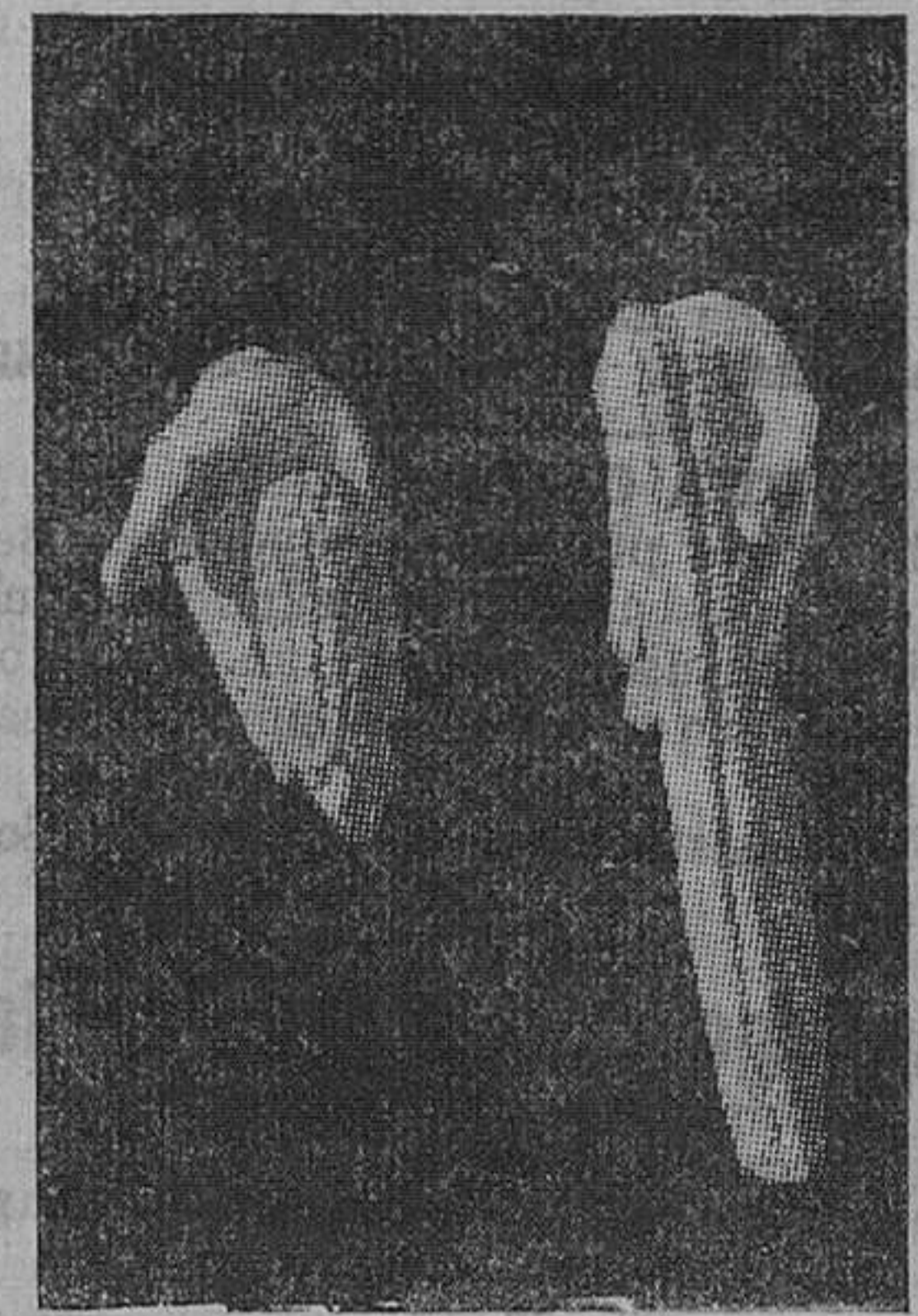
Comparación gráfica de una espiga del país, que produce 3.000 kilos por hectárea, y una de la Misión Biológica, que rinde más de 6.000 kilos.