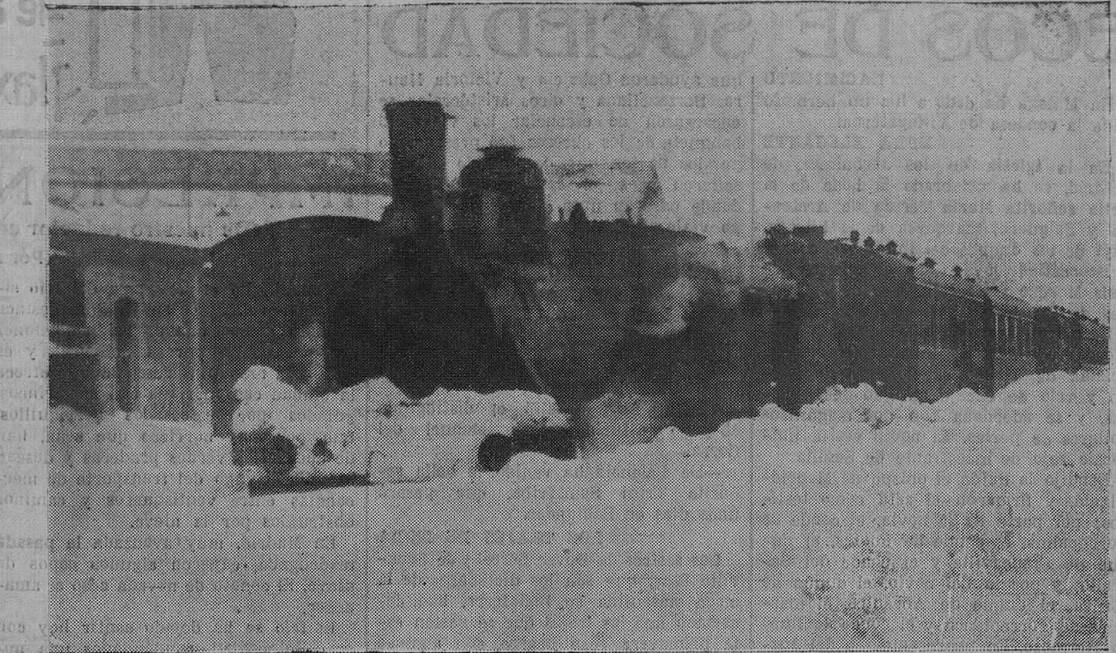
Los trenes circulan con gran retraso, a causa de la nieve caída entre Reinosa y Alar en estos días pasados.

Al recibir el señor La Cierva a los periodistas, se refirió a las manifes-