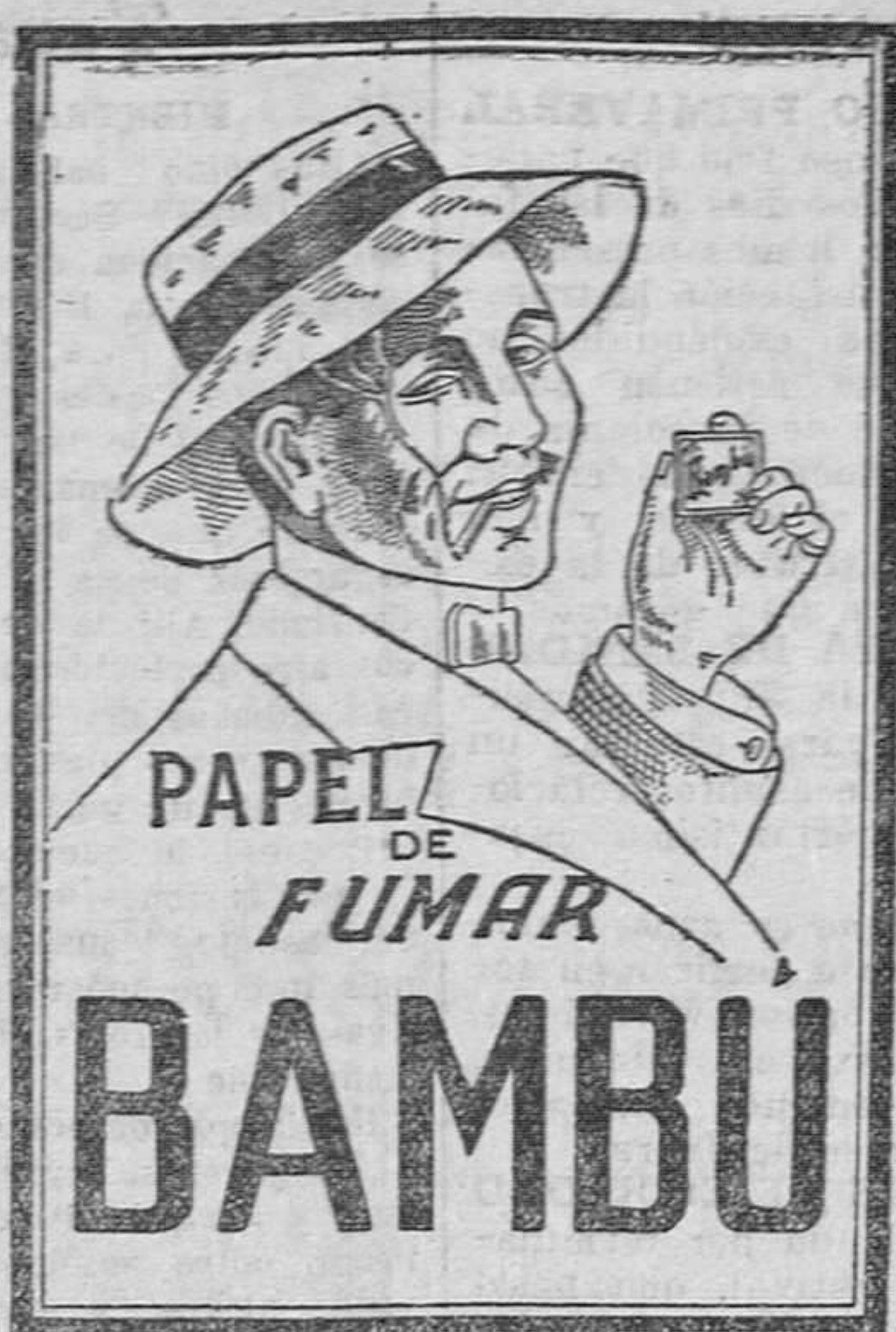
Ha obtenido GRAN PREMIO en la Exposición de Barcelona de 1929

Como digno final de nuestras fiestas, fué la actuación de Voces Cantabras, que, bajo la dirección de doña Matilde de la Torre, hizo su debut en la fiesta castellanoaleonesa, celebrada en el Teatro Calderón, en la tarde del día 27, y cuyo éxito fué indescriptible, deseando nosotros tener la delicada pluma de dicha señora para poder tratar con la extensión que se merece tan simpática fiesta.