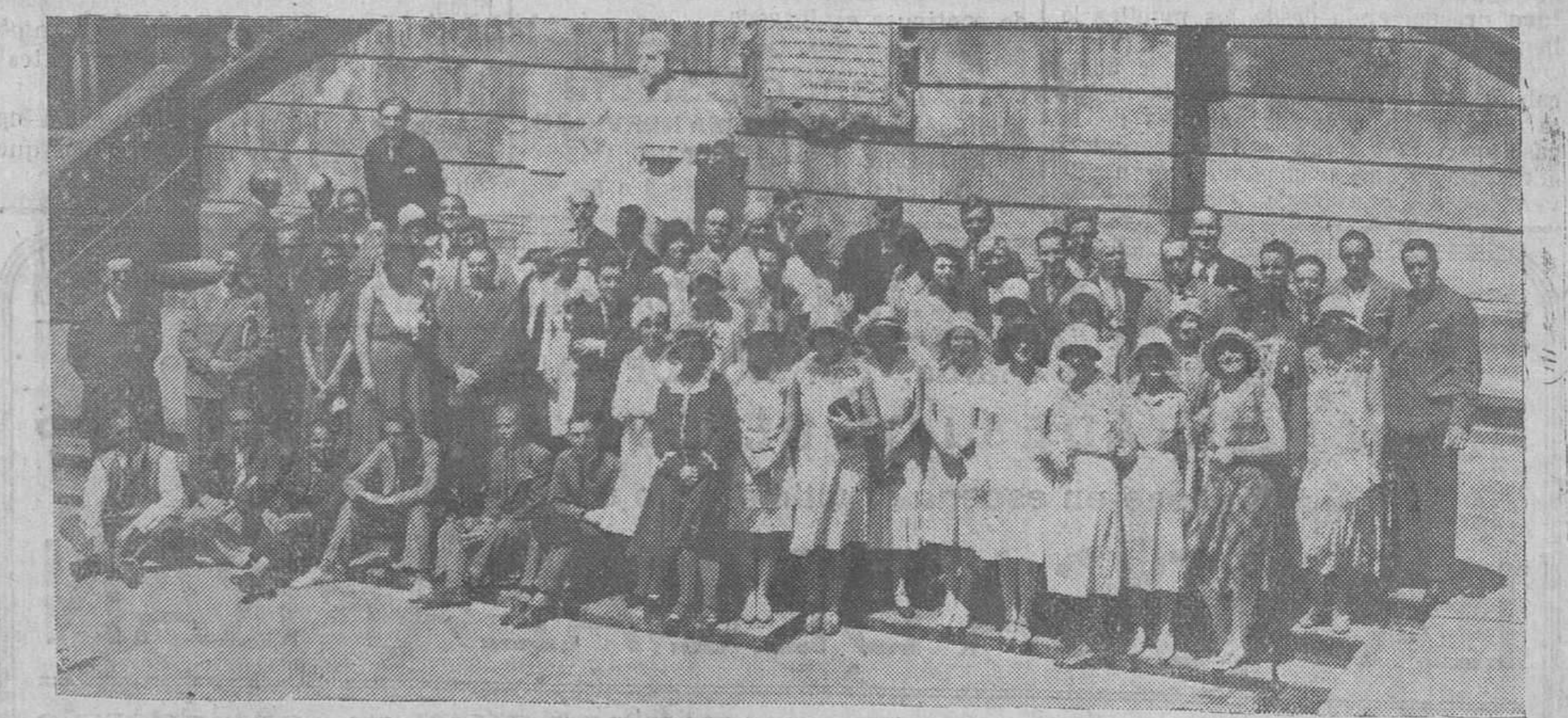
EL CURSO DE EXTRANJEROS EN LA BIBLIOTECA DE MENEZDEZ Y PELAYO. — Interesante grupo de jóvenes que asisten al Curso de extranjeros. Esta muchachada es estudiante en las principales Universidades de Inglaterra, Francia y Alemania.