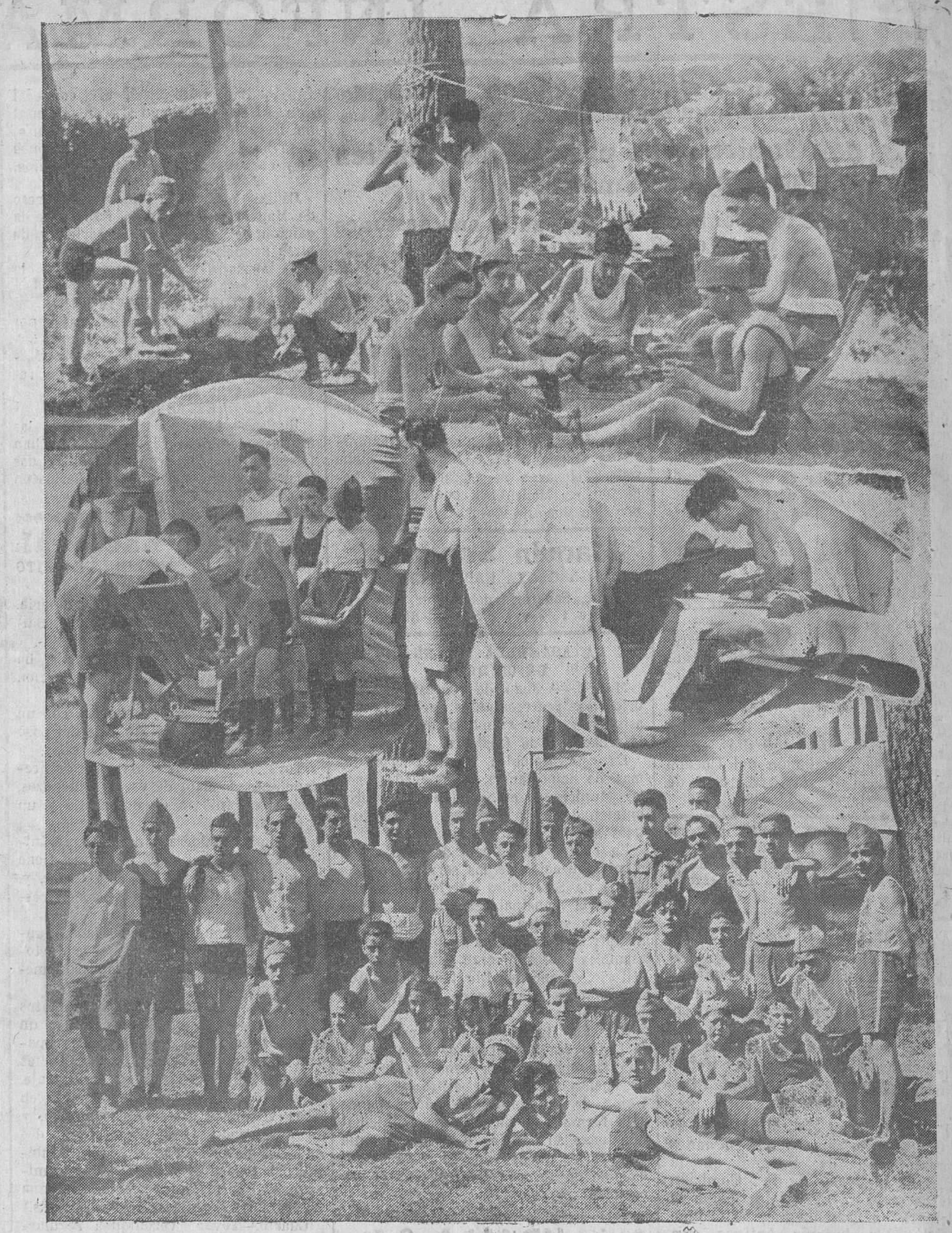
Los exploradores de Valladolid, que están acampados en los pinares de Cabo Mayor, sorprendidos por nuestro compañero "Samot", y posando para EL CANTABRICO.