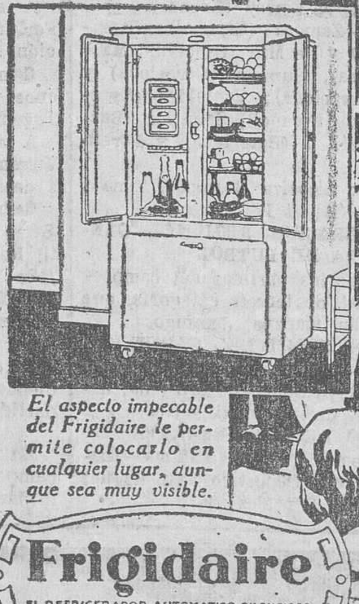
El aspecto impecable del Frigidaire le permite colocarlo en cualquier lugar, aunque sea muy visible.