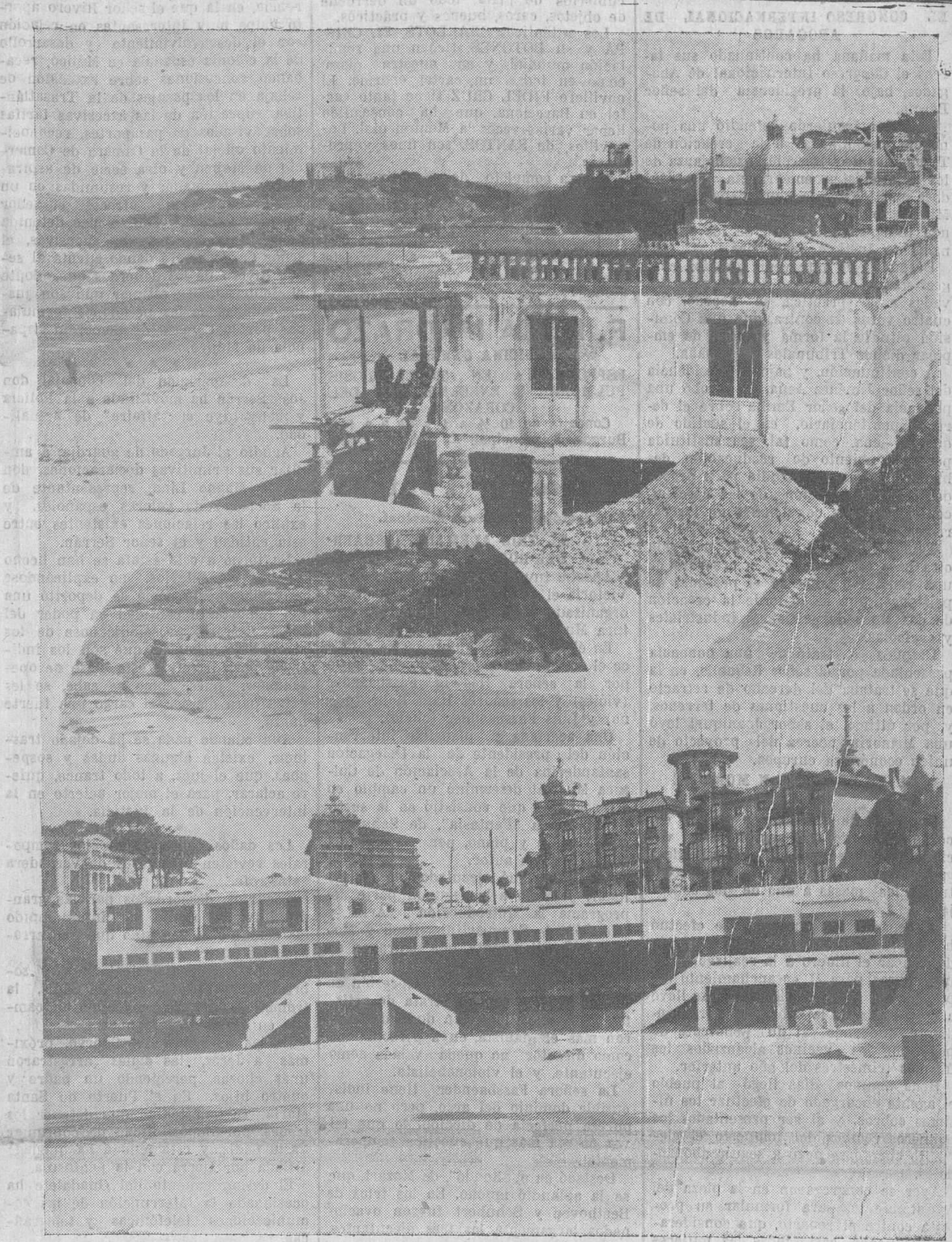
La proximidad del verano acelera las obras que se llevan a cabo en la población y Sardinero. En estas fotos pueden apreciarse las de embellecimiento de nuestras plazas, algunas de las cuales se encuentran algo atrasadas.