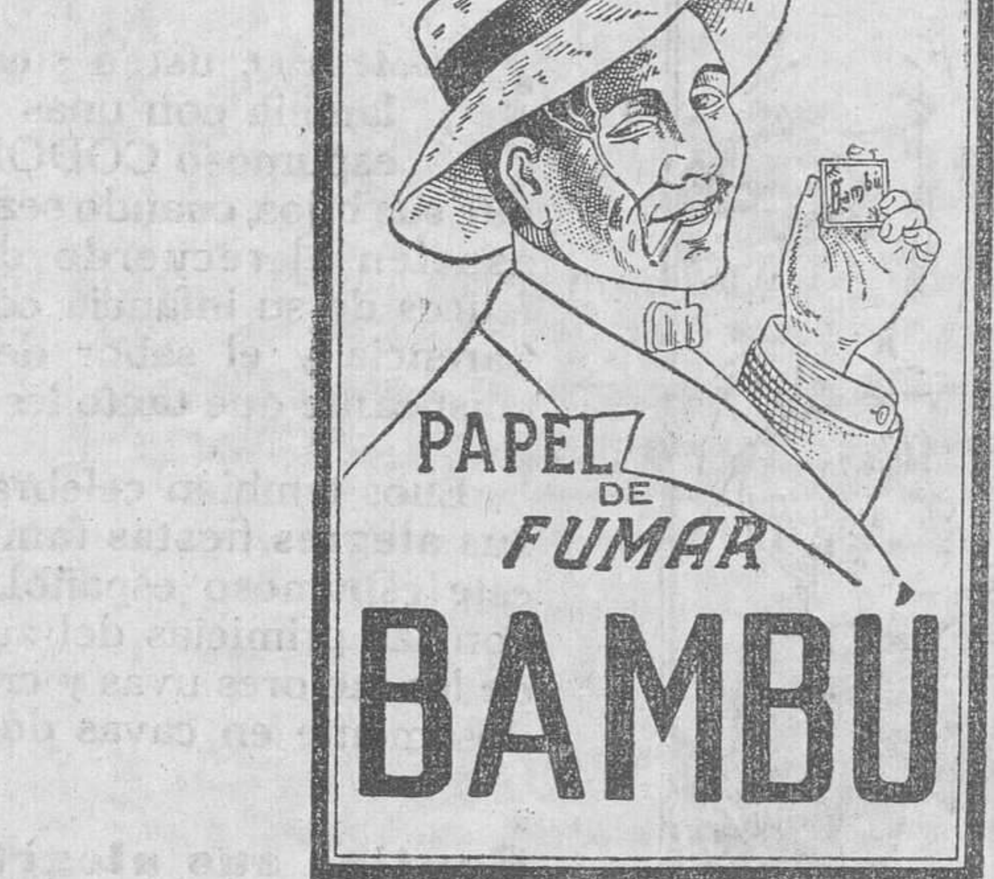
Ha obtenido GRAN PREMIO en la Exposición de Barcelona de 1929

Es sencillamente vergonzoso lo que sucede con la recogida de basuras. Ayer eran las doce del día y estaban sin recoger las de la calle de José María de