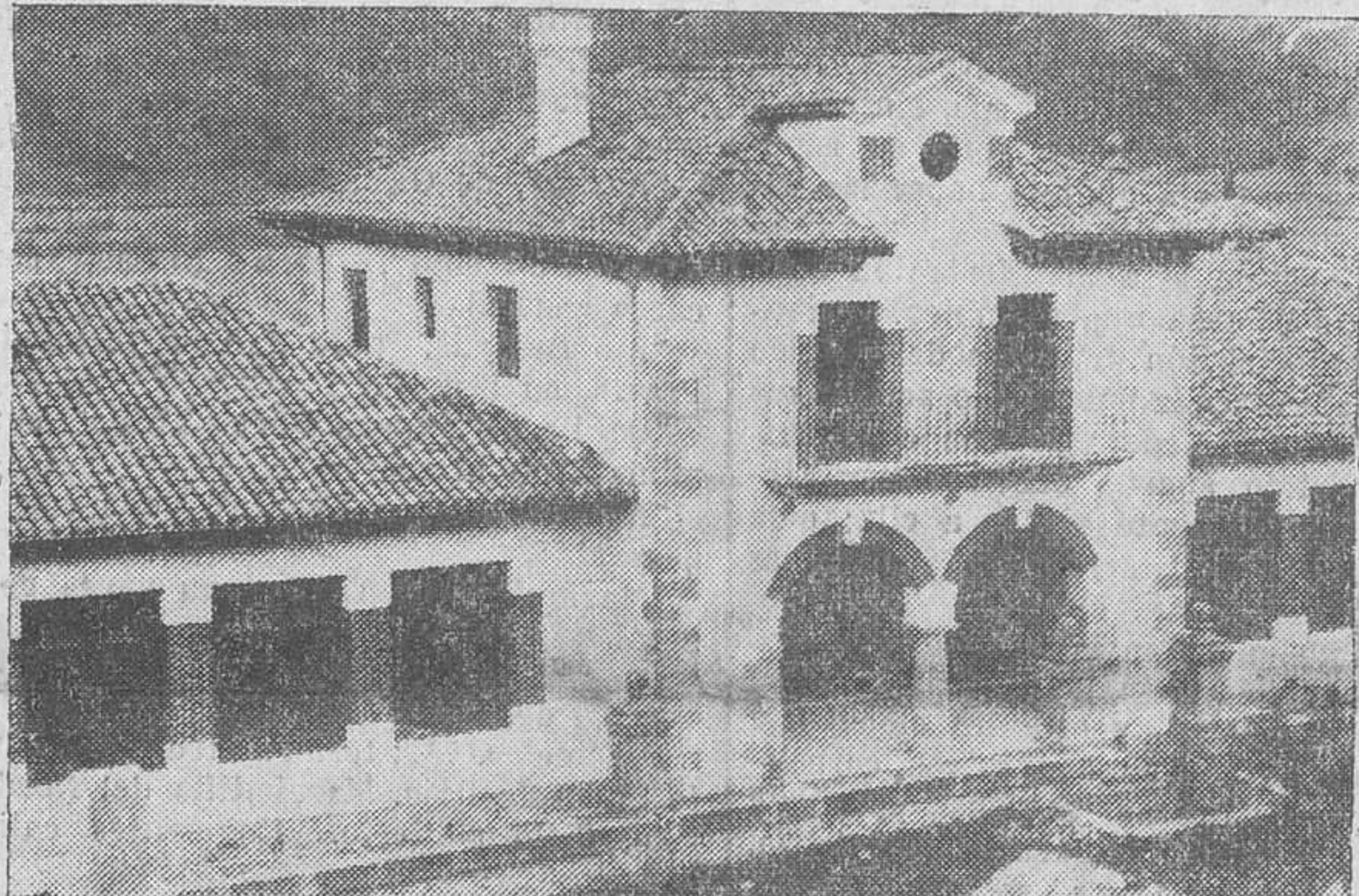
Las magnificas escuelas inauguradas en el bonito pueblo de Uceda.

ritorio y laudable del esfuerzo realizado por el Ayuntamiento al construir las magnificas escuelas, con las cuales debe enorgullecerse este pueblo. Después pasó a exponer la importancia que la educación e instrucción del pueblo tiene para el progreso y bienestar de la sociedad. También don Pedro Serna, que des-