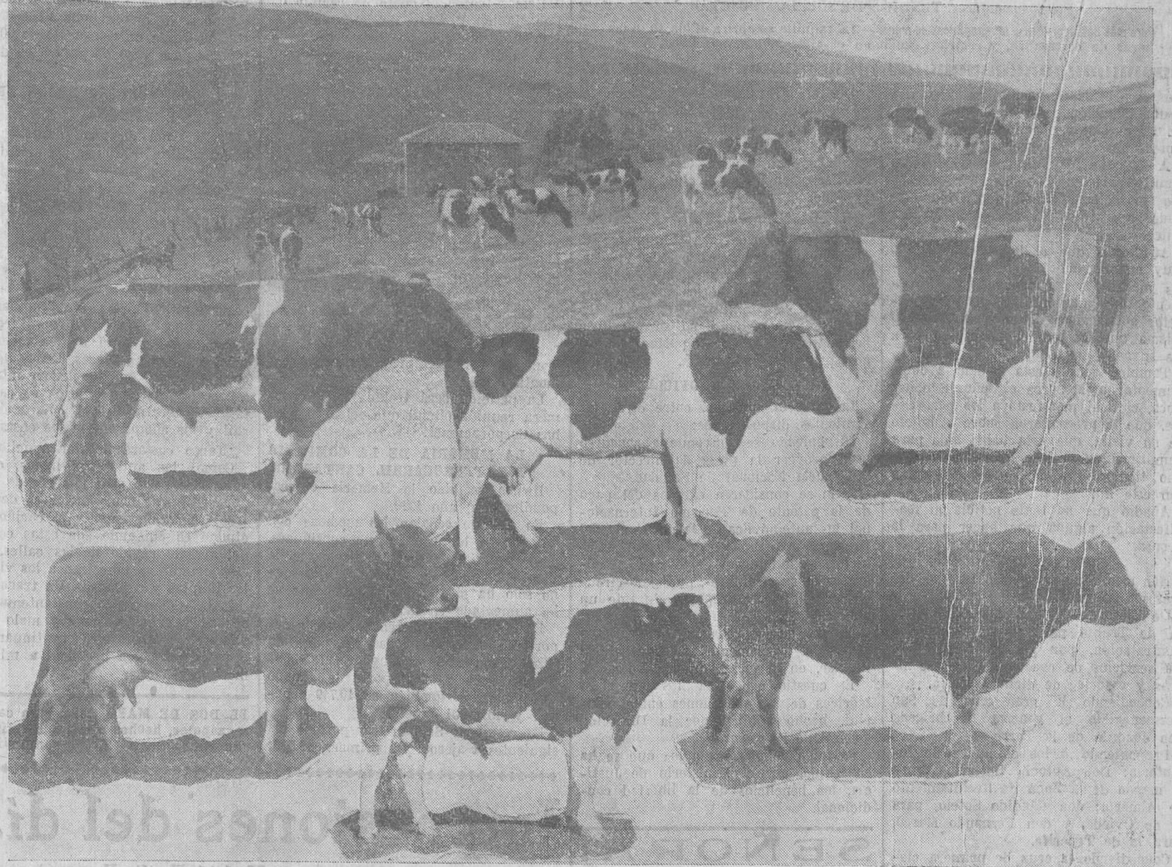
Varios de los magníficos ejemplares de ganado vacuno que serán enviados en el tren ganadero del domingo, para tomar parte, representando a la ganadería montañesa, en la Exposición de Ganados de Madrid, y cuya apertura se celebrará el día 15.

Todas las cosas honradas, tarde o temprano, terminan por imponerse. La Asociación de Amigos del Niño lo va haciendo también. Poco a poco van agrupándose a su alrededor los verdaderos amantes de la educación de los hijos del pueblo. Las becas concedidas ahora sólo son el comienzo de sus propósitos. Los resultados que obtenga con sus protegidos justificarán la petición de que se atienda a la cultura sin que la posición económica de los niños pueda ser nunca un obstáculo que impida el llegar a la Universidad, como venimos defendiendo en estas cuartillas. Ante pruebas irrefutables que puedan mostrarse, el triunfo es cosa segura. Y no creemos que nadie, amante de la educación de los humildes, pueda permanecer ajeno a las actuaciones de estos grupos de Amigos del Niño, sin prestarles su apoyo material y moral.—Jesús REVAQUE.