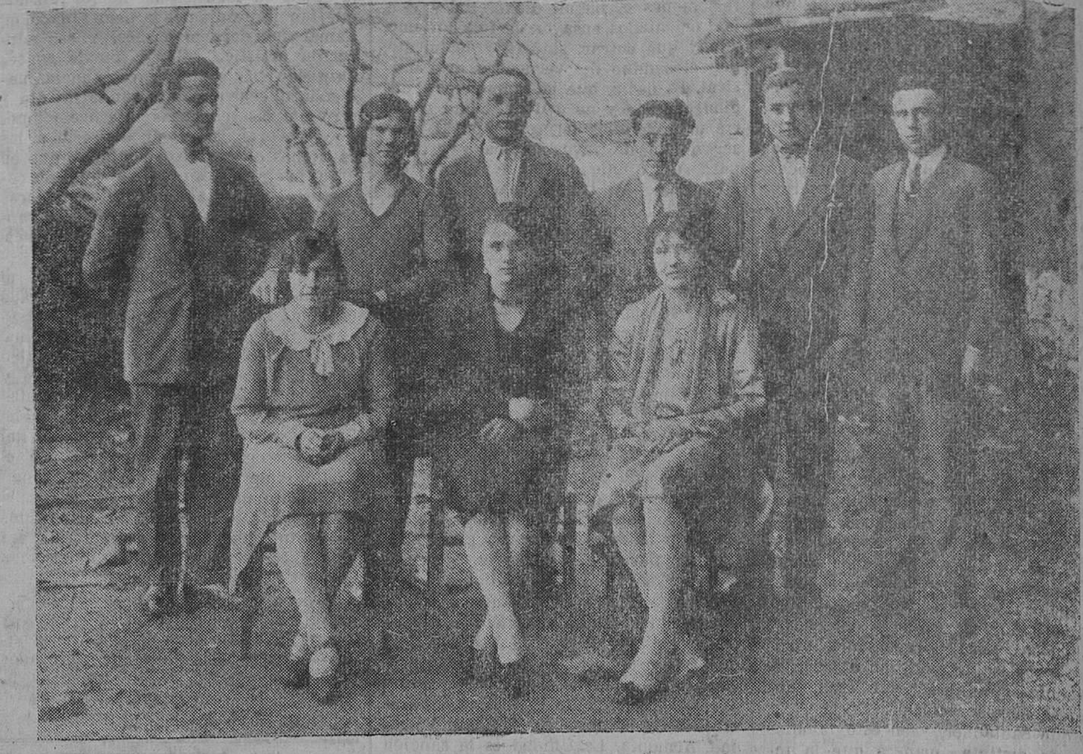
Grupo de jóvenes aficionados de Soto la Marina, que el próximo domingo debutarán en el teatro de aquella localidad.