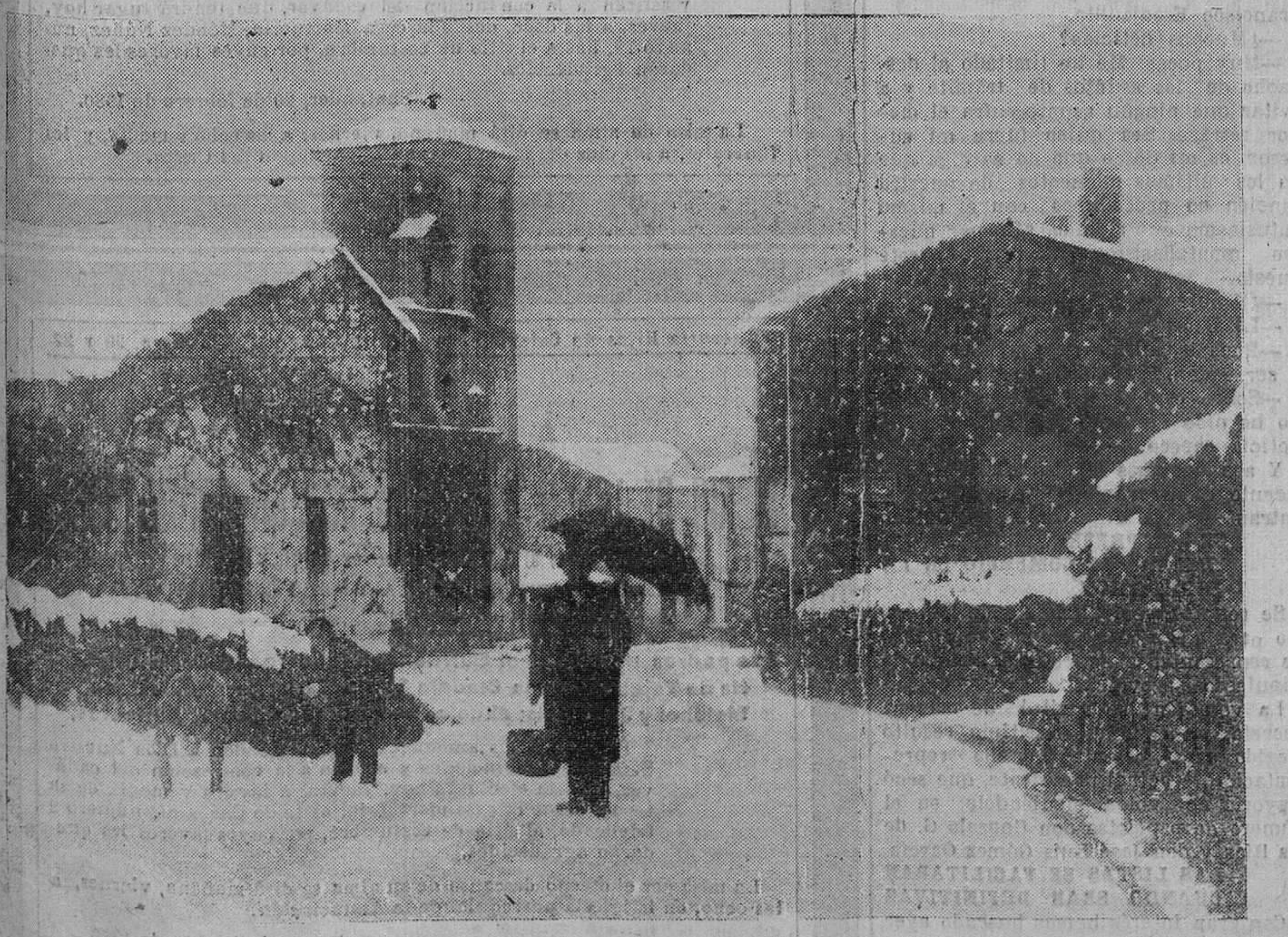
LA NIEVE EN LA PROVINCIA. — El pueblo de Mirones, bajo la nieve, semeja un estupendo telón de fondo para representar alguna zarzuela de Barbieri. El tenor, bajo el paraguas familiar, avanza hacia la batería para acometer las primeras notas de la romanza obligada.

El señor García Sanchiz tenía el propósito de desarrollar un tema de gran actualidad, y al enterarse de ello la Dirección general de Seguridad le