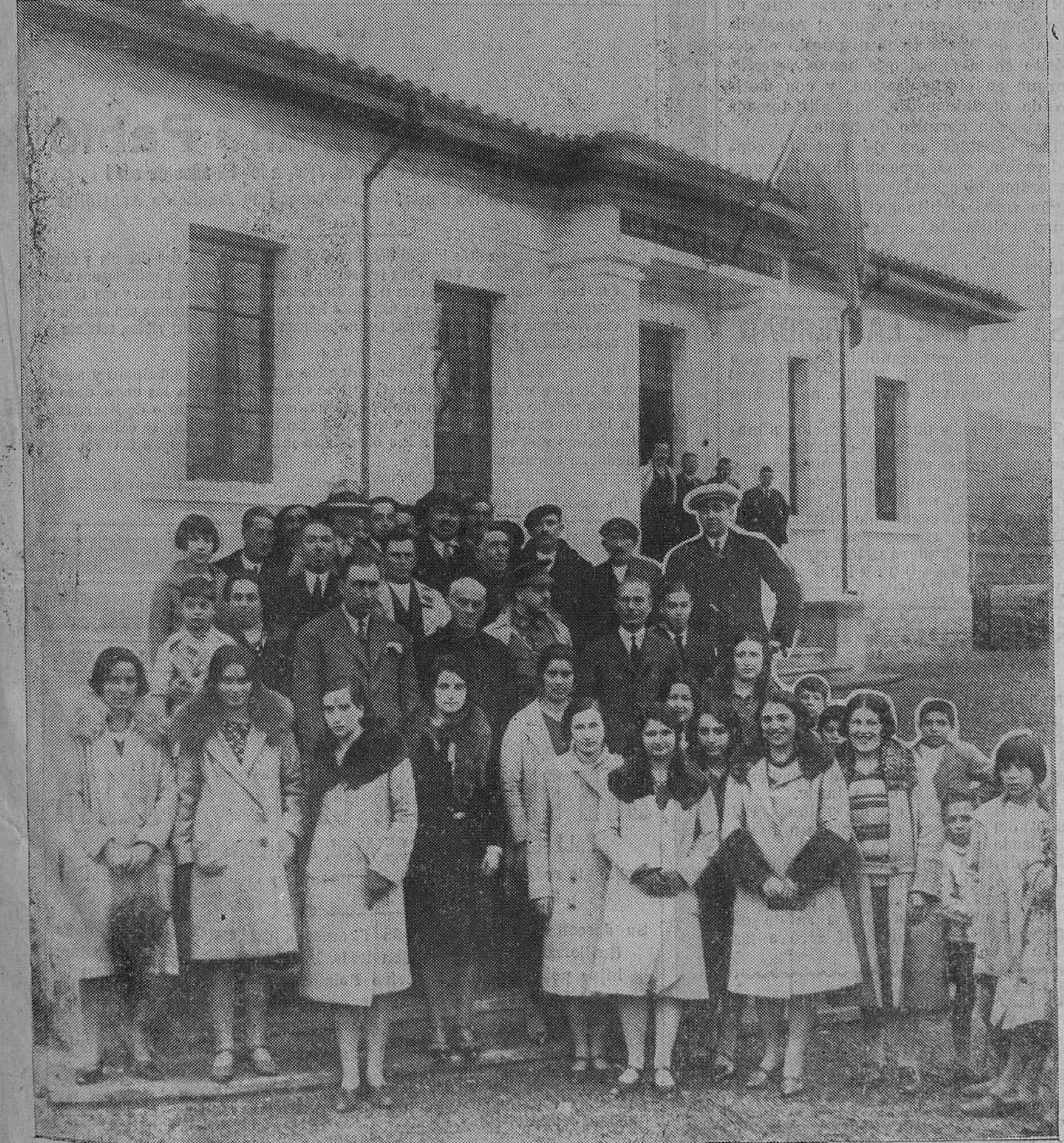
LIÉRGANES. — La Casa Ayuntamiento inaugurada el domingo. El delegado gubernativo, el alcalde, concejales, invitados y bellas señoritas, que, con su presencia, dieron realce al acto.