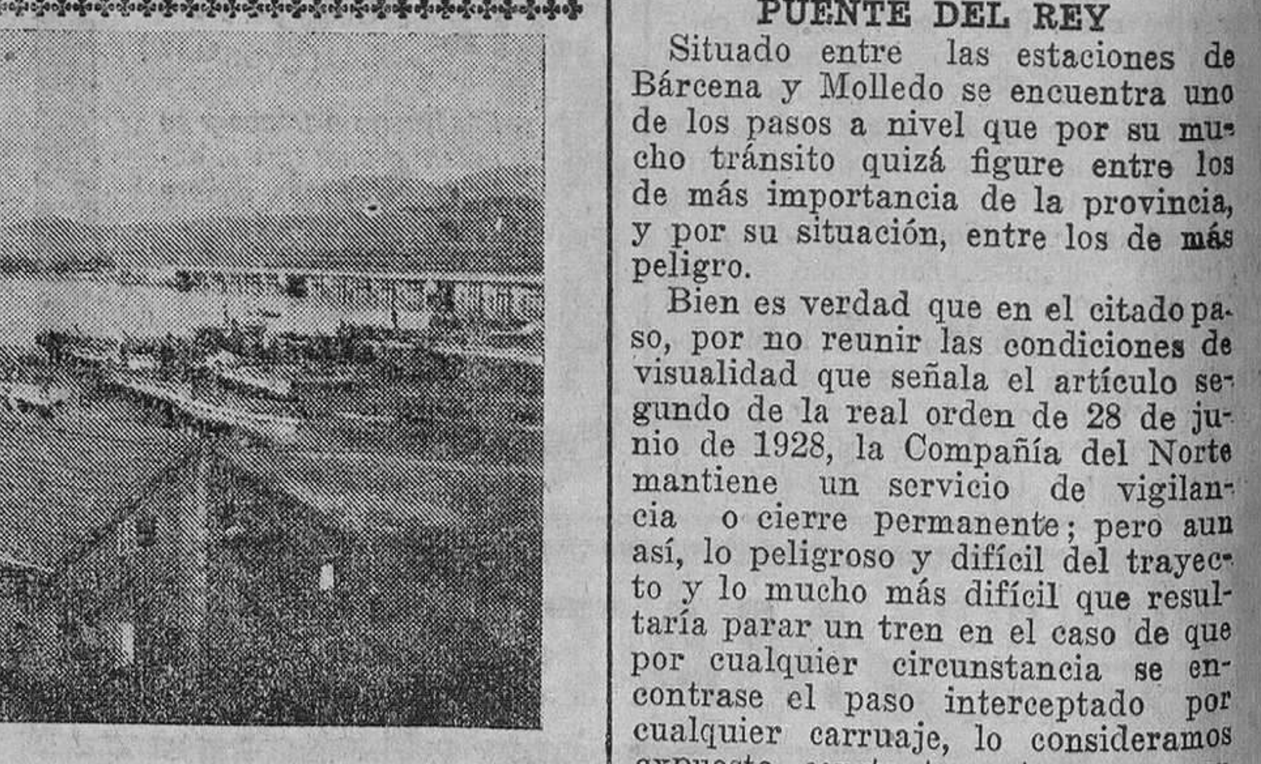
SANTONA. — Un equipo de vapores preparándose para las costeras de invierno en esta villa. Al fondo, uno de los puentes de la carretera de Santona a Cicero.