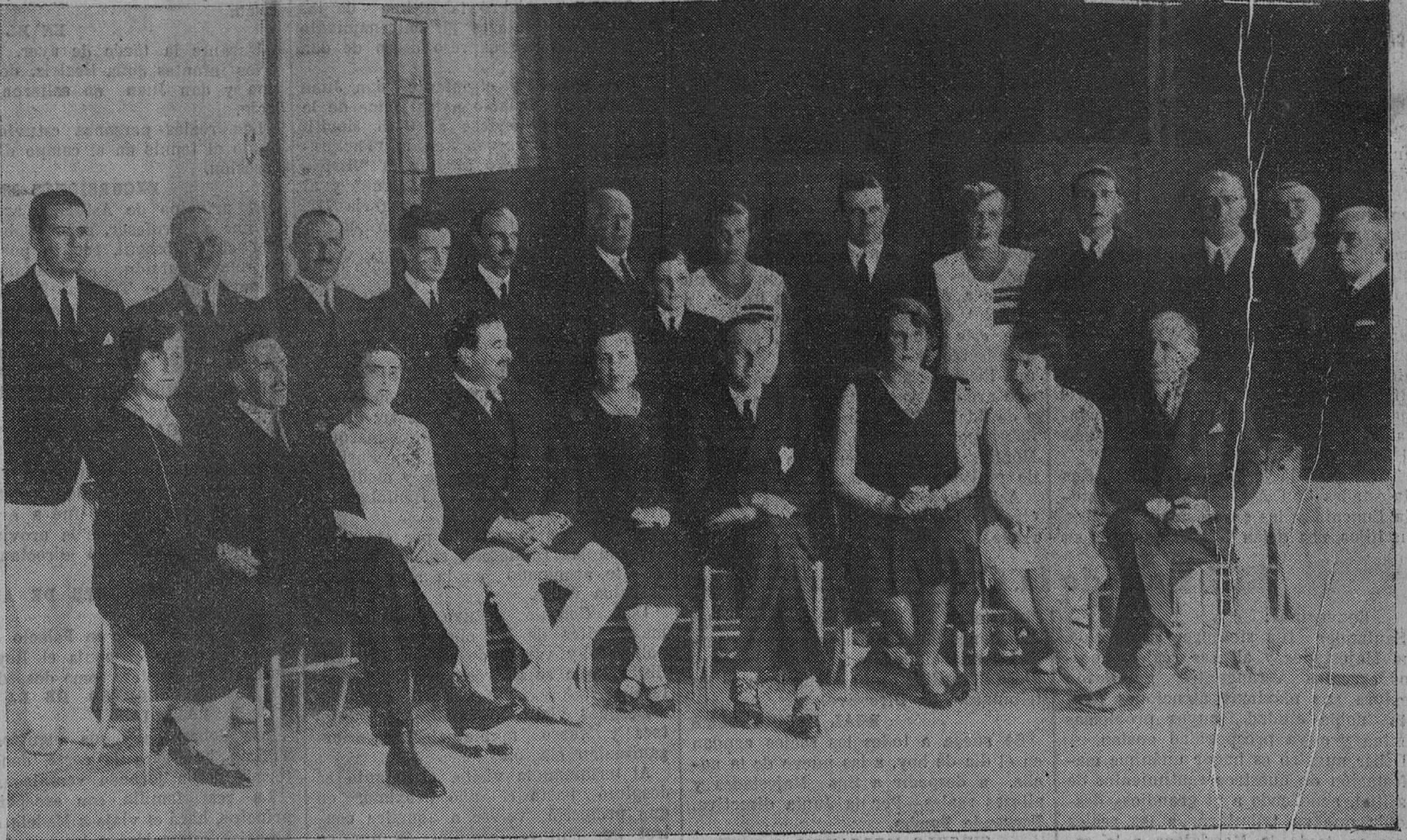
Grupo de la real familia, que, como todos los años, días antes de abandonar el Palacio de la Magdalena se hace como recuerdo de la temporada veraniega. Por autorización especial, nuestro redactor gráfico, "Samot", fue uno de los fotógrafos que retrataron a las personas reales, que hoy dan por terminada la jornada en Santander, preparándose nuestra ciudad a dispensarles una entusiástica despedida.

Vías urinarias, partos y enfermedades de la mujer.—DIATERMIA. Consulta de diez a uno y de tres a cinco. Acos de Escalante, 10, 1.—Tel. 3774.