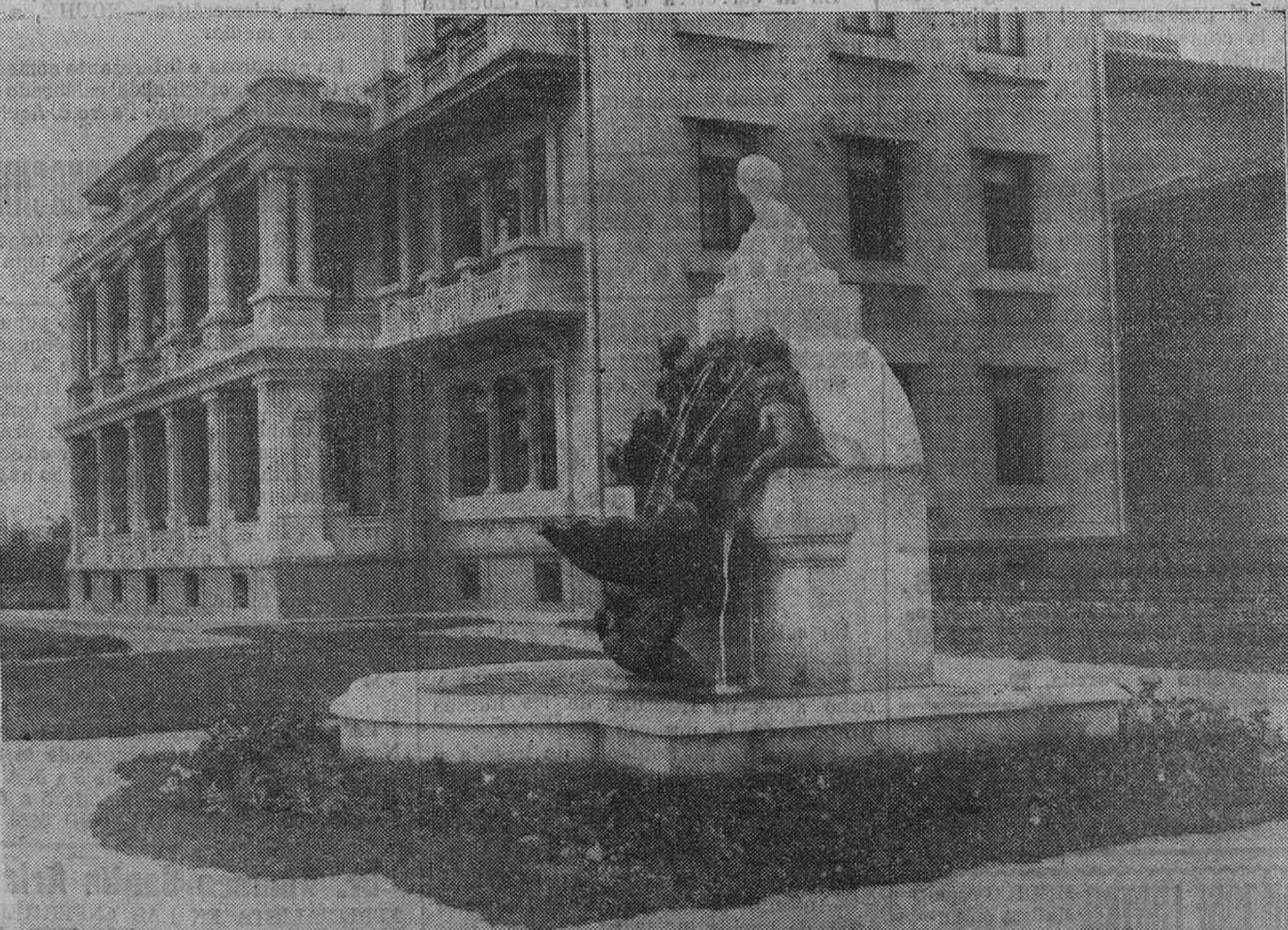
MONUMENTO DEDICADO A LA MARQUESA DE PELAYO. — La notable obra de Benlliure, que ha sido costeada por la Diputación provincial se ha erigido en la Casa de Maternidad, y será inaugurada esta tarde por los Reyes.