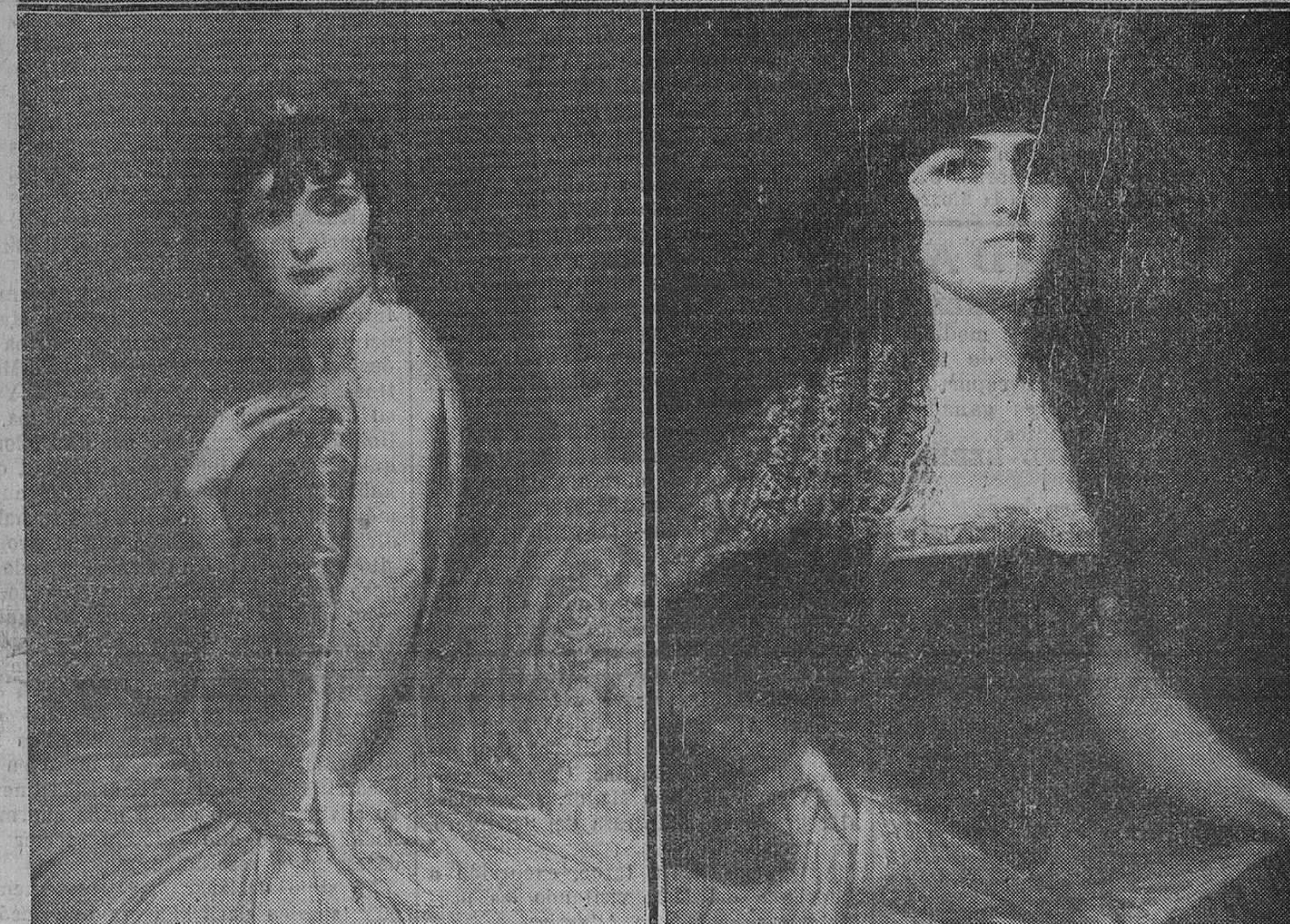
LA EXPOSICION EDUARDO SORIA, EN EL ATENEO. — Tres bellos retratos, que llamarán poderosamente la atención del público.