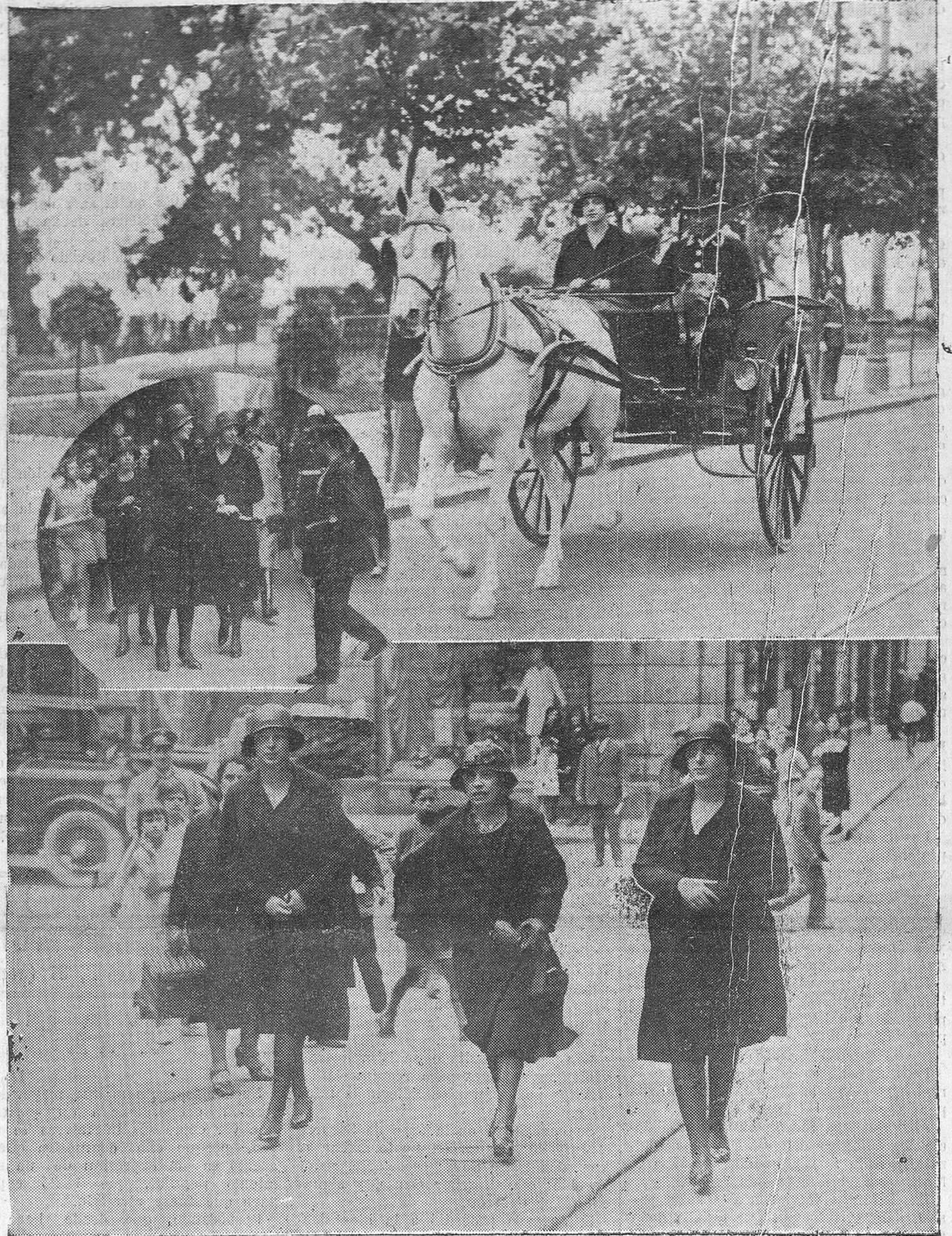
Las infantas doña Beatriz y doña Cristina, acompañadas de la señorita Carvajal, pasearon ayer por la población en el coche que guiaba doña Cristina. — A pie recorrieron las calles de la Blanca y San Francisco, encontrando en algunos comercios. — En el círculo, las infantas dando limosna a unos pobres ciegos.