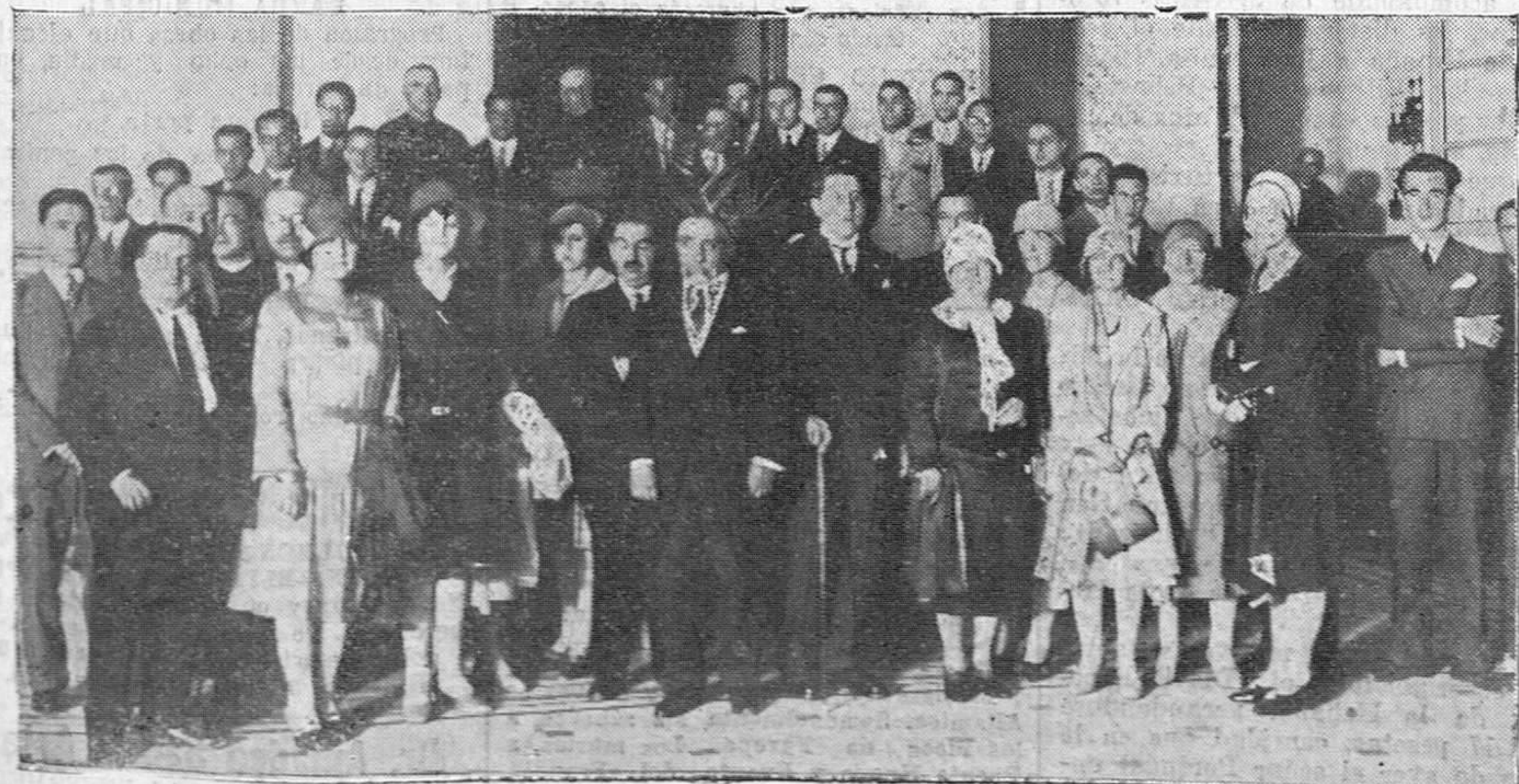
COLEGIO MAYOR UNIVERSITARIO. — Las autoridades e invitados que asistieron al acto inaugural.

Tres cuartos de hora permaneció la Reina en el pabellón, que vió de alto en bajo, recorriendo absolutamente to-