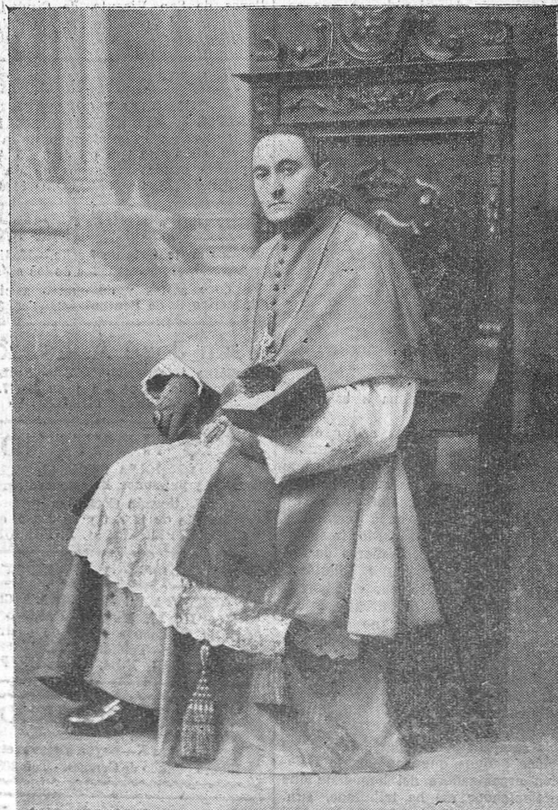
El ilustrísimo señor obispo de Curio, doctor don Manuel López Arana.