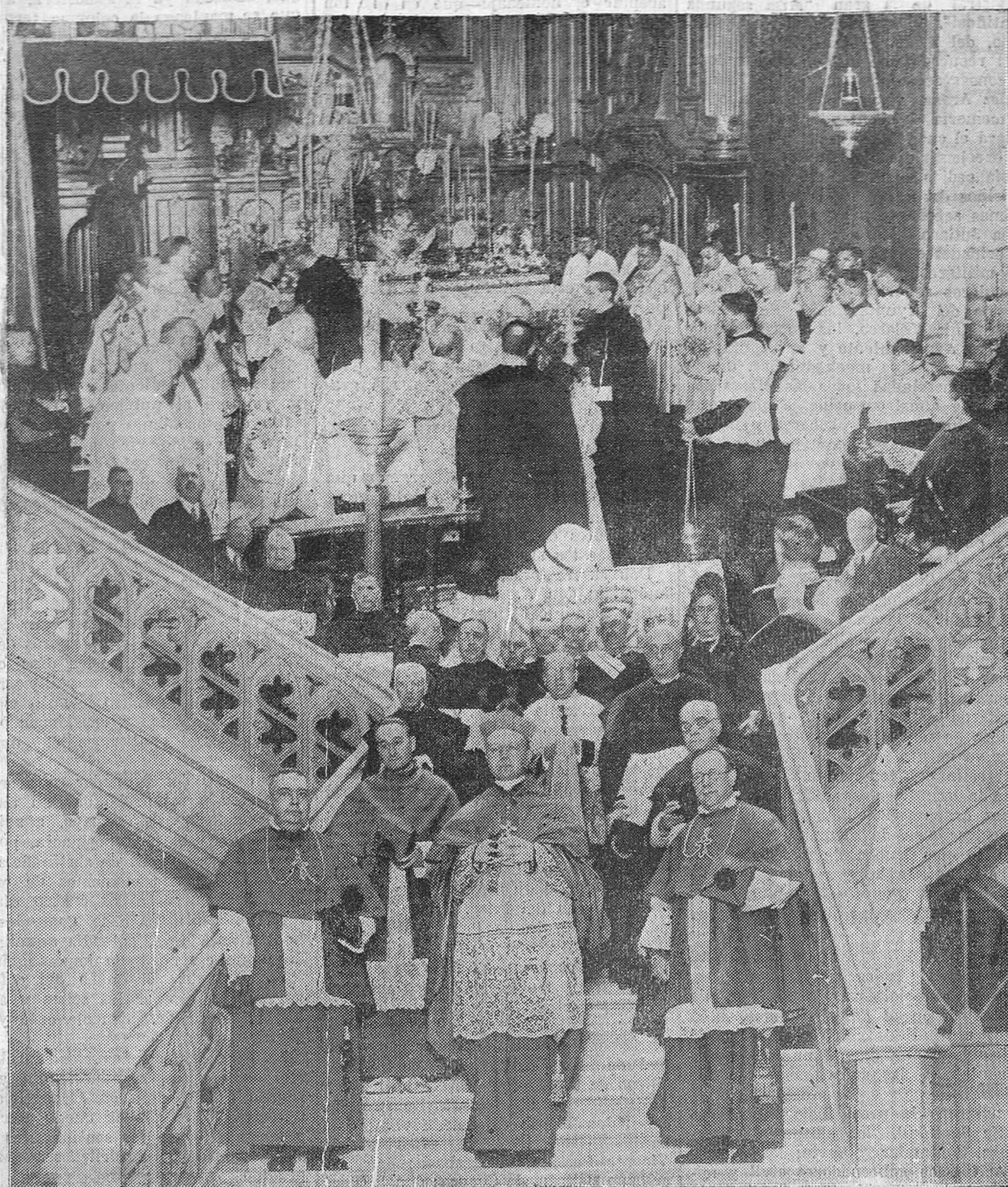
Solemne momento de ser consagrado, en la Iglesia Catedral, por el nuncio de Su Santidad, el nuevo obispo de Curio. — El nuncio, obispos de Salamanca, Santander y Curio, padrinos e invitados, saliendo del Palacio episcopal para dirigirse a la Catedral y comenzar la ceremonia.

DENTISTA PASEO MENENDEZ Y PELAYO, 30, 2.º