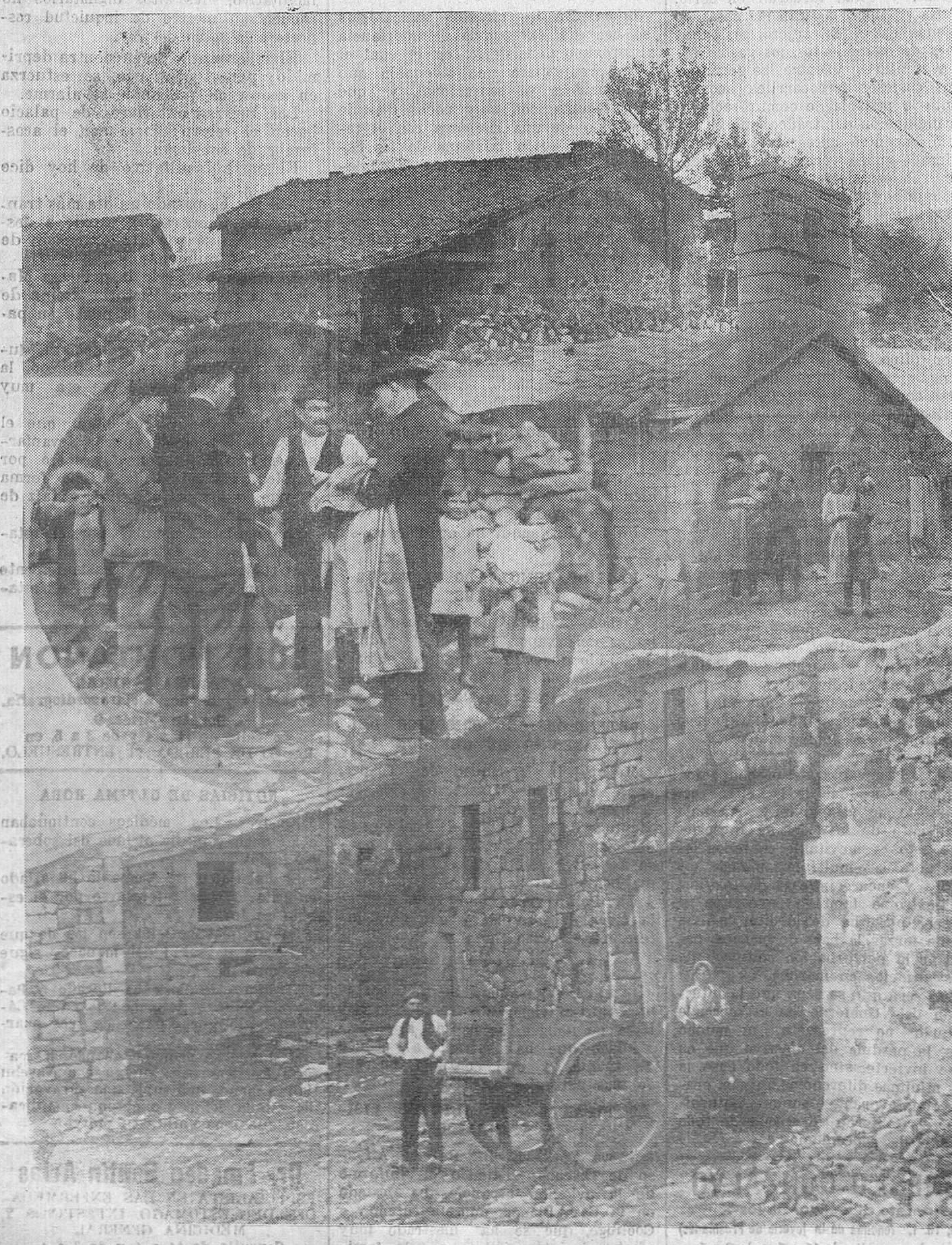
En los Riconchos, los vecinos de Laguillos nos cuentan su modo de vivir y nos obsequian con su negro pan de centeno y nos ofrecen de cuanto haya en su casa.