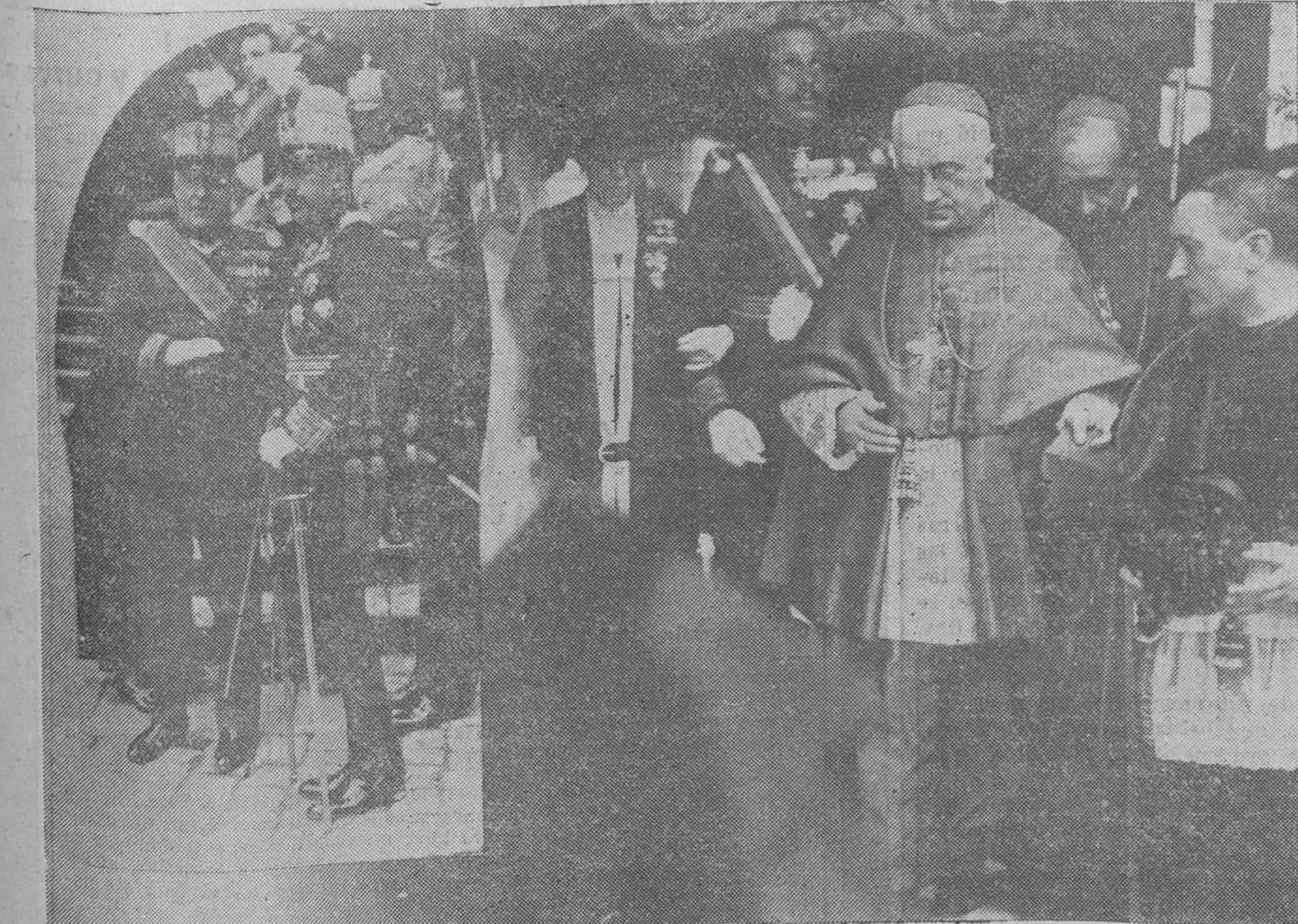
DEL SCLEMNE TE DEUM EN LA IGLESIA CATEDRAL.—El Rey, conversando con el general Primo de Rivera. El Monarca, dando el brazo a su augusta madre, abandona, saliendo bajo palio, el templo.