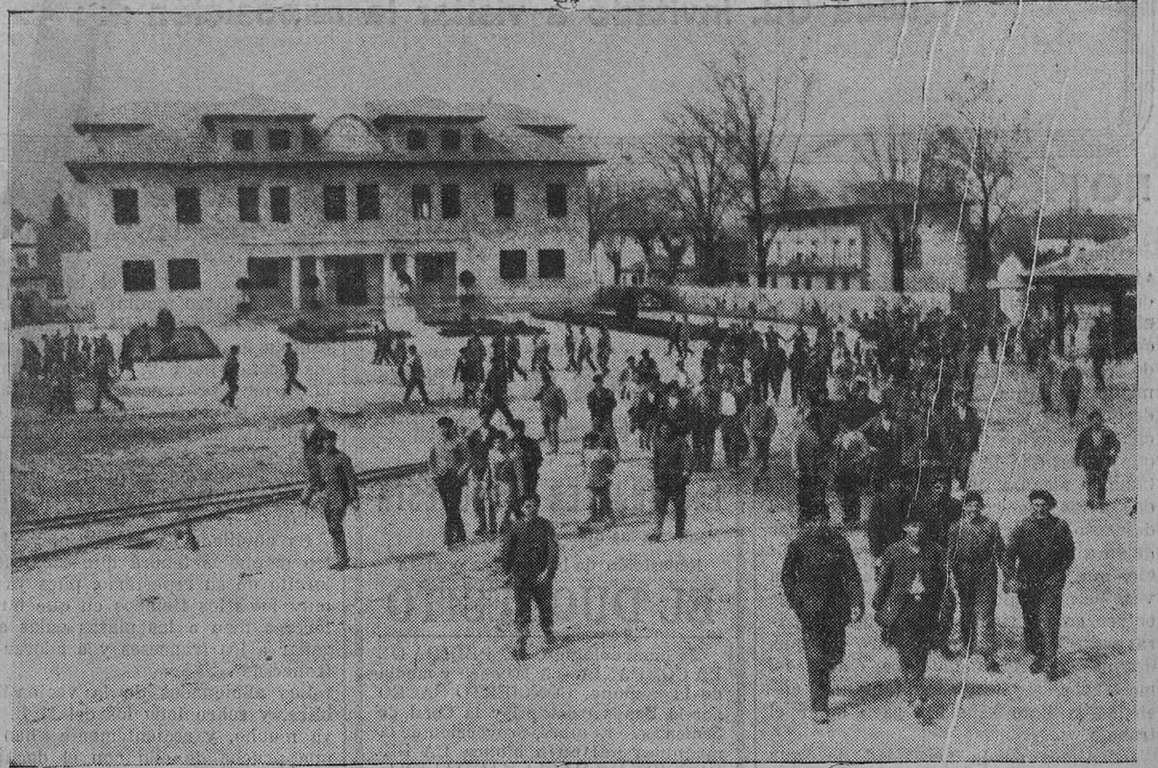
INDUSTRIAS MONTANESAS—Los obreros entrando al trabajo, en "Las Forjas", de Los Corrales de Urduliza

Del gran médico montañés, nacido en el año 1855, ha dicho en "El Imparcial", entre otras cosas, lo siguiente el doctor J. Alvarez Sierra: "Su momento cumbre fué el año 1907, cuando, después de haber tenido grandes aciertos de cirugía vascular y haber hecho operaciones delicadas en venas y arterias, concibió la idea de operar en pleno corazón si se presentaba ocasión para ello. Un día del mes de junio, época de exámenes universitarios, llegó a su enfermería un golfo a quien habían