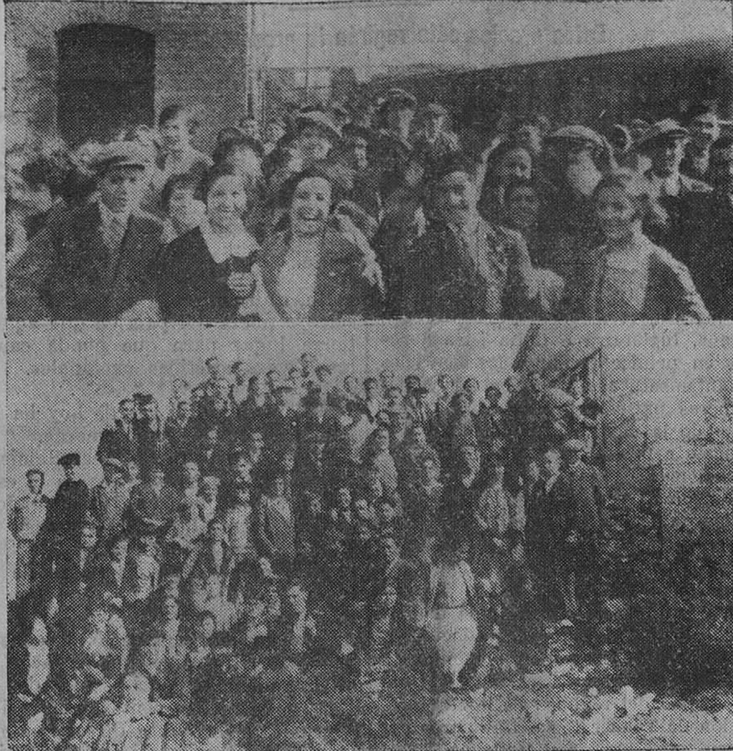
ATENELO POPULAR. Grupo de socios en la excursión que verificaron el domingo al alto de la Peña Cabarga.