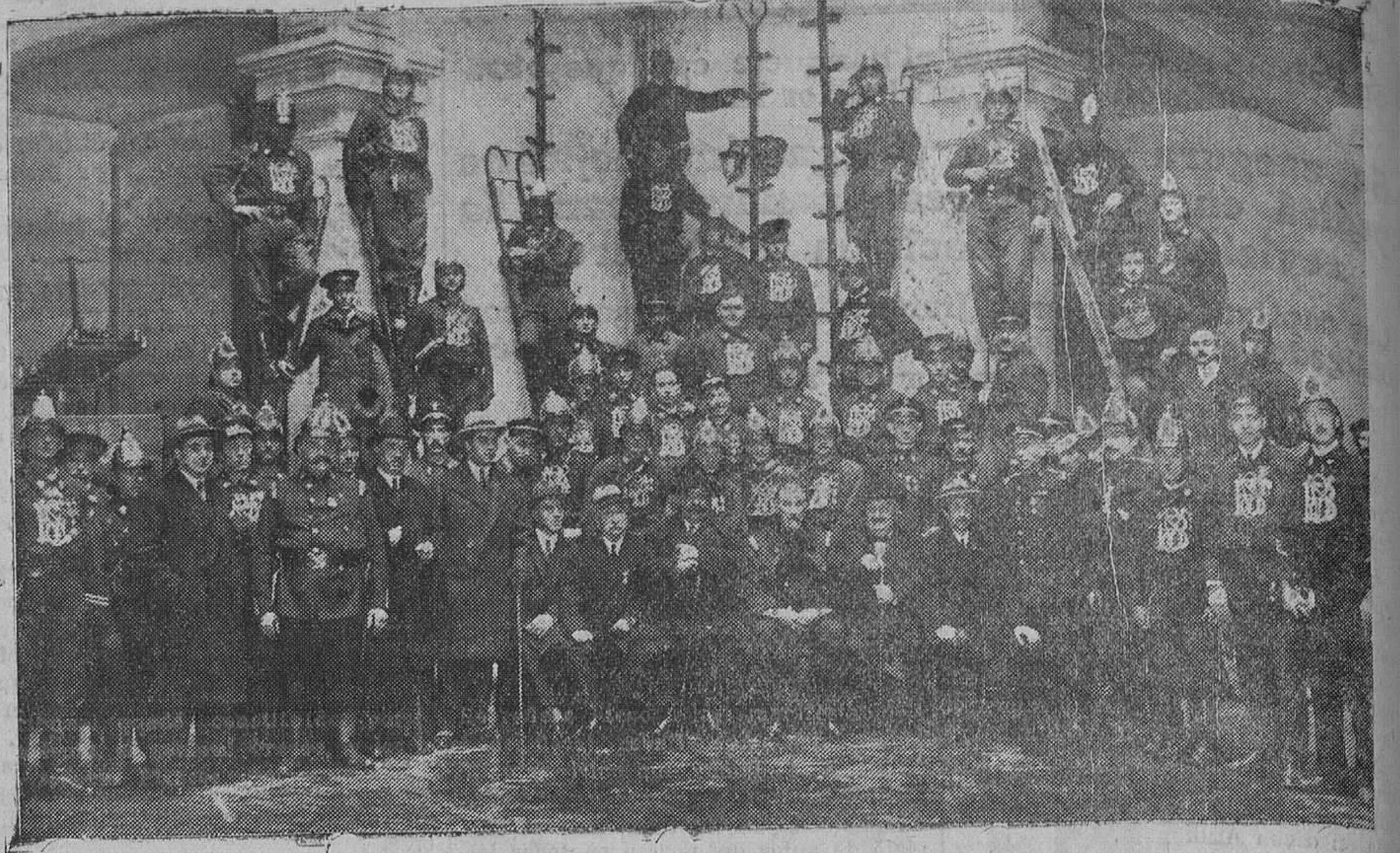
Los bomberos voluntarios, con los señores que forman el Consejo de Administración, y autoridades que asistieron al acto celebrado el domingo.