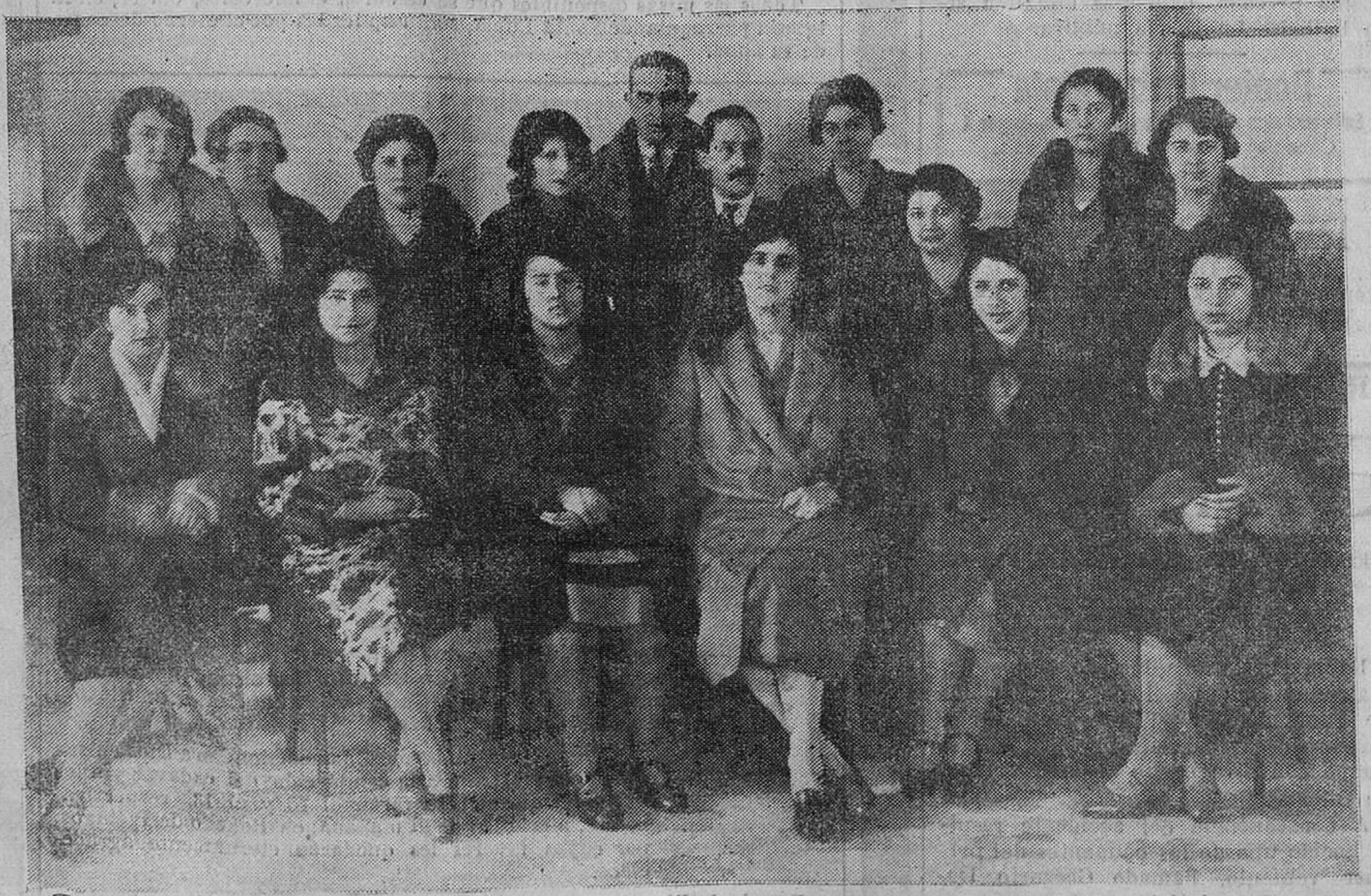
AYER, EN EL SALON REINA VICTORIA.—Grupo de bellas señoras, con el director y el solista de La Coral, que tomaron parte en la función a beneficio de los centros obreros de instrucción.