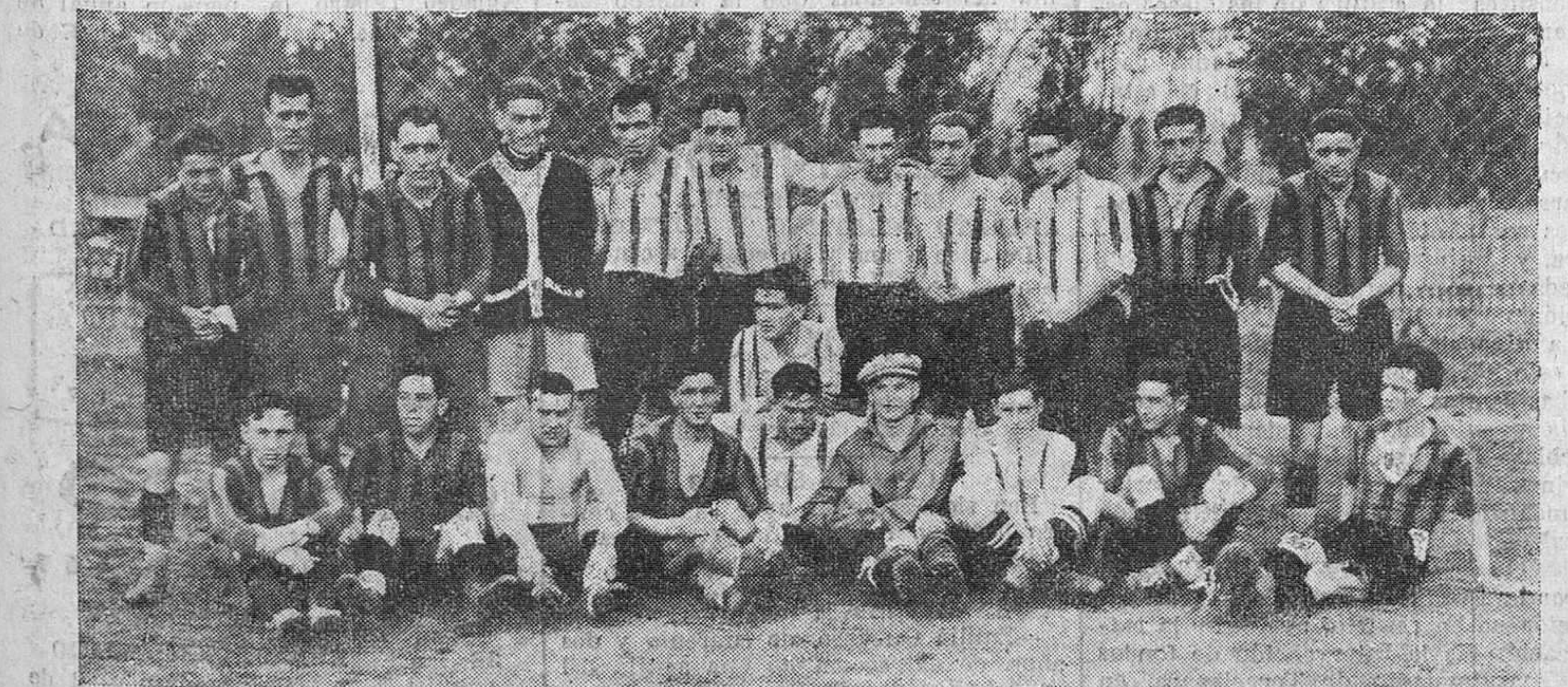
REINOSA.—Equipos de la Gimnástica, de Torrelavega, y Reinosa F. C., que jugaron un interesante partido ayer, tarde en los campos de San Francisco.

SARDINERO-SANTANDER Raquitismo, escrófula, linfatismo, tumores blancos ESPLÉNDIDA SITUACION - TODO CONFORT Las habitaciones preferentes tienen terraza independiente para la cura de aire y de sol. ABIERTO TODO EL AÑO Dirigirse á DON JESÚS MATA MÉDICO-DIRECTOR