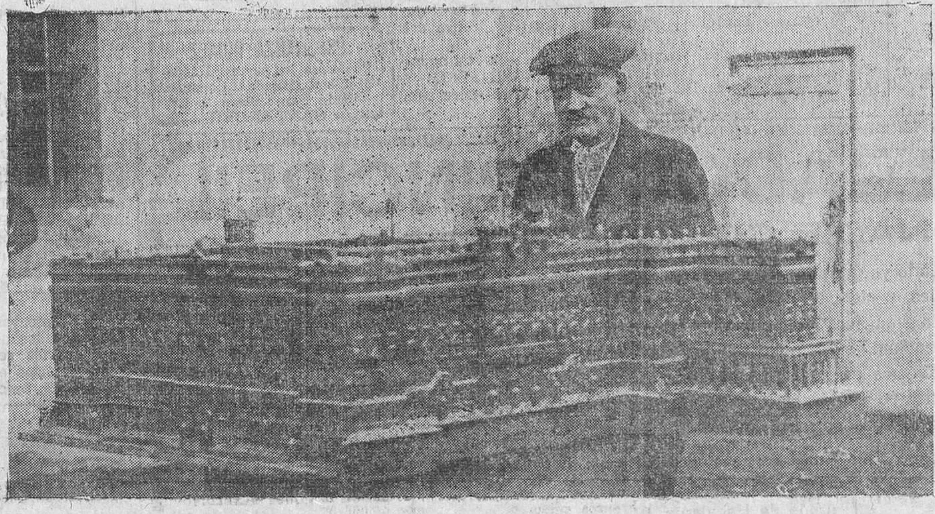
REINOSA.—Reproducción fidedigna del Palacio Real de Madrid, que se conserva en una tienda de Nestares, y su autor que tardó diez años en hacer este interesante trabajo con una navaja.

En la Sucursal (Hernán Corbés, número 6) se hacen exclusivamente: Préstamos hipotecarios y cuentas de crédito con garantía de fincas; ídem de valores, sin limitación de cantidad. Con garantía personal hasta 2.000 pesetas. En la Central (Tantín, número 1) se hacen préstamos de ropas, alhajas y las operaciones del Retiro obrero obligatorio. En la Caja de Ahorros, instalada en la Sucursal, se abona hasta mil pesetas mayor interés que las demás Cajas locales. Los intereses son abonados semestralmente: en julio y en enero. Horas de oficina: de NUEVE A UNA y por la tarde de TRES A CINCO.