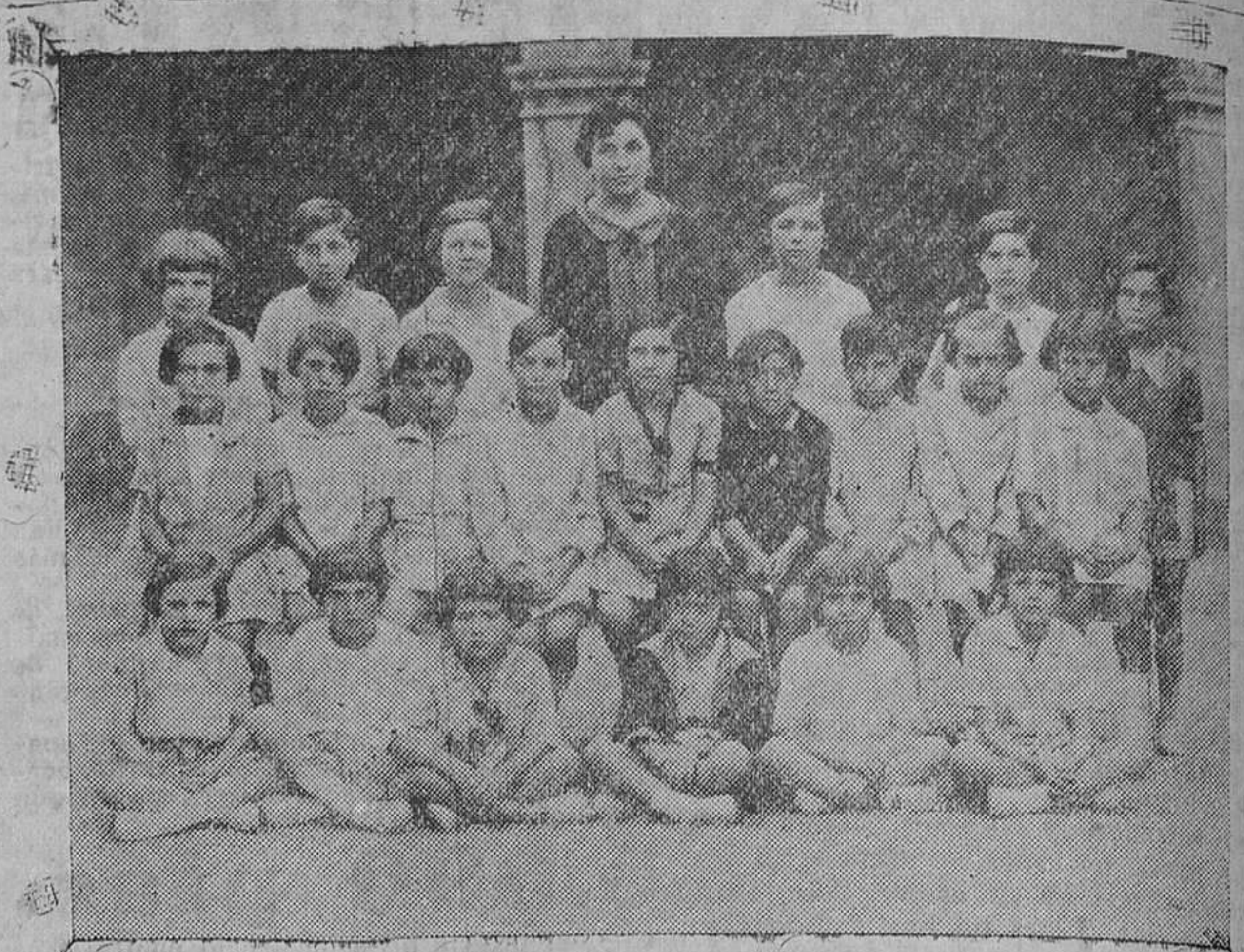
TORREAVEGA. -- Sexta excursión de los niños de las escuelas municipales a Suances.

El choque se debió a que palinó el auto, por causa del mal estado en que se halla dicha carretera con esa giba pronunciada, que está dando no pocos disgustos.