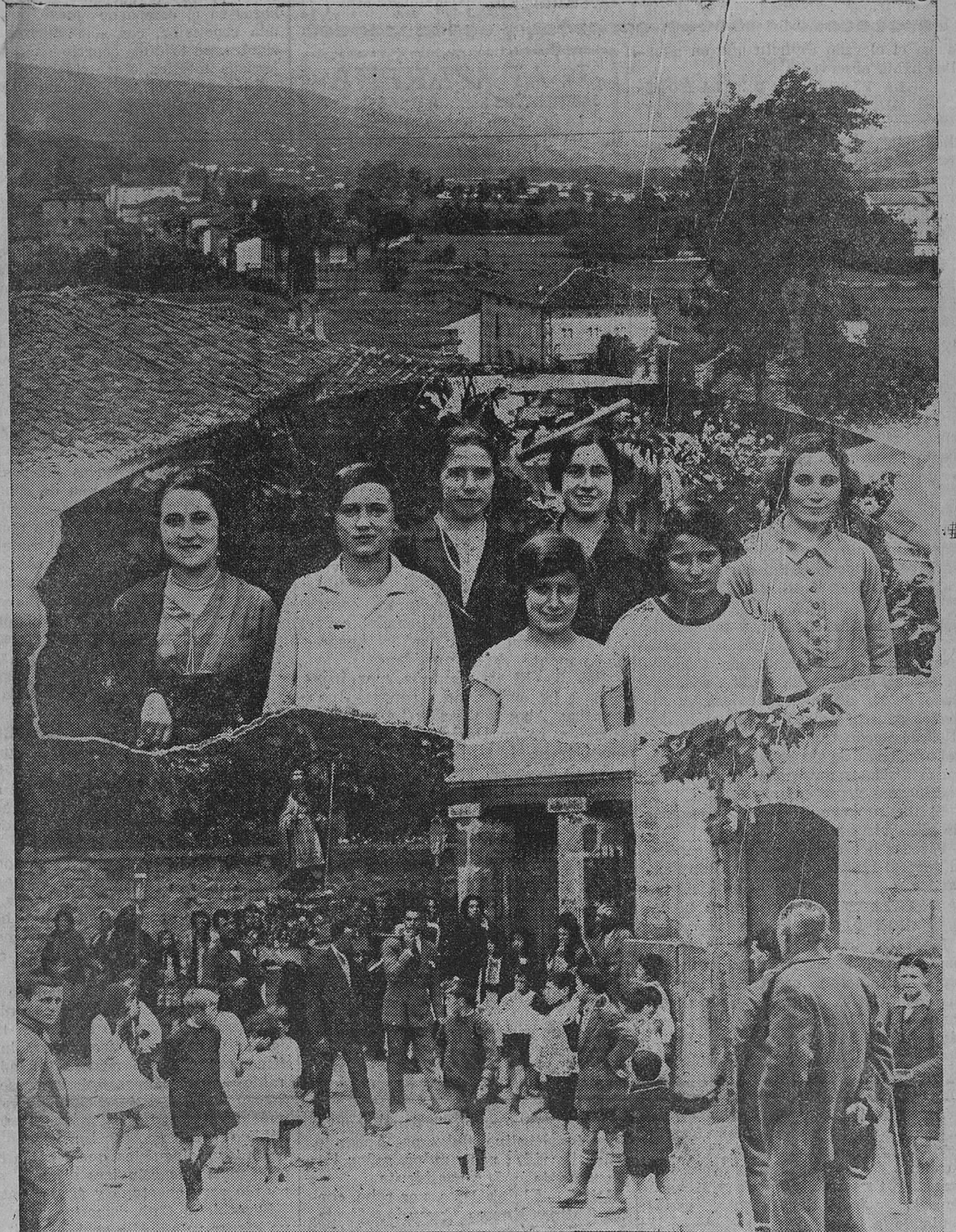
Brillantes por todos conceptos resultaron ayer los festejos organizados en el pintoresco pueblo de Alcaña con motivo de las fiestas de San Pedro, entre los que sobresalió la cabalgata, en la cual ocupaban la carroza las bellas torancesas que figuran en el centro de la fotografía.