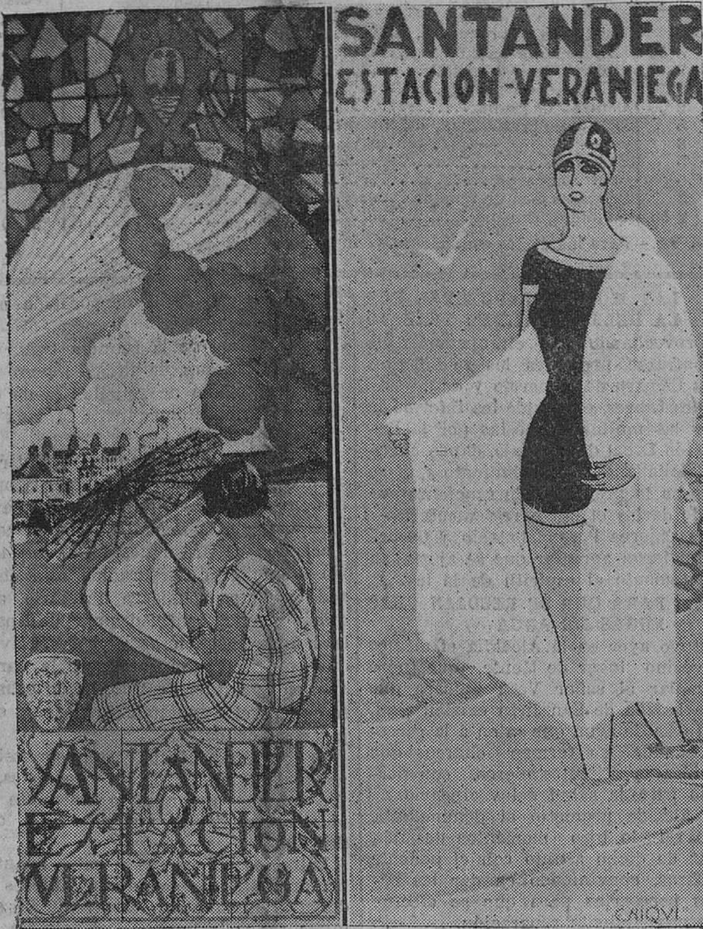
Los bocetos "Mar y nubes" y "Chiqui", premiados por la Comisión municipal de Festejos con el primero y el segundo premio, respectivamente, para el programa de esta estación veraniega, y de los que son autores Tino Uria Hazas y nuestro querido compañero Alfredo Felices. (Fotos Samot).