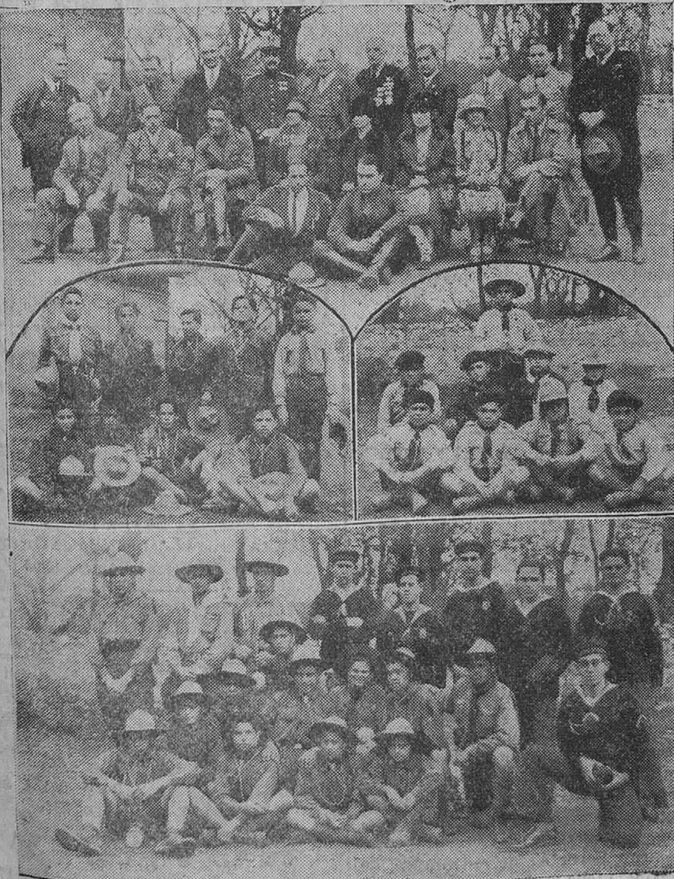
EL REPARTO DE PREMIOS A LOS EXPLORADORES.—Los señores que componen la Junta de Gobierno Alto Patronato, con la presidenta, madriñas y los jefes, durante el reparto de premios efectuado el domingo.—Los grupos de las secciones "Bisonte" y "Camello", que recibieron una copa, y los exploradores que lograron premios por su constancia, instrucción y buen comportamiento.