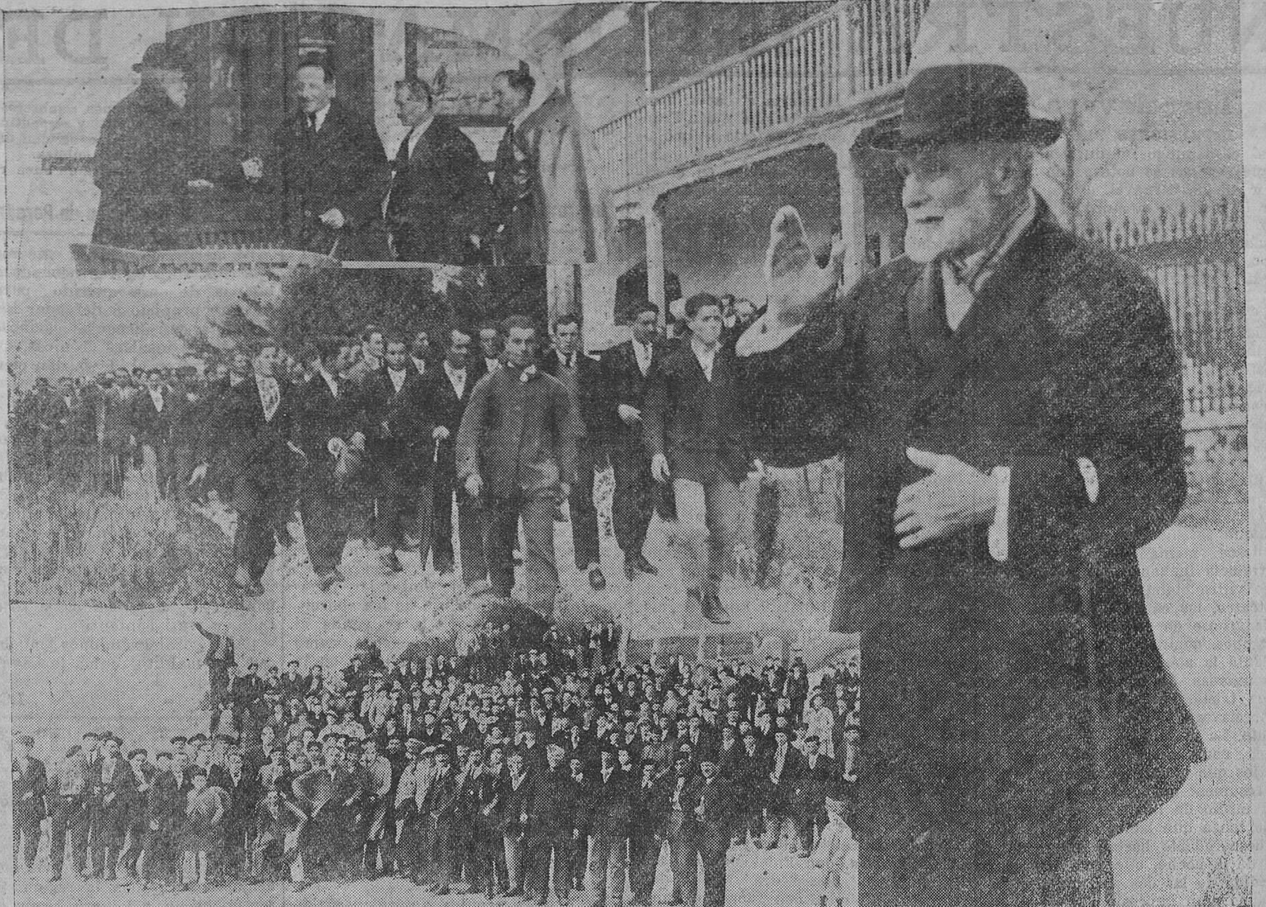
LOS OBREROS RINDEN UN HOMENAJE AL MARQUES DE VALDECILLA.—1. La Comisión obrera, saludando á don Ramón Pelayo.—2. La manifestación obrera, dirigiéndose á Valdecilla.—3. Grupo de obreros que trabajan en las obras del nuevo hospital, frente á "La Cabaña".—4. El excelentísimo señor marqués de Valdecilla, despidiendo á los trabajadores que le rindieron tan simpático homenaje.

Terminada la lectura, y hecho entrega del mensaje al excelso filántropo, los obreros todos prorrumpieron en estruendosos vivas y aclamaciones, des-