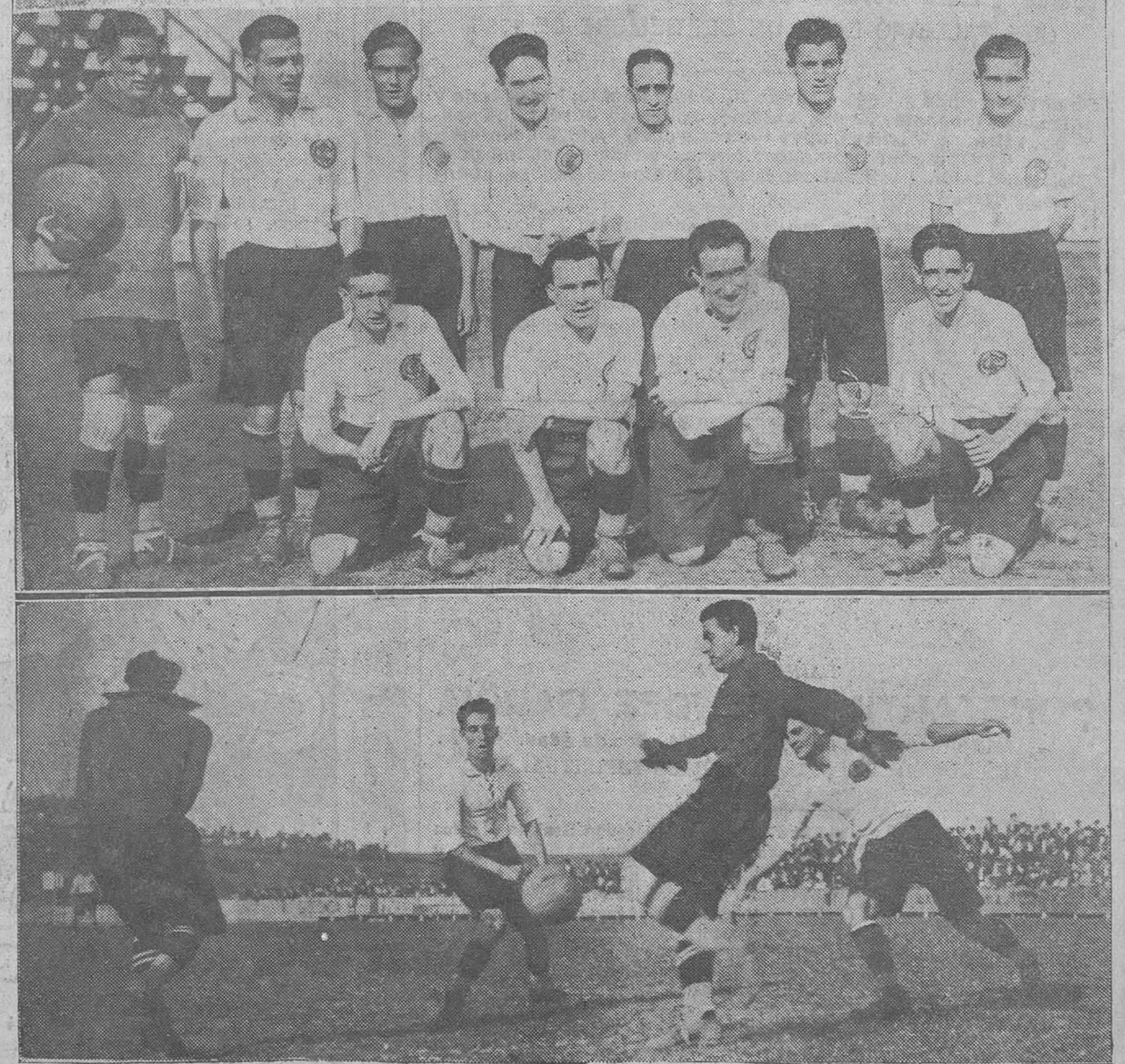
El equipo racinghista, que tan brillante actuación hizo el pasado domingo frente al Oviedo F. C., al que venció por tres tantos á uno.—El guardameta asturiano, despejando con el pie un avance combinado de Hernández y de Oscar.