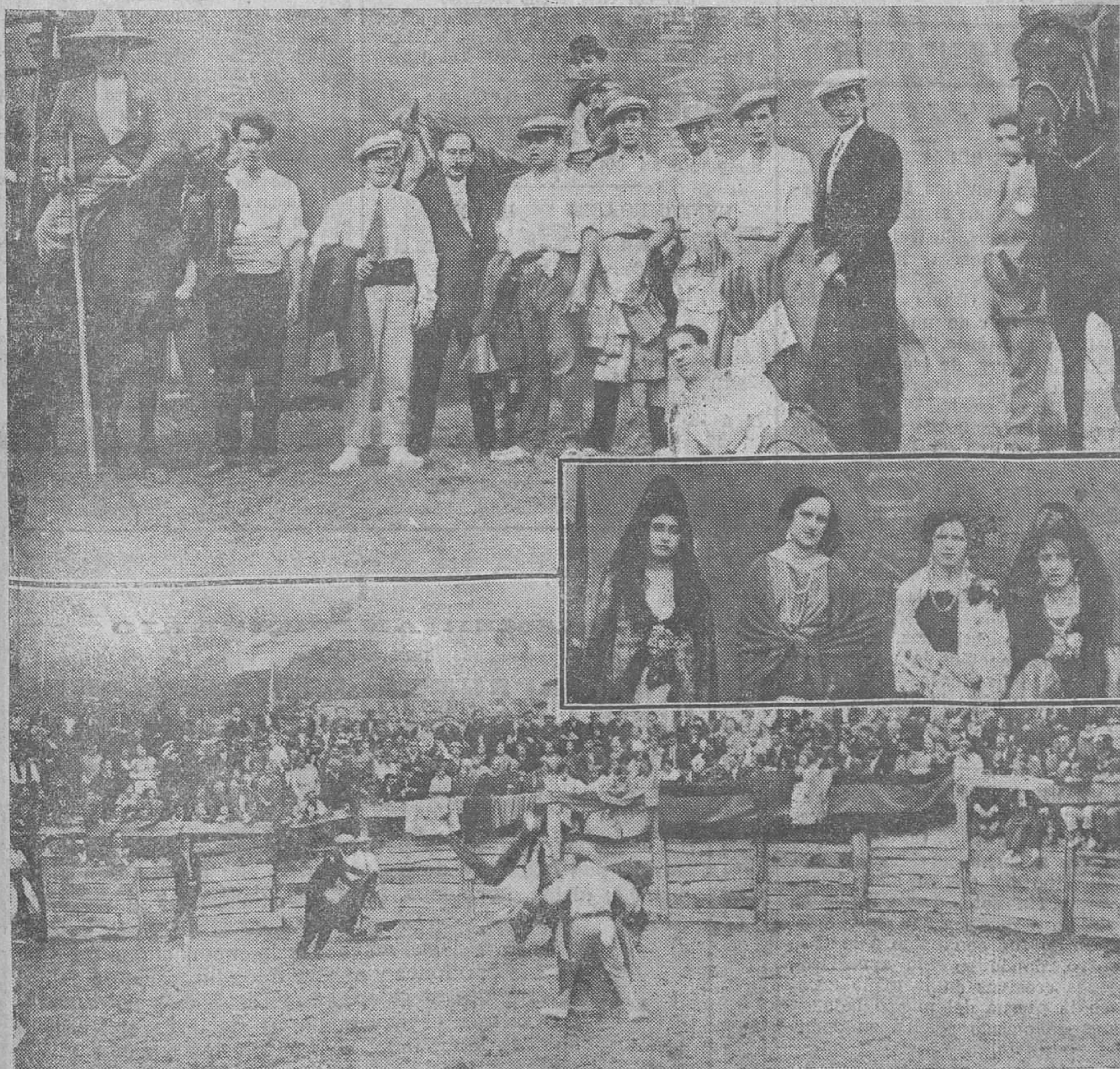
Notas gráficas de la becerrada del domingo en Ontaneda, y de la que, por exceso de original, nos vemos obligados á aplazar la información hasta mañana.

SARDINERO-SANTANDER Raquitis, escrófula, linfatismo, tumores blancos ESPLÉNDIDA SITUACION -+ TODO CONFORT Las habitaciones preferentes tienen terraza independiente para la cura de aire y de sol. ABIERTO TODO EL AÑO Dirigirse á DON JESÚS MATA MÉDICO-DIRECTOR