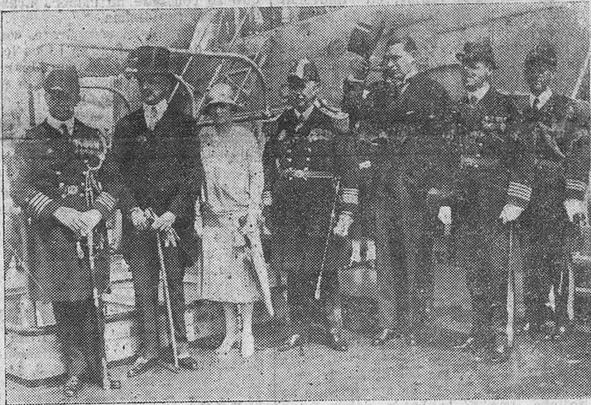
1. El embajador de los Estados Unidos, con el almirante y jefes del "Memphis", esperando a bordo la llegada de los Reyes de España.—2. Uno de los hidros del "Memphis", al ser lanzado, para volar sobre la bahía.