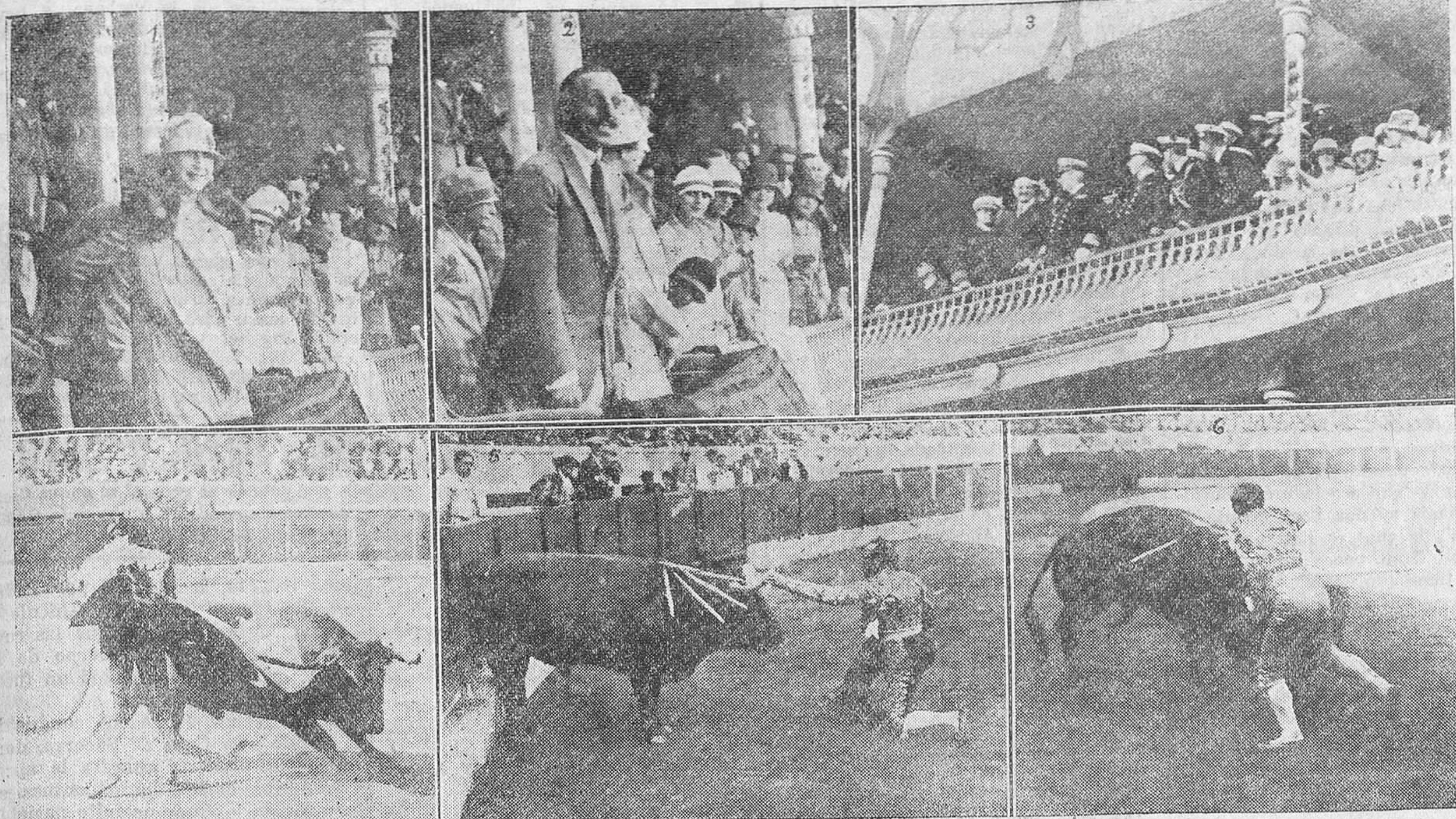
NOTAS GRAFICAS DE LA SEGUNDA CORRIDA DE FERIAS, QUE HONRARON CON SU ASISTENCIA LOS REYES Y EL PRINCIPE DE ASTURIAS. 1. La Reina doña Victoria, á quien ovacionó con gran entusiasmo el público al presentarse en el palco.—2. Don Alfonso saluda sonriente al público, que le aclama al aparecer en el palco presidencial con su augusta esposa y su primogénito.—3. El embajador de los Estados Unidos, el almirante Wells y oficiales del "Memphis", que asistieron á la corrida, siguiendo con marcadísimo interés las incidencias del varonil espectáculo genuinamente español, que muchos de ellos veían por primera vez.—4. Belmonte, en una de sus clásicas y famosas medias verónicas.—5. Muestran el torero pundonoroso y valiente por excelencia, que torrea á todos los toros sean como fueren y en los terrenos en que ellos quieran hacer la pelea, en un pase de rodillas y agarrando del pitón al toro para obligarle á tomar la muleta.—6. Fortuna, entrando á matar.

Dos aldeanos del propio Corcoete gozosos llegaron aquí antes de ayer. Los dos anhelaban ver á Juan Belmonte, y tras mil apuros lograron verlo. La bolsa aflojaron. Peseta á peseta cincuenta le dieron á un revendedor, y de los toriles allá en la meseta sufrieron valientes el fiero calor.