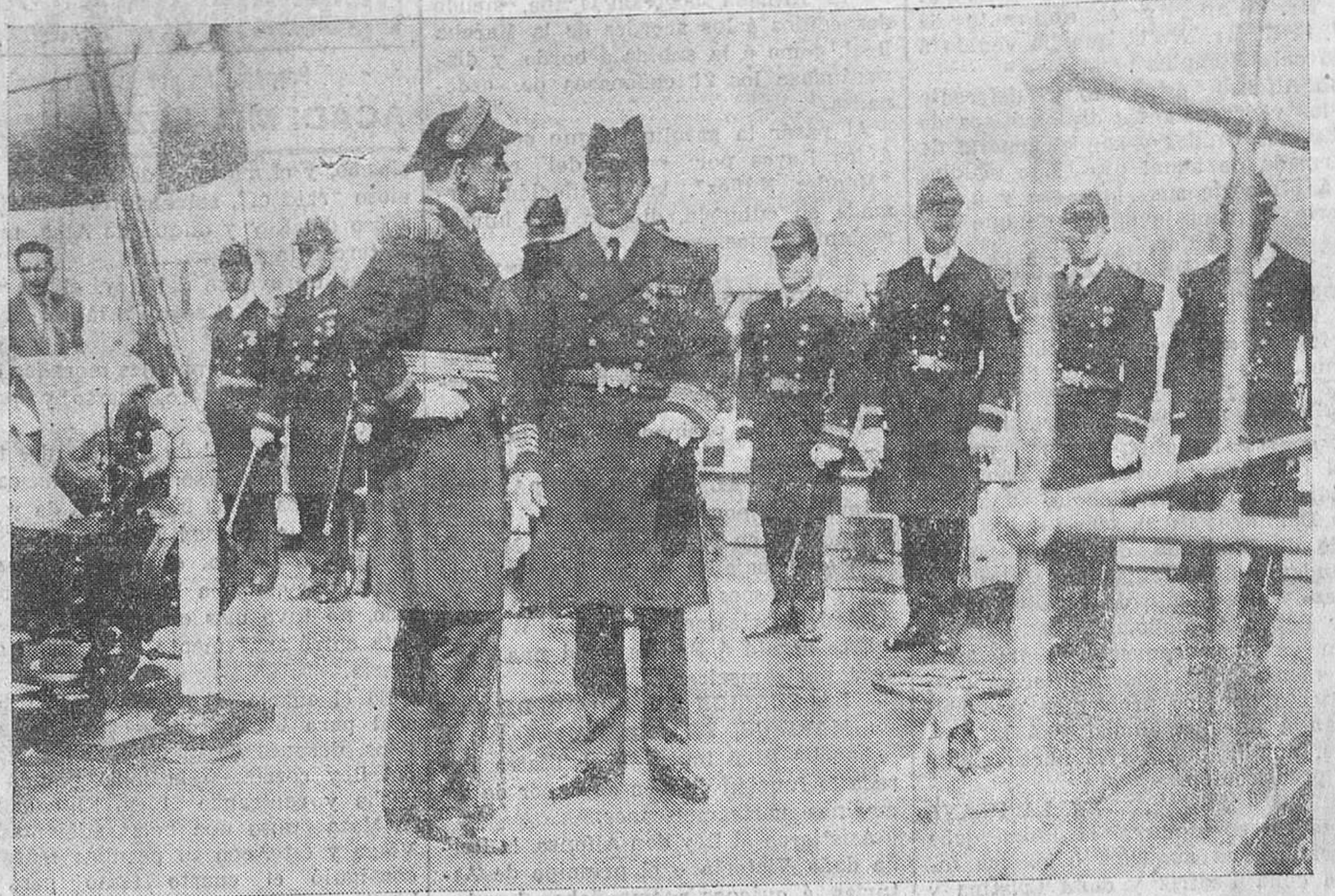
A BORDO DEL "MEMPHIS".—Su Majestad el Rey, hablando con el comandante del buque de guerra.

Crear que bajo un régimen de libertad ilimitada y controversia se contentarían los avances en su debido punto, es una quimera que sólo la pregonan los visionarios ó los insolentes, que de todo trastorno esperan ventaja.