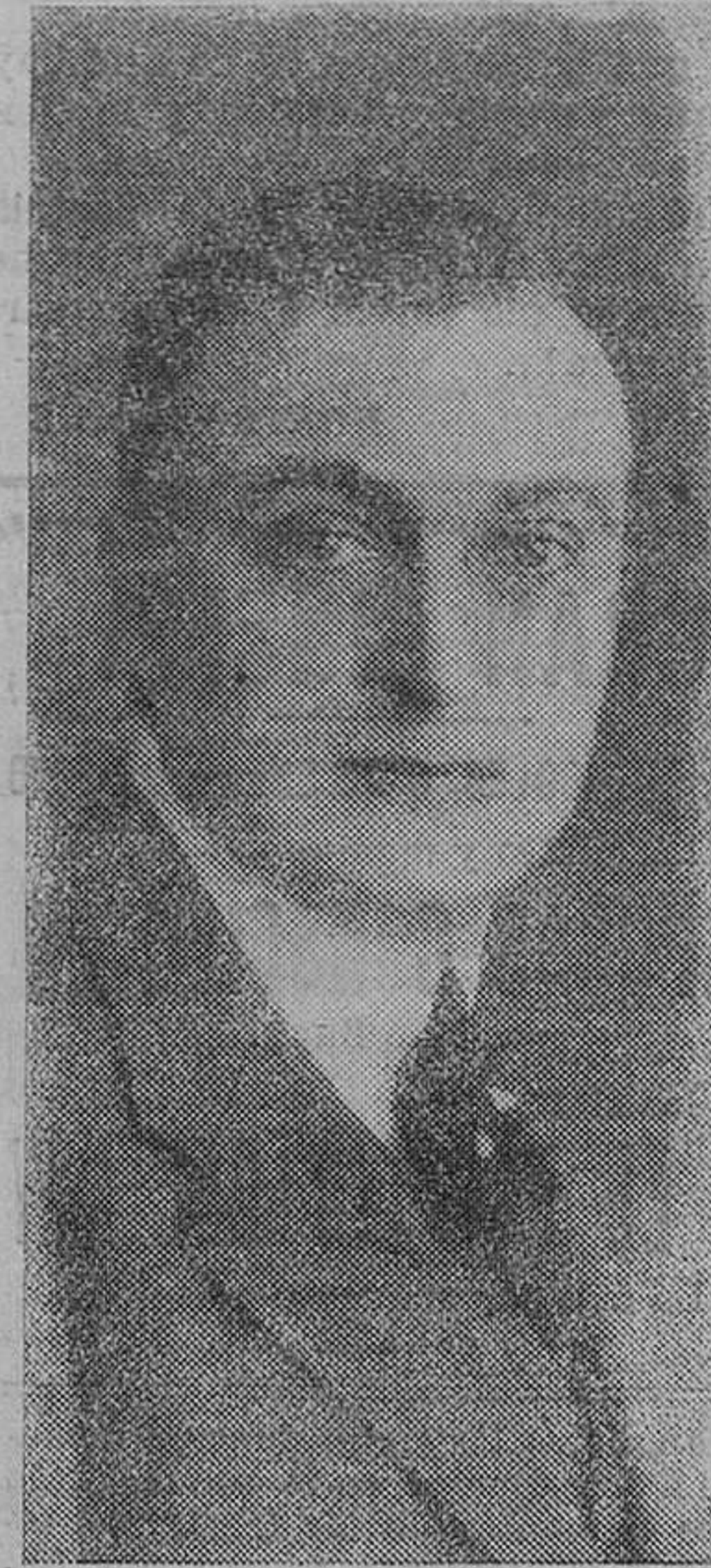
Pepe Buchs, relevante figura de la cinematografía española, en cuyo honor se celebra hoy un banquete por el éxito de la notable película "El Abuelo", que ha sido impresionada en muy pintorescos lugares de la Montaña bajo su dirección.

Muy señor mío y de mi consideración muy distinguida: Accediendo con el mayor gusto á su requerimiento, tengo la satisfacción de hacer constar que jamás, en ninguna de las ocasiones en que hemos tratado de la organización de festivales en el Teatro Pereda á beneficio de esa entidad, se me ha pedido que ninguno, absolutamente ninguno de los elementos artísticos que tomaran parte en la función, dejaran de percibir ó hi-