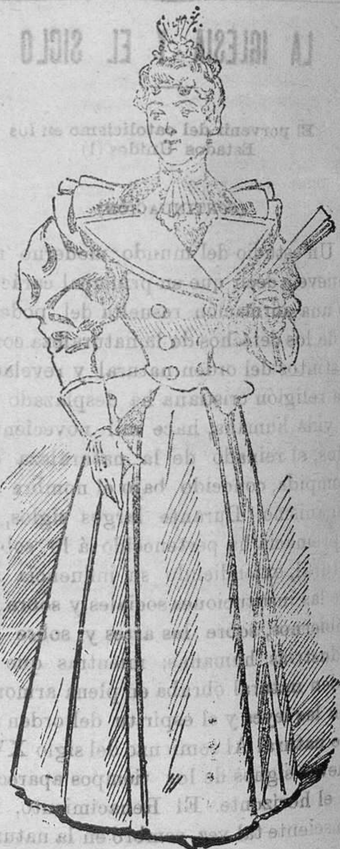
Traje para visita

A falda de fulard cruzado, se compone de varios paños; va ligeramente fruncida al talle y hallase en los bajos igualada en redondo. El cuerpo constituye una casaca abrochada en el delantero por doble hilera de botones y abierta en anchas solapas sobre un chalaco de surah. Un triple cuello esclavina da la vuelta a la espalda y cae haciendo hombrecillos sobre unas mangas capricho ajustadas a la muñeca por un respuntado puño mosquetero.