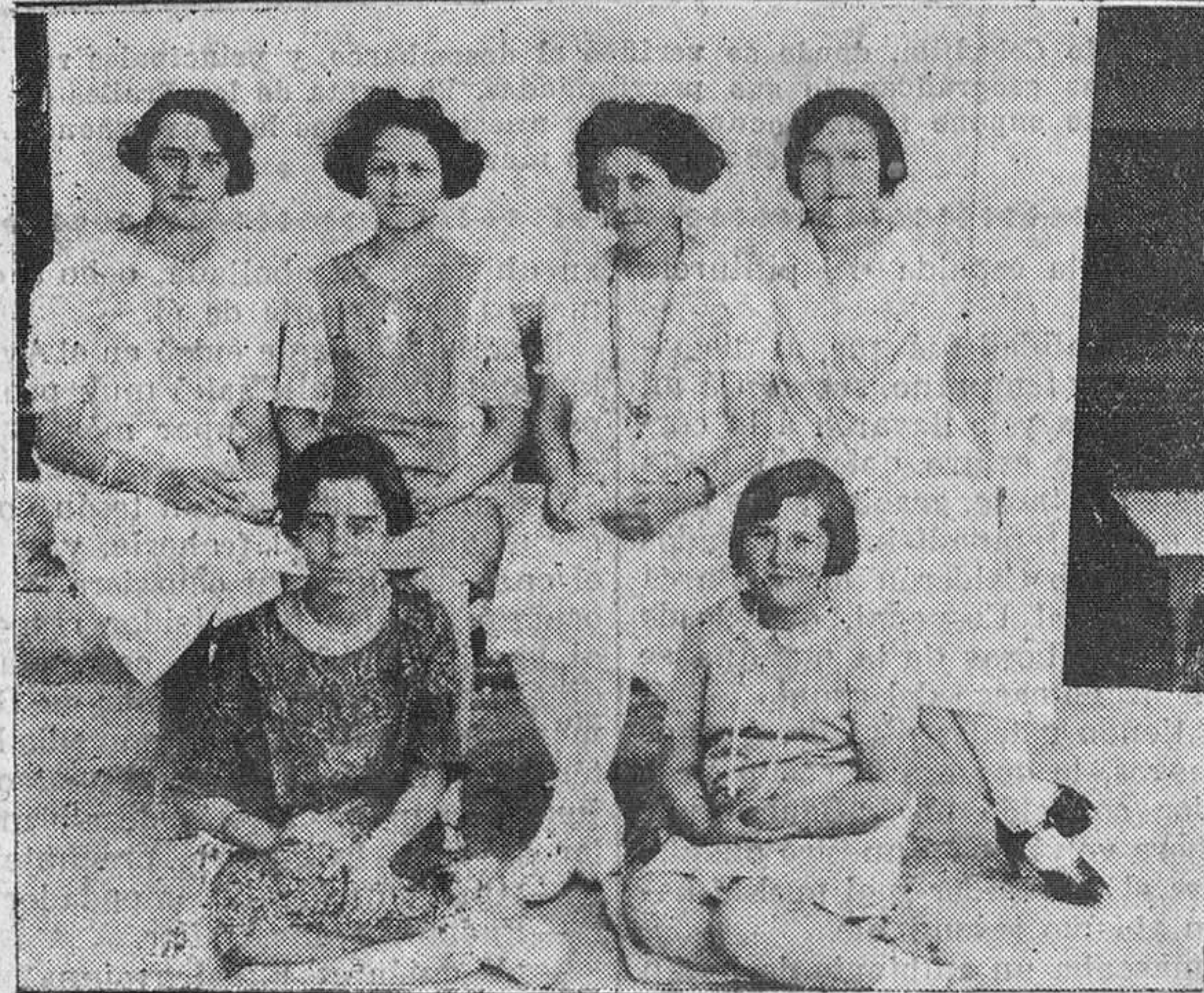
SAN VICENTE DE LA BARQUERA.—Grupos de aficionados que interpretaron las obras "Pueblo de las mujeres" y "La hija del mar", en la función pro-festejos de la Barquera.