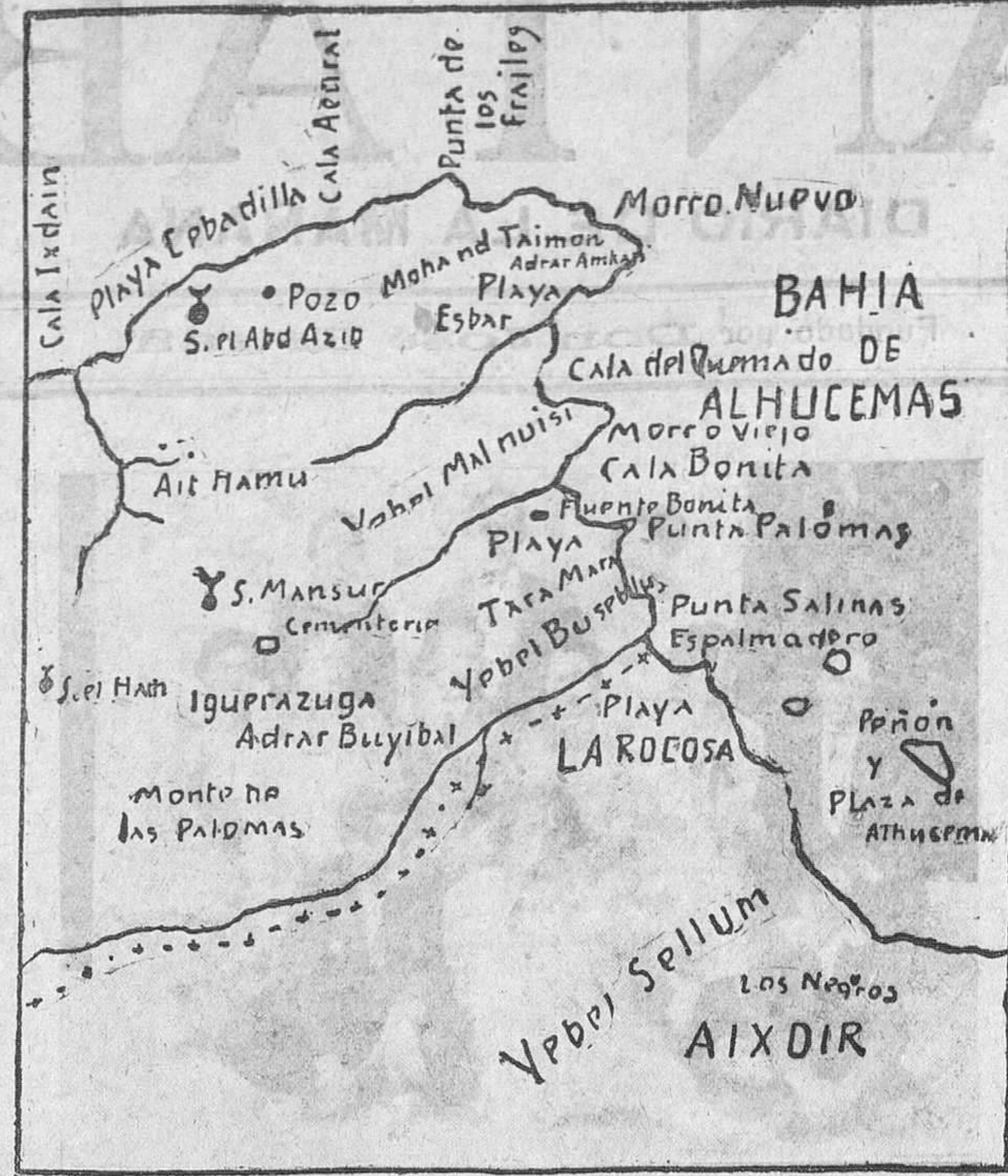
Playa de Cebadilla, donde se verificó el desembarco, y principales referencias geográficas de sus proximidades. En punta de los Frailes es donde se supone fueron ocupados por nuestras tropas los dos cañones cogidos á los moros.