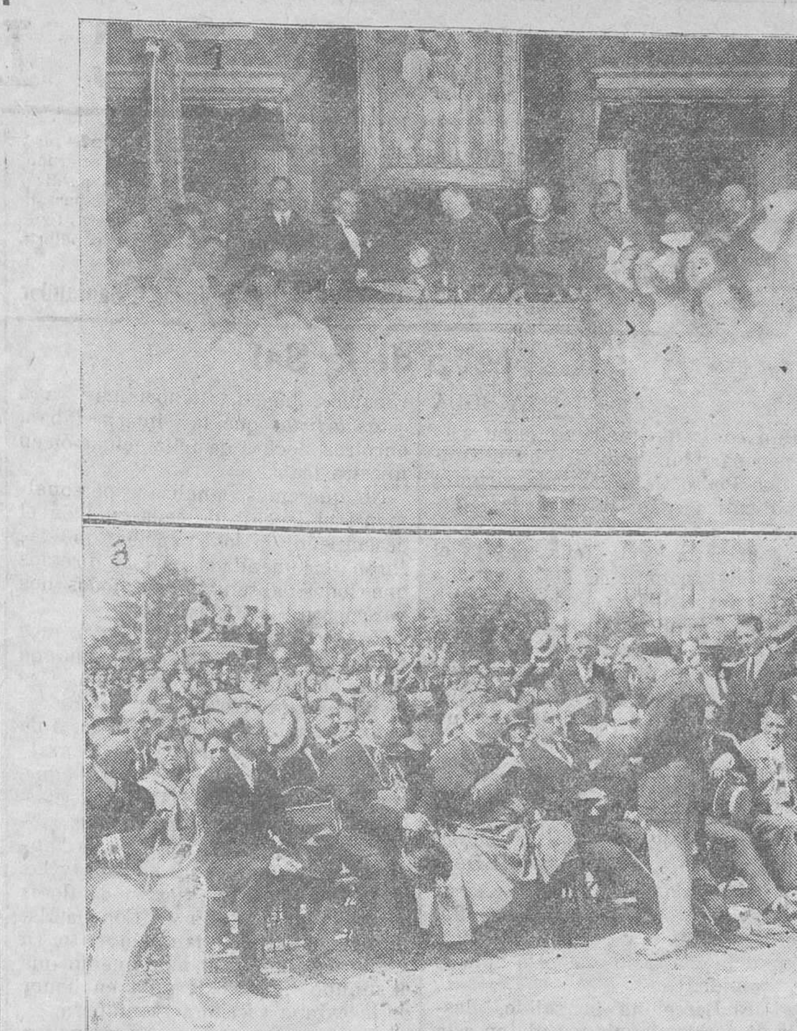
1. El alcalde de Santander, entregando al cardenal Benloch el título de socio honorario de La Coral.—2. El cardenal, colocando a Demetrio Ojeda la cruz de Beneficencia.—3. Las autoridades en el acto del descubrimiento de la lápida dando el nombre de José del Río al muelle de Puertochico.

Sindicato Tranviario (Sección de movimiento).—Se convoca a junta general extraordinaria para hoy, día 4, a las diez y media en primera convocatoria y a las veintuna y media en segunda. Se ruega a todos los socios la más puntual asistencia.