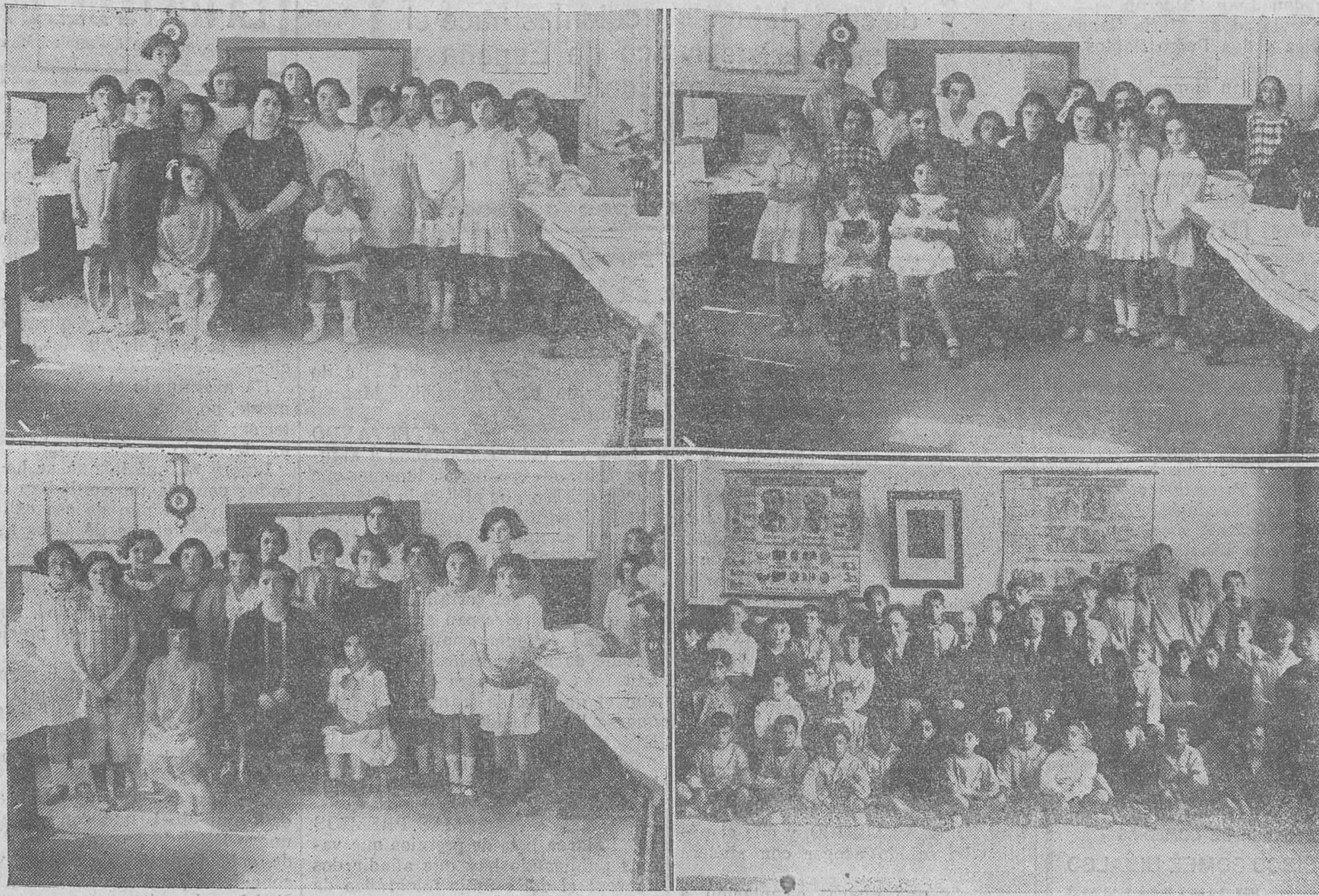
Las profesoras y profesores de las escuelas municipales graduadas, en las que se realiza una labor altamente educadora, acompañados de algunos alumnos cuyos meritos trabajos se exhiben al público en interesantes exposiciones.

No creemos que el citado sistema de someterse, en la organización y distribución de festejos, bien al alcalde o a una Junta única presidida por éste, pueda herir susceptibilidad alguna, ni lastimar el justo orgullo y la legítima vanidad de los hombres pródigos en iniciativas. Para ellos queda el honor de haberlas tenido, y pueden tener la viva satisfacción de su gesto abnegado al ceder a la representación de la ciudad todo lo que se refiera a fijar fechas y a disponer del festejo para colocarlo en el programa de fiestas el día que más convenga a los intereses estivales de la población. Todo lo demás es perturbar un poco ese noble sentido de unidad que debe presidir a toda empresa brillante y armónica.