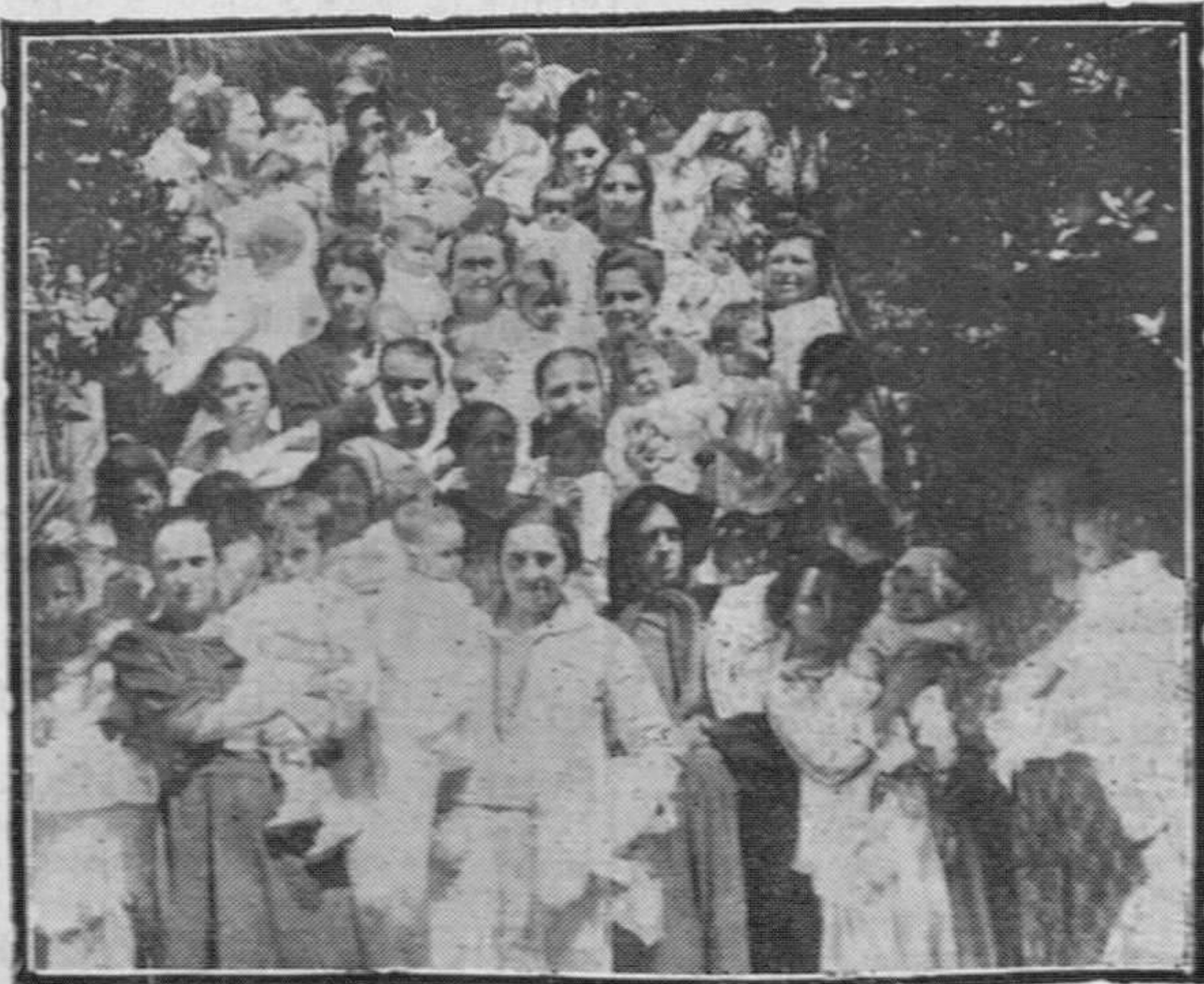
Grupo de madres, con sus hijos, favorecidas en el reparto de ropas hecho por Su Majestad la Reina en la Institución Reina Victoria.

L'UNION Compañía de Seguros contra el Robo y los Accidentes Subdirector: MARUCIO R. LASSO DE LA UEGA Oficinas: Arcillero, 4, entlo.—Teléf. 6-55