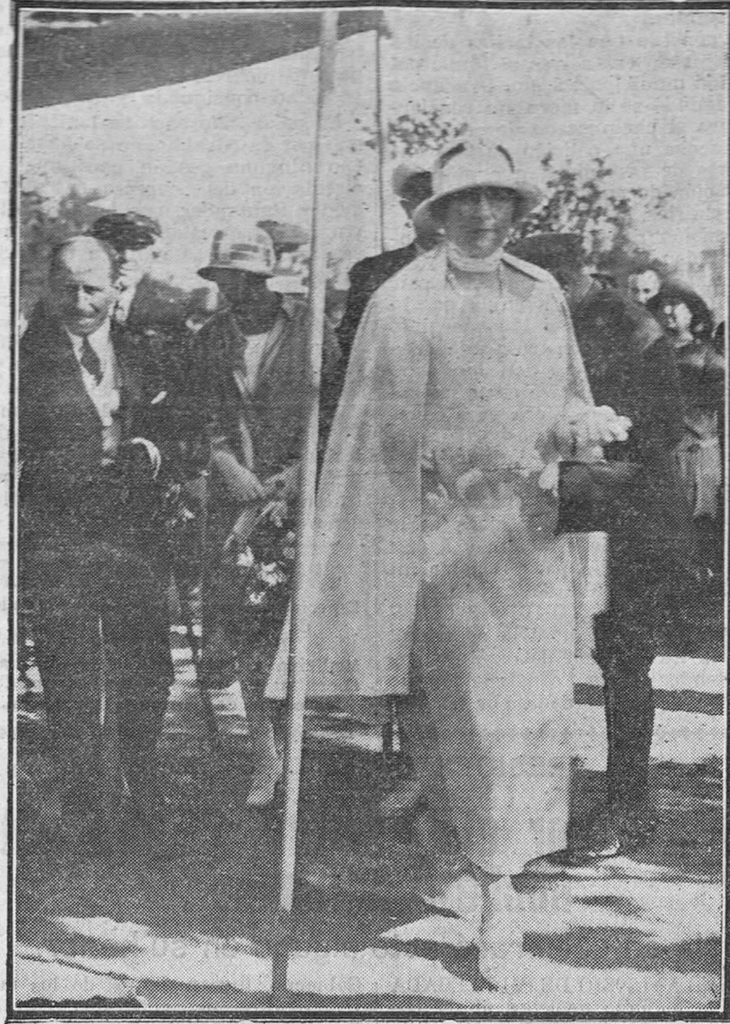
Su Majestad la Reina doña Victoria, en la fiesta benéfica de Piquío.

El gran fabricante americano ha dicho que entiende de aviones tanto como de automóviles y que los aviones se pueden construir por millares y hasta por millones.