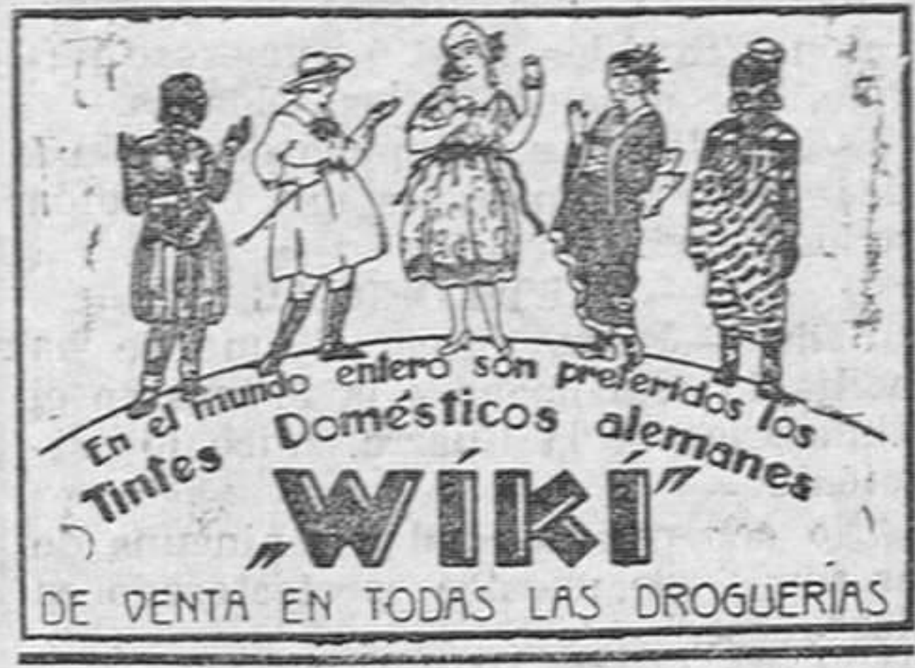
En el mundo entero son preferidos los tintos domésticos alemanes WIKI DE VENTA EN TODAS LAS DROGUERIAS

Nos comunican desde Ganzo que hallándose trabajando en las obras de la nueva escuela, á las once de la mañana de ayer, dos pintores, se rompió el andamio en que trabajaban, cayendo al suelo desde una altura de ocho metros, sin que, afortunadamente, tuviera el percance otras consecuencias para los obreros que el haber sufrido algunas contusiones de escasa importancia.