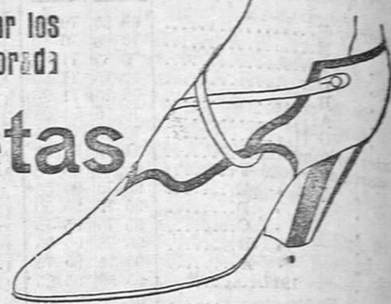
Zapato modelo salón, en lona blanca con adornos de charol negro ó becerro color, forro y plantillas piel, tacón alto ó medio, horma novedad.