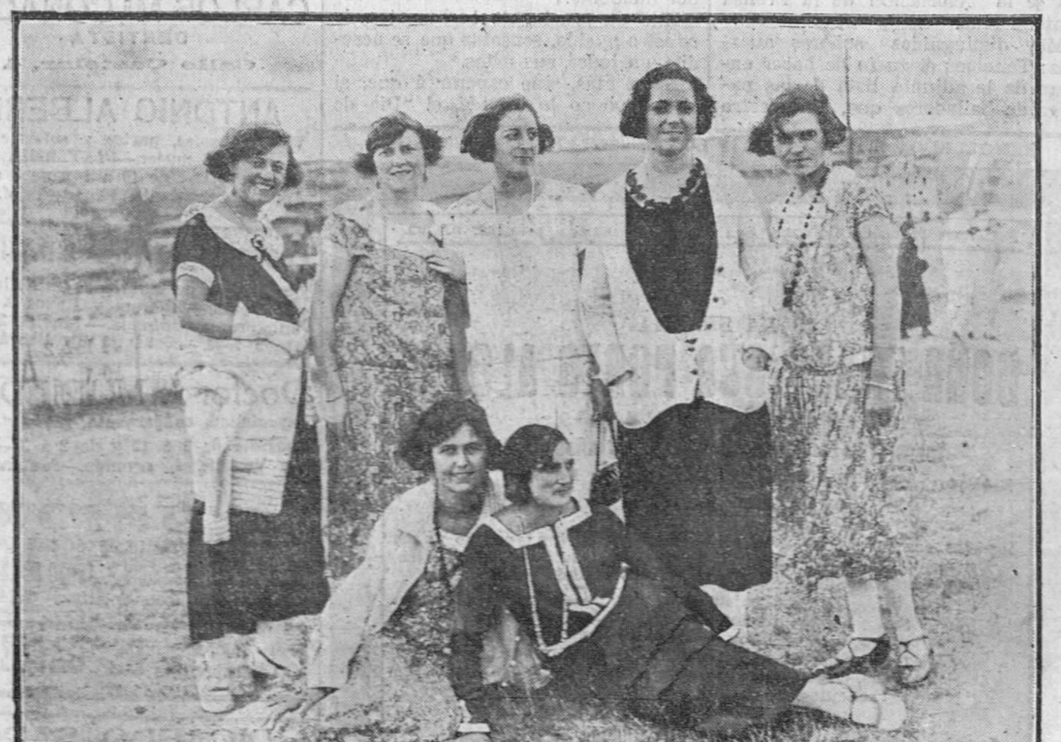
Grupo de bellas sanderinas en la romería de los Campos de Sport.