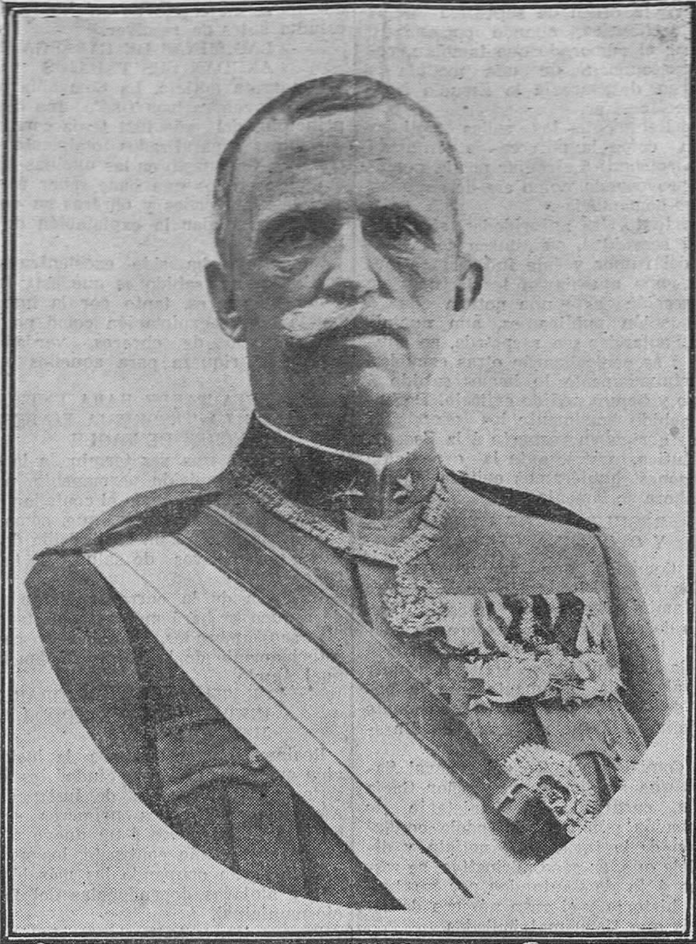
El Rey Victor Manuel III de Italia, que, acompañado de su augusta esposa, llegará hoy a España, en visita oficial a nuestros Soberanos.

Vías urinarias, partos y enfermedades de la mujer.—DIATERMIA CONSULTA: de 10 a 1 y de 3 a 5. Años de Escalante, 10, 1.—Teléf. 8-74