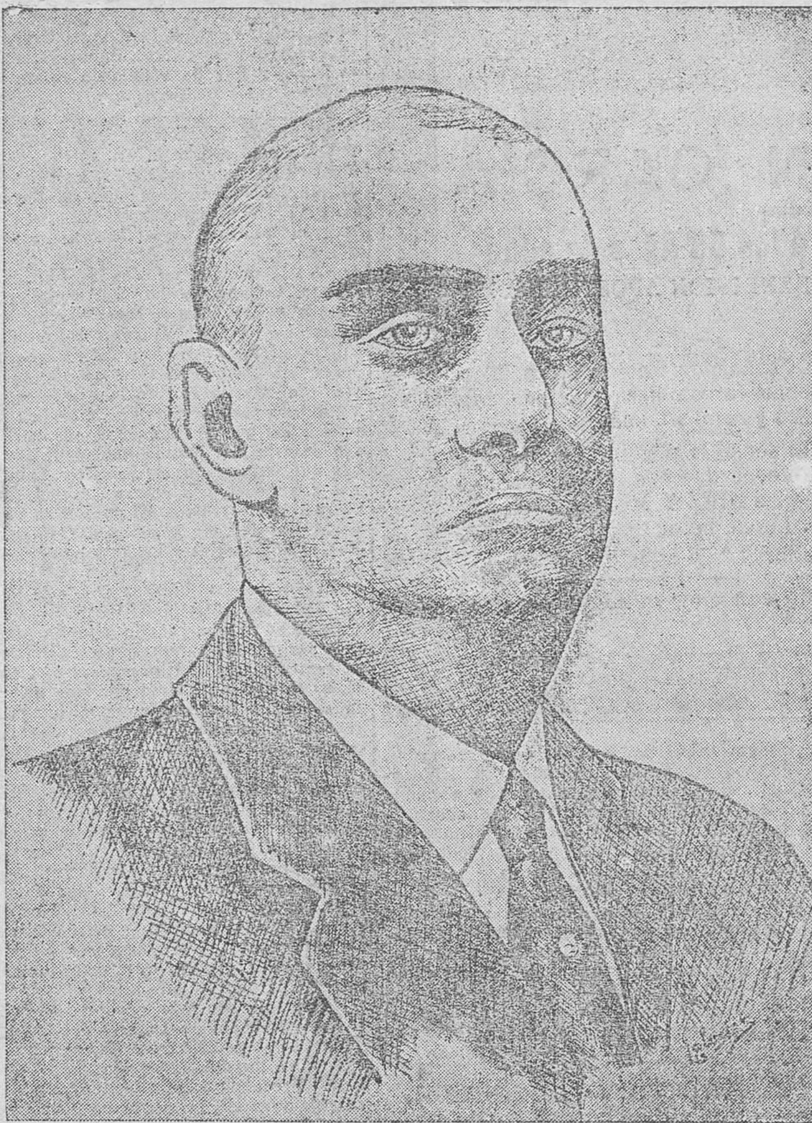
El Presidente de la República Argentina, Marcelo T. de Alvear.