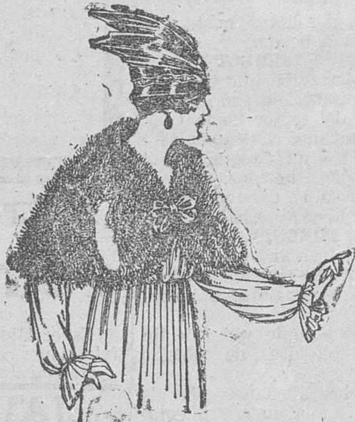
Capellinas de marabú adorna las, con cinta y forro de seda, de ptas. 32 á 40.