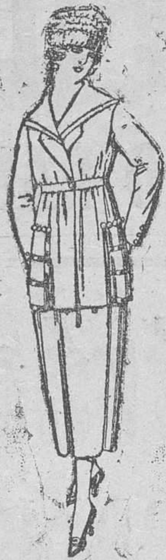
Trajes de sarga inglesa, lanilla, etc., en negro, azul y color, de pesetas 110 á 135.