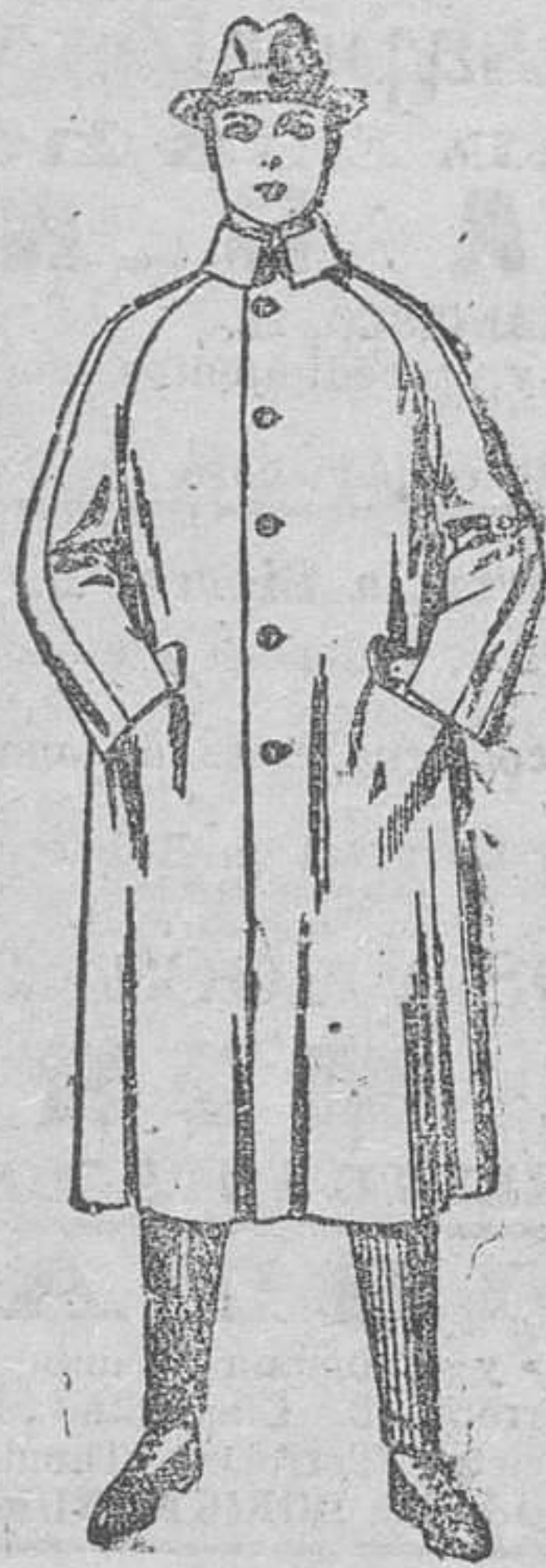
Gabanes de patén, chevrot ó cover, de pesetas 70 á 150.