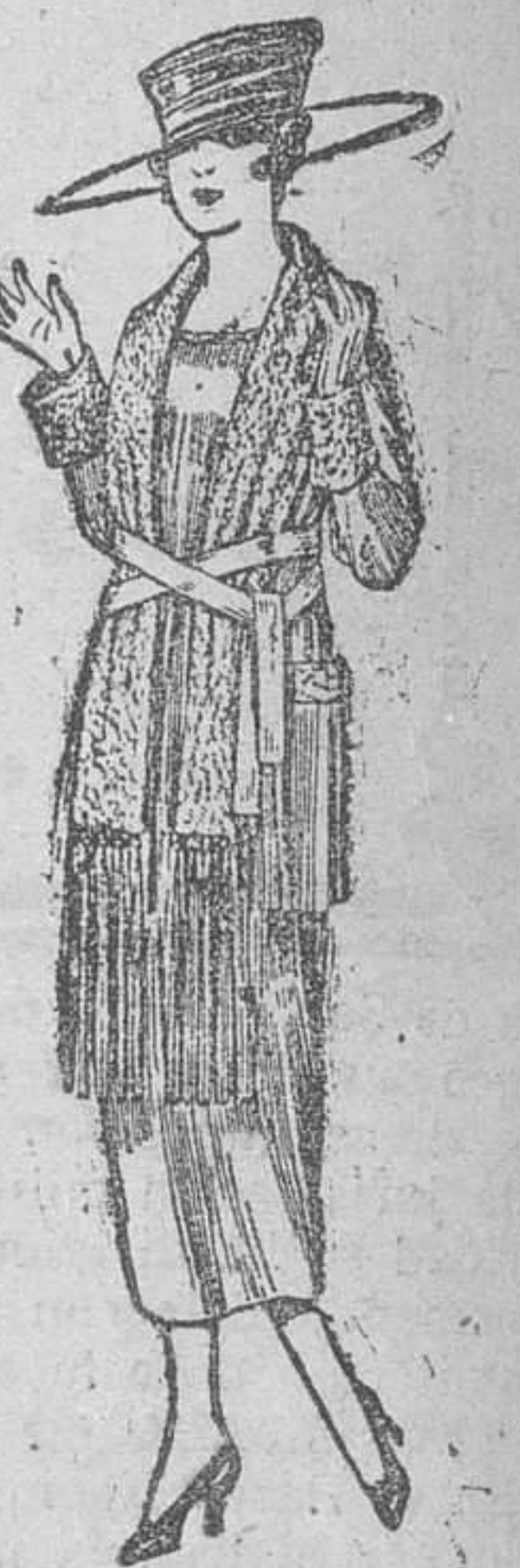
Paletos de punto de lana, cuello bufanda, de ptas. 50 á 55.

Camisería, Géneros de punto, Corbatería, Guantería, Sombrerería, Zapatería, Paraguas, Bastones y Artículos de Viaje.