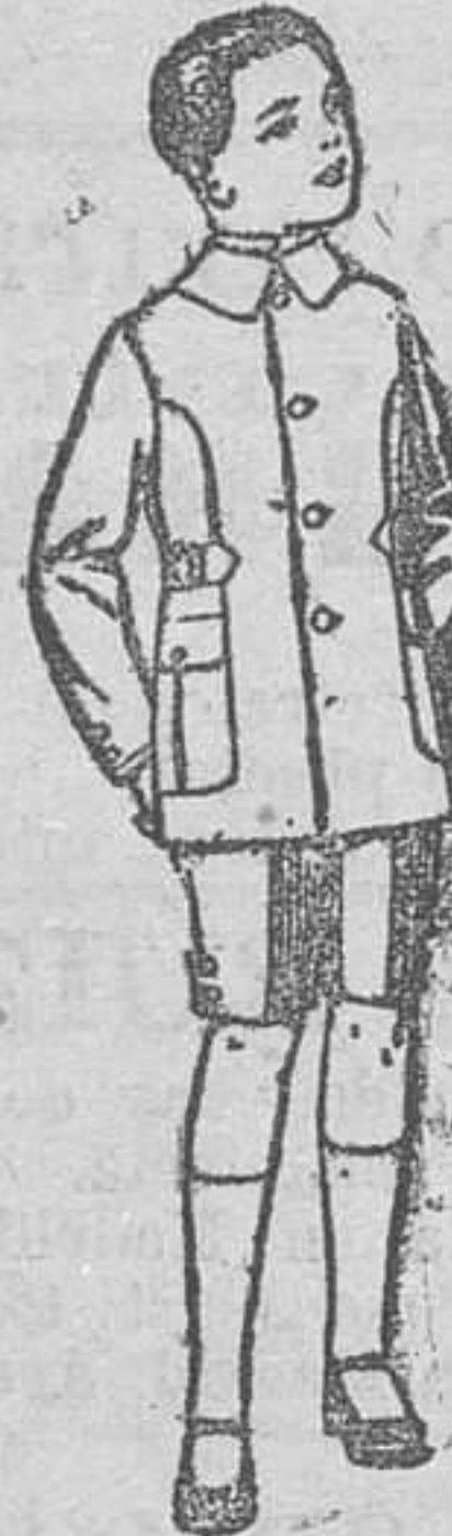
Trajes modelo Sport, de lanilla, estambre, melton, etcétera, para niños de 4 á 9 años, de pesetas 25 á 45.