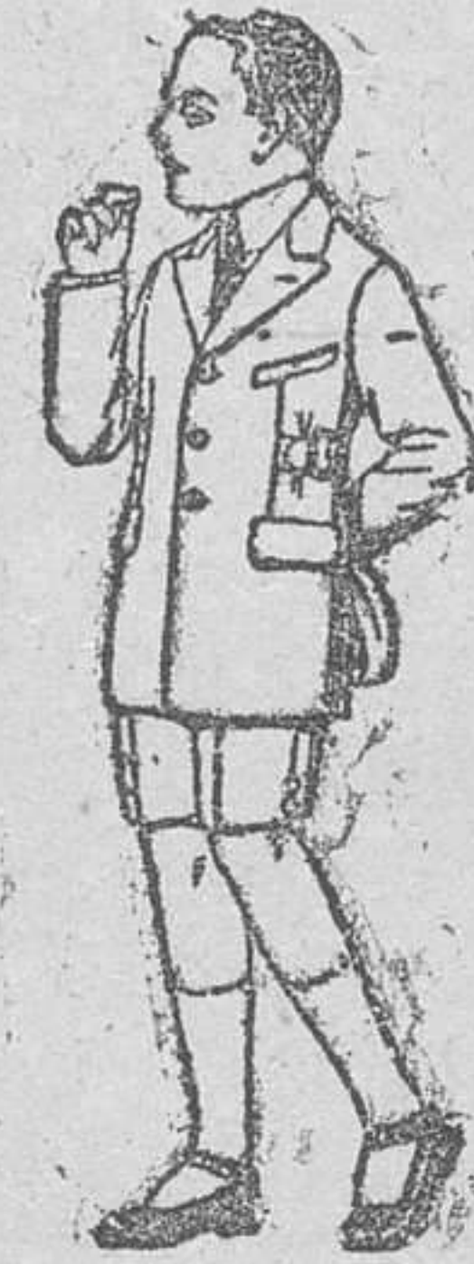
Trajes modelo Sport, de lanilla, estambre, melton, etcétera, para niños de 7 á 12 años, de pesetas 28 á 50.