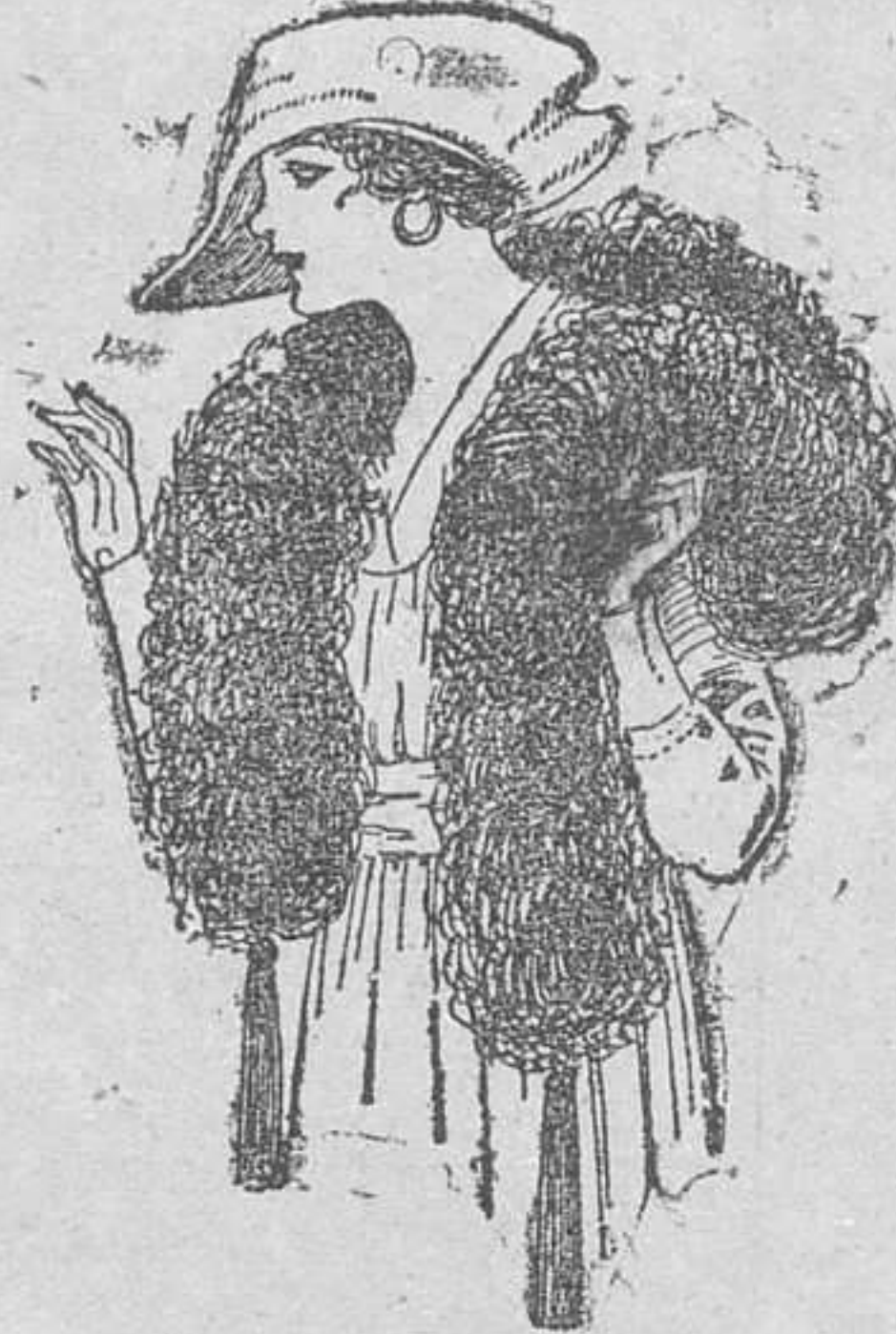
Boá de pluma de avestruz, en negro, blanco, café y gris, de pesetas 32 á 70.