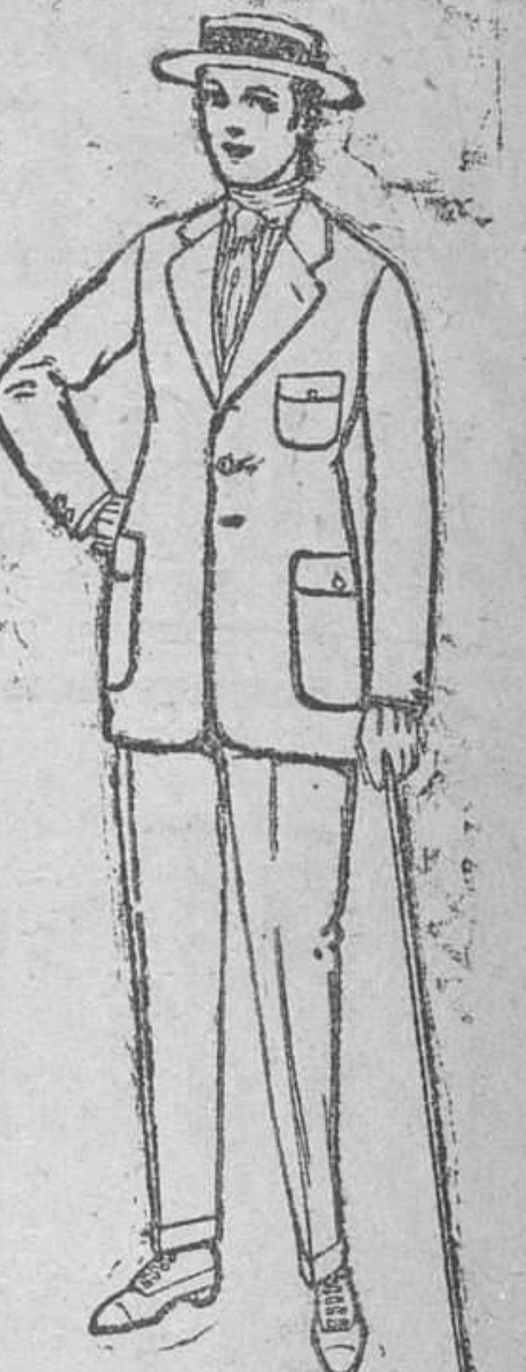
Trajes de dril crudo, kaki ó listado, de ptas. 17 á 48. El mismo modelo en estambre «Fresco», de pesetas 40 á 50.