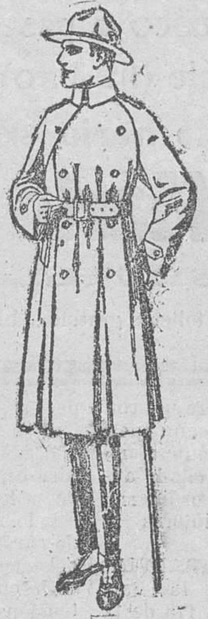
Gabanes impermeabilizados con cinturón «American trench coat», de pesetas 180 á 350.