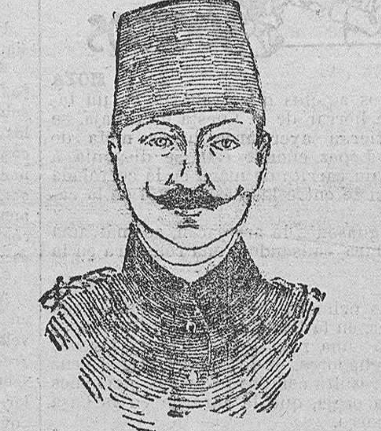
DSCHAWAT PACHA comandante de las tropas turcas de Bardenos.