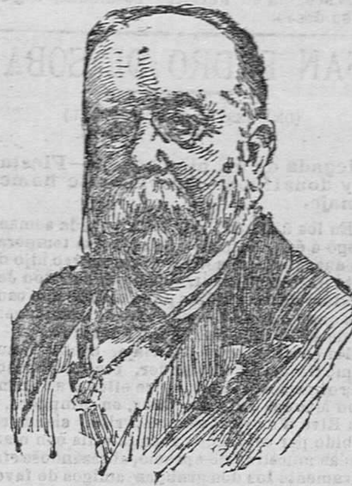
DON TEODORO LLORENTE

Ilustre poeta valenciano, fallecido el domingo en Valencia