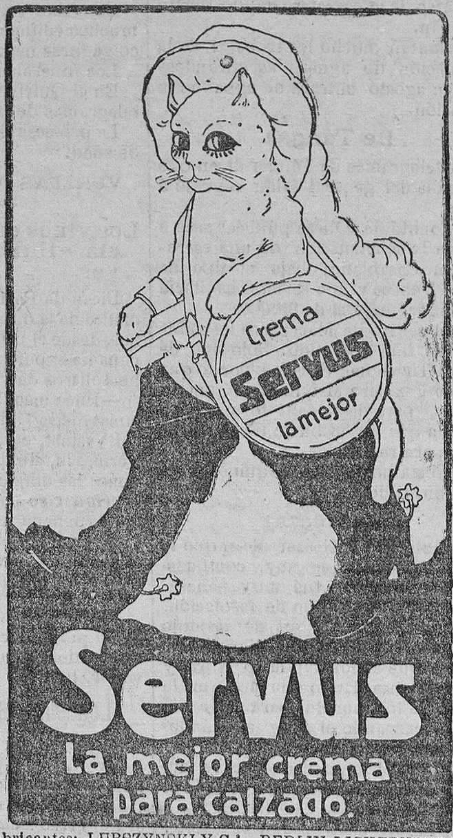
Fabricantes: LUBSZYNSKI Y C.ª, BERLIN-LICHTENBERG