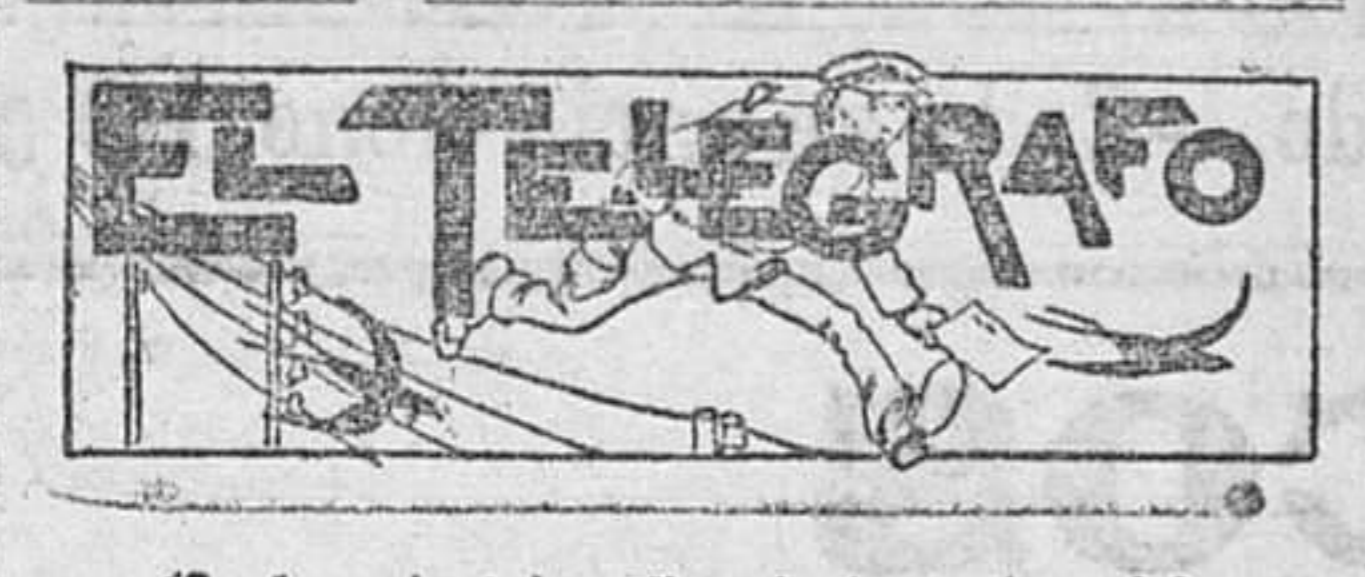
(Conferencia telegráfica de la madrugada)

dos por esos traficantes sin conciencia que hacen no pocas fortunas a expensas de la salud de todos.