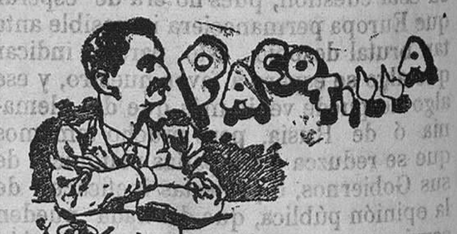
Me ha demudado la faz, hoy de color de máiz...