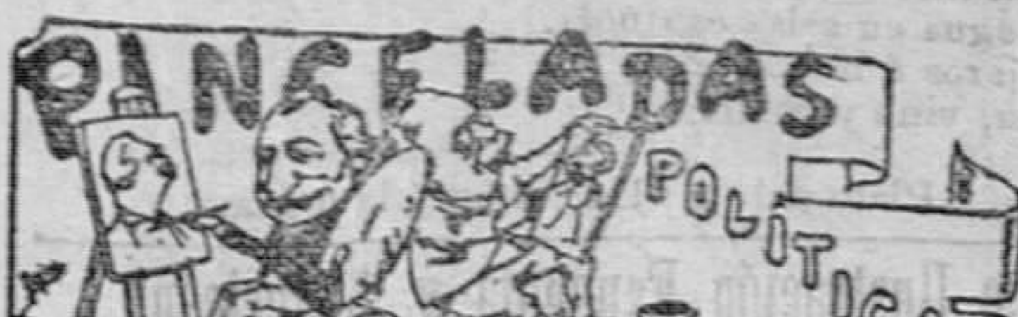
Lástima es, ¡voto á San! que en la presente ocasión

Quedan, pues, la cuestión de Alcalde y la